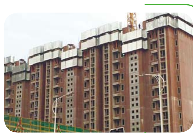
上海以裝配式建築技術建造的小區樓房。