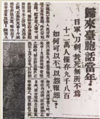
1945年12月24日《台灣新生報》第四版。

至2016年仍然不能大聲喧說的上述歷史細節，或許頂著更大風險幻蹤於小說家筆下。這不意謂大學生小說家在當時就知道世界全貌，卻突出了〈鄉村的教師〉與歷史、與現實的關係，幫讀者換個感覺讀小說。吳錦翔不是照抄真實人物，〈鄉村的教師〉卻是揣摩特定時空與人。