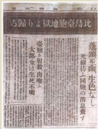
1945年12月24日《台灣新生報》第三版報導人吃人。

不知陳映真在1960年是否確實曉得以上事，也許當時比今天更容易聽說。然而，於今已鏽空、遺忘或經剪貼編造的，甚