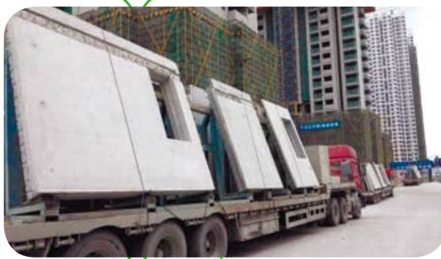
中國大陸裝配式建築標準化體系正在逐步完善。

此外，成本過高也是制約大陸裝配式建築發展的最重要瓶頸之一。以瀋陽一些住宅小區為例，裝配式建築的主要構件PC（預製裝配式混凝土）的成本一立方公尺最起碼要2300元（人民幣，下同），而傳統的現澆混凝土每立方公尺只需要1600~1800元。事實上，根據大陸一些業內人士的看法，如果做了這個裝配式建築，成本卻要高出1000元／平方公尺的話，這就沒有競爭力了。可見，大陸裝配式建築的建設還有很長的路要走。