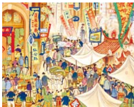
郭雪湖1930年的絹本膠彩作品《南街殷賑》。

做過六年墨西哥駐印度大使的詩人，奧克塔維奧·帕斯寫過一本《印度札記》，書裏只用一頁的篇幅，談及墨西哥與印度幾樣食物的相似之處。也許他壓根不知他的祖國，出口質高價昂的墨西哥螺肉罐頭。