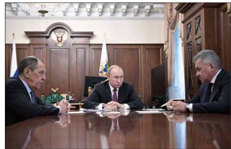
在俄羅斯莫斯科，俄羅斯總統普京（中）會晤外交部長拉夫羅夫（左）和國防部長紹伊古。（新華社/衛星社）

示談判的大門依然敞開，但既然現在已經走到暫停履約這一步，說明雙方的矛盾越來越深。在美國硬實力下降的背景下，為彌補常規軍事力量的不足，美國政府內部早就有聲音認為需要重新啟用戰術核武器。從宣佈啟動退出《中導條約》程序來看，川普政府確實在朝著這個方向前進。短期內美俄還會繼續談判和博弈，長期看情況會惡化，核不擴散體系正經受越來越嚴峻的挑戰。李勇慧認為，如果俄美最終都退出這一條約，將對全球戰略穩定造成極大影響，軍備競賽將難以避免。