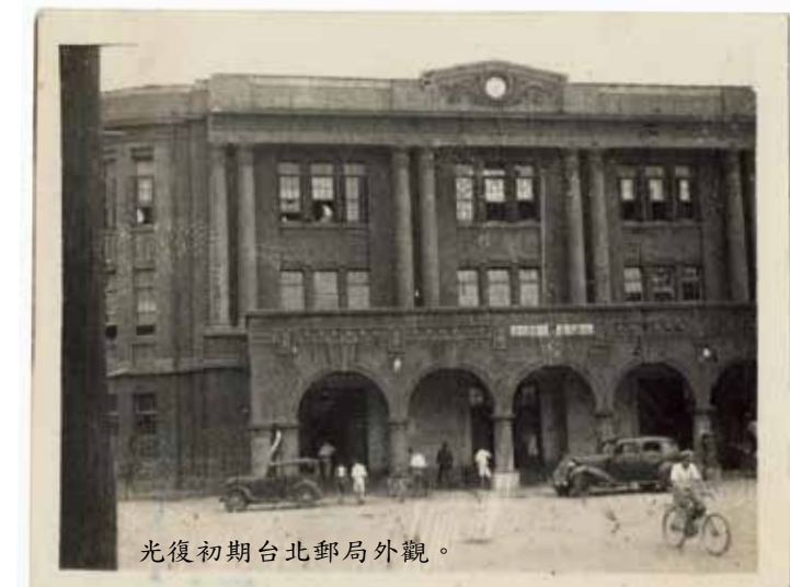
光復初期台北郵局外觀。