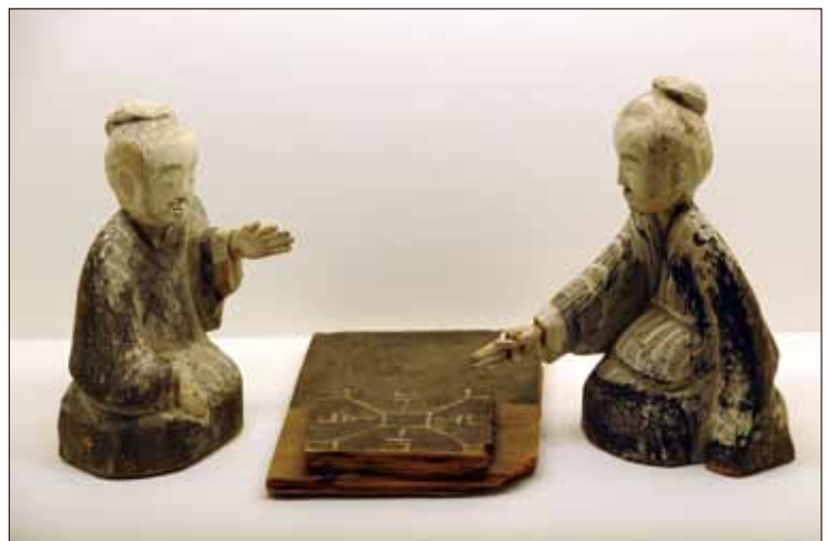
東漢時期國家一級文物——彩繪六博木俑。

南昌漢代海昏侯墓自 2011 年發掘以來，已出土 1 萬餘件（套）珍貴文物，對研究中國漢代政治、經濟、文化具有重要意義。