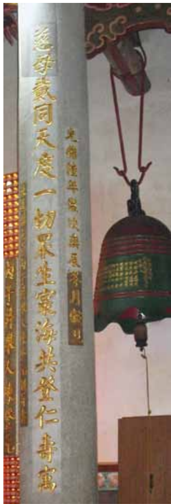
清光緒六年（1880）庚辰冬月，陳登元替士林慈誠宮正殿左右楹柱題寫對聯，落款曰：「檢選縣正堂丙子（1876）科舉人陳登元傳並書」。

土林舊稱八芝蘭。是原住民平埔族凱達格蘭人之社域 Pattsiran 地方，意思是「溫泉」。清末時因當地讀書風氣興盛，科考人才輩出，遂改稱「士林」，有「士子如林」之涵義。該地歷史悠久的慈誠宮（媽祖廟），位於遠近馳名的士林夜市之內。廟內自清光緒年間創作的石雕及多位雅士所撰寫的楹柱，在日據時期的改建當中並未拆毀，而是保留下來繼續使用，因此，今日可看到這兼具文學與圖像藝術的美感建築。但在今年的二二八連假中，只見來往夜市的遊人坐在慈聖宮前的階梯奮力品嚐夜市美食，而不懂得「登堂入室」。上述楹柱中，有一位寓居八芝蘭的名人一陳登元，在其取得「文學人」學位後的第四年，於正殿前的左右兩側楹柱上，親筆題寫「慈母戴同天度一切眾生寰海共登仁壽寓，誠民依我后願大千世界風波永息蕩平時」正楷對聯一副。他是一位熱愛祖國、深具台灣意識的知識分子。