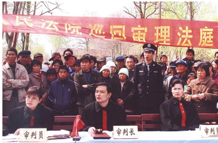
大陸法官到農村開巡回法庭，服務農民。

法律與經濟、中醫等專業，向來是港澳台人士報考大陸高校研究所聯招的重點方向。每年在夏潮聯合會完成報名手續的六百多位考生中，選考法律類者的比例都超過一成半，且多採用兼讀制的方式在大陸進修碩、博士。多數考生在台灣已有執業律師資格，並有穩定的收入與社會關係。從今年度起，他們只要根據大陸《取得國家法律職業資格的台灣居民在大陸從事律師執業管理辦法》的相關規定，取得法律職業資格後便可以在大陸開業，以他們同時熟悉兩岸法律事務，相信可以為兩岸提供便利的法律服務，也將更有益於兩岸人民的正常往來和發展。