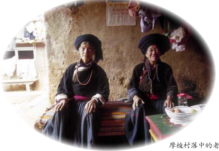
摩梭村落中的老人