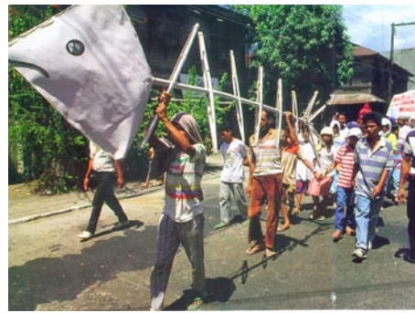
五一勞動節當天，菲律賓中部小島岷多羅漁村抗議菲日漁業協定。

一名法國歷史學家因兩年前惡意攻擊紀錄片《達爾文的惡夢》(Darwin's Nightmare)，2009年3月11日被巴黎法院判決毀謗罪成立。這則並不起眼的新聞，卻讓人不禁想起維多利亞湖畔那些受盡壓迫的人們。《達爾文的惡夢》是奧地利導演Hubert Sauper於2004年拍攝的一部紀錄片，該片藉由坦尚尼亞出口歐洲的尼羅河鱈魚貿易，突顯西方世界所謂的全球化，其實只是第三世界人民的貧困化。