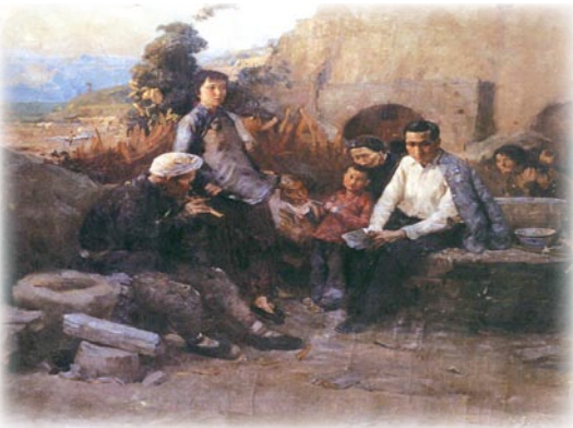
《洗星海在延安》油畫 于長拱 1957年

茅盾還是中國報告文學理論的奠基人。它的著名論文《關於「報告文學」》是我國較早的闡述報告文學理論的文章之一。茅盾認為「報告文學是從國外過來的新型文體」，是「不二價的最新輸入」，在中國的出現和發展，是因為「時代的要求」。茅盾針對當時我國文壇「審定」報告文學的所謂「標體」的現象指出，這樣做會影響從事這一文體寫作的某些青年作家的創造性。他認為，報告文學的形式範圍頗為寬闊，它「不以體式為界，而以性質為主」，而它的主要性質是「將生活中發生的某一事件立即報導給讀者大眾」。它具有濃厚的新聞性，但又不同於一般的「報章新聞」，因為它必須注意充分的形象化。茅盾還把報告文學與小說作品作了比較，認為好的報告需要具備小說所有的藝術上的條件——人物刻畫、環境的描寫、氛圍的渲染等等，但是它必須是注重在實有的某一事件和時間上的立即報導，強調了報告文學的真實性和即時性。在這篇論文中，茅盾還分析了報告文學所以產生而且風靡的原因，要求作家能夠適切地將社會上新發生的現象解剖給廣大讀者看。茅盾他的這些精闢論述，對我國報告文學的理論建設產生過重大影響，至今仍常被人們所引用。