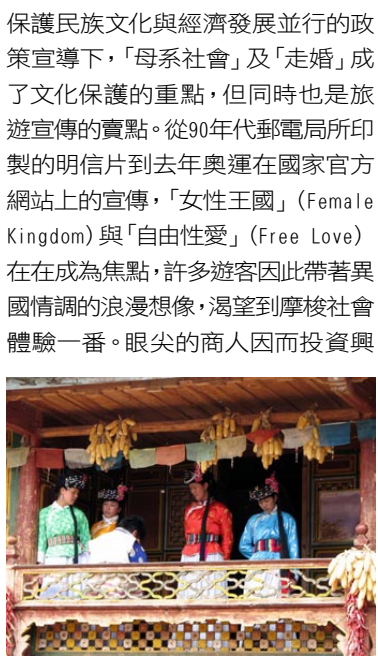
因為觀光業的發展，摩梭年輕人穿回摩梭服飾，以吸引觀光客。

知其母，不知其父」的謬誤，其實是片面強調其與父權社會一夫一妻制的差異性，所帶來的誤解。