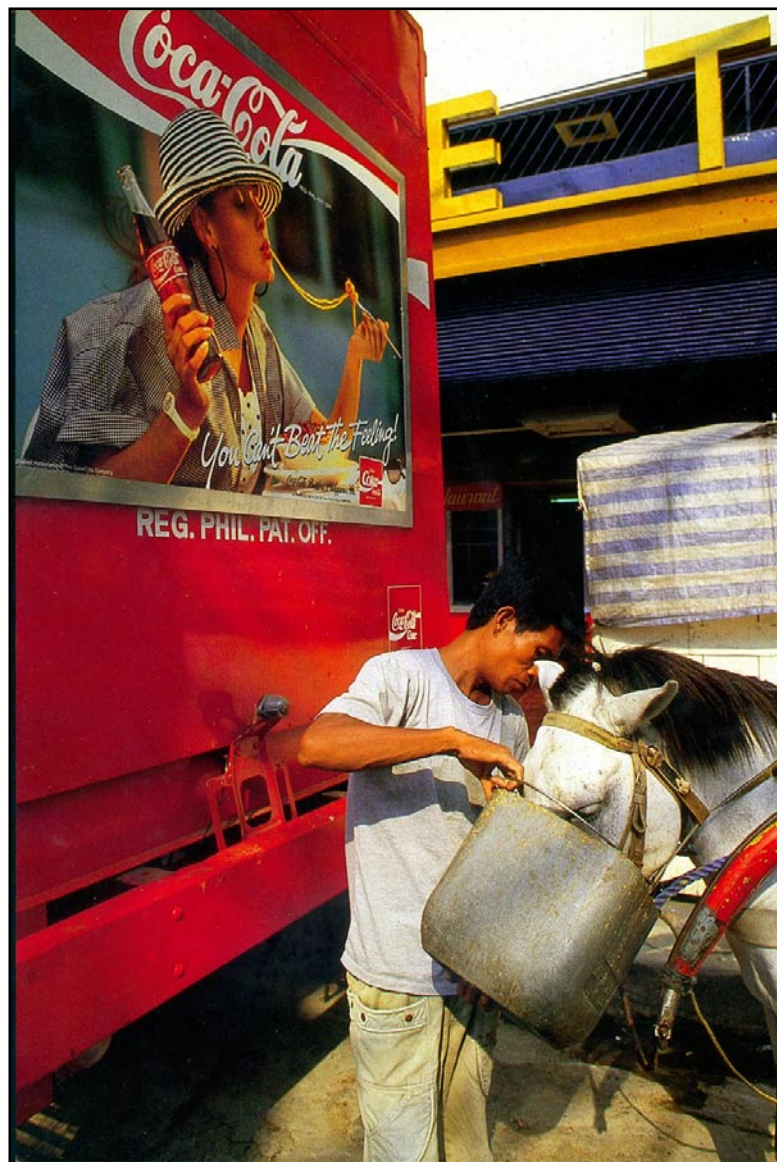
菲律賓首都馬尼拉唐人街的路旁邊,載可口可樂的貨車旁,馬車夫餵馬喝水。