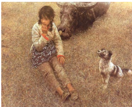
何多苓《春風已經甦醒》〔1982〕

《兩岸彝報》(下概稱「彝報」)的創刊號封面上，刊載了中國大陸當代畫家何多苓(1948-)的知名作品《春風已經甦醒》(1982;下稱「春風」)，畫面既凸顯又引人注目。若從單純的視覺效果來說，這個編輯安排是成功的，但若從這件作品背後的文化、政治意義，以及這件作品被廣為流傳的歷史脈絡，及其創作者在中國當代美術史的角色定位來說，卻著實存在值得商榷之處。