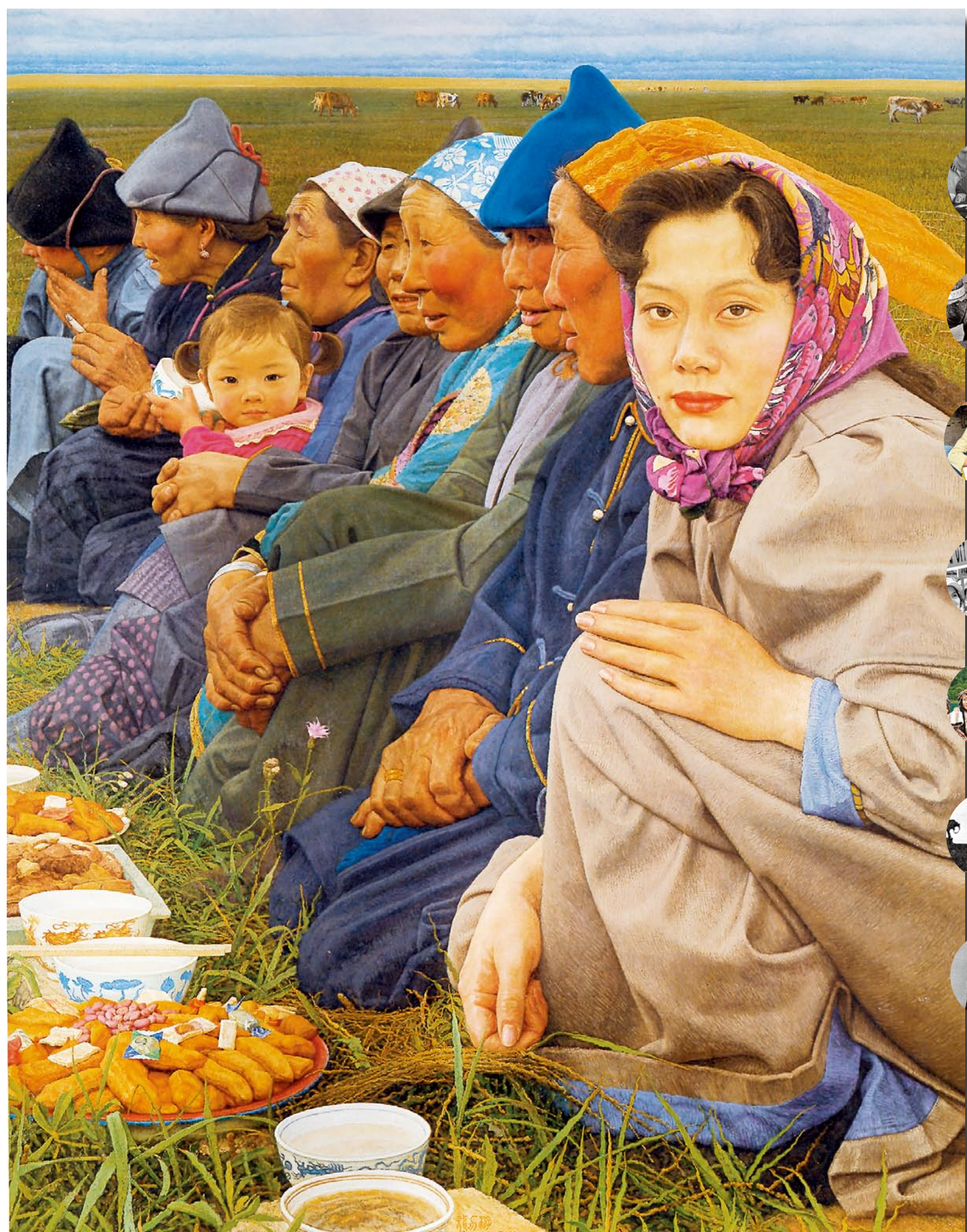
參加婚宴 龍力游 油畫 九〇年代