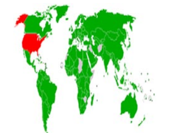
世界各國參與京都議定書的狀況 ●：既是締約國又簽署了條約的國家 ●：締約國但拒絕簽署條約的國家 ●：態度未定

遲。但是，發展中國家又必須追求並且保有自身發展的權利，我們不可能像那些富裕國的政治菁英們，將自身的發展建築在別人不發展的基礎之上。因此，尋找一種適合發展中國家的發展道路，不但是基於自身迫切的需要，也是為減緩全球暖化災害做出貢獻的重要手段。值得欣慰的是，77國集團(G77)這個代表聯合國發展中國家