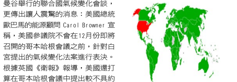
世界各國參與京都議定書的狀況 ●：既是締約國又簽署了條約的國家 ●：締約國但拒絕簽署條約的國家 ●：態度未定

過去全球的氣候協議經驗顯示，如《京都議定書》，發達國家對於自身改善碳排放，以及從資金與技術上幫助發展中國家解決碳排放的承諾，並沒有得到實現。也就是說，富裕的發達國家基於自身的利益考量，始終不願意正視其歷史責任。甚至，就在上個月(10月5日)於曼谷舉行的聯合國氣候變化會議，更傳出讓人震驚的消息：美國總統歐巴馬的能源顧問 Carol Browner 宣稱，美國參議院不會在12月份即將召開的哥本哈根會議之前，針對白宮提出的氣候變化法案進行表決。根據英國《衛報》報導，美國選打算在哥本哈根會議中提出較不具約束力的新辦法，來取代現有具強制力的《京都議定書》，同時，歐盟是否能抵抗美國的壓力還不得而知。也就是說，如果不以花了十二年整合的《京都議定書》為框架，做為新一回合氣候協定的基礎，那麼我們是不是又要花費下一個十二年重新談判，而不是立即著手實行節能減碳。因此，從美國這樣一種惡意的推遲態度看來，想要寄望富裕發達國家負責任的期望，只是緣木求魚。