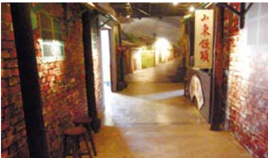
新竹市眷村博物館