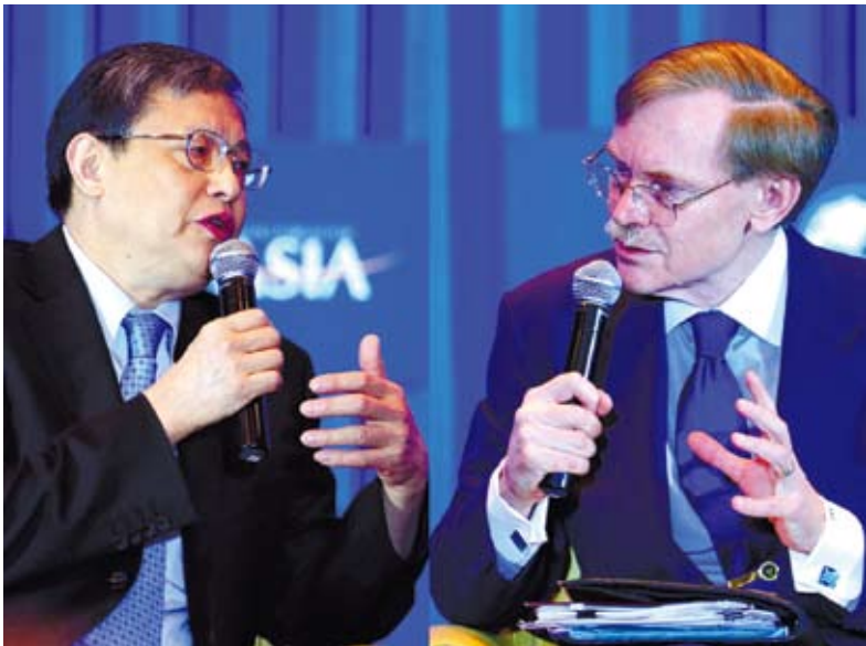
博鰲亞洲論壇秘書長周文重(左)與世界銀行行長佐利克就全球經濟走向、歐洲債務危機等問題進行對話。