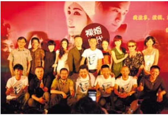
「裸婚時代」透過愛情悲歡所反映的大陸社會現狀，以及青年所面臨的處境，不正與台灣極其雷同。（網路圖片）