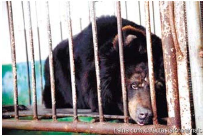
長期被囚禁在極小籠中的中國月熊，身心疾病和刻板行為都顯示了動物福利極差的情況。