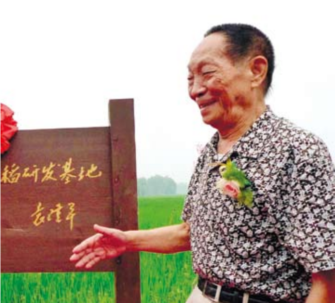
袁隆平參加長沙回龍湖有機超級雜交水稻研發基地揭牌儀式