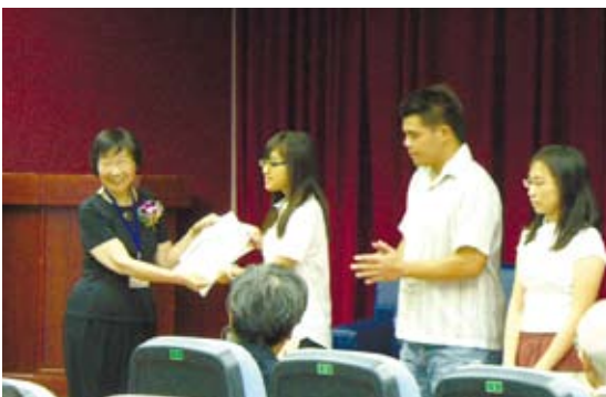
梁實秋國際學術研討會

我原本挑剔課堂內容太簡單，最後發現是自己太淺薄。回到大陸之後，我常會和朋友談起我在臺灣的幾位老師，雖然僅有半年的學習，但是他們身體力行教會我的卻足夠受用一生。我想我不會再迷失在對分數執著追求的路上，而是會用心學習好每一分知識。我也不會再因為自己懂得一點知識就沾沾自喜，而是要腳踏實地。「同學們你們聽懂了嗎？老師再講一遍哦，一定要注意聽哦！」教我翻譯的老師是一位60出頭的老奶奶，她總是面帶微笑，語氣和緩的對待課堂上同學提出的問題。在剛開始接觸這門翻譯課程時，我覺得它非常簡單