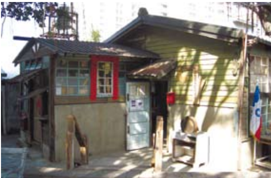
二空新村眷村文物工作室(網路圖片)