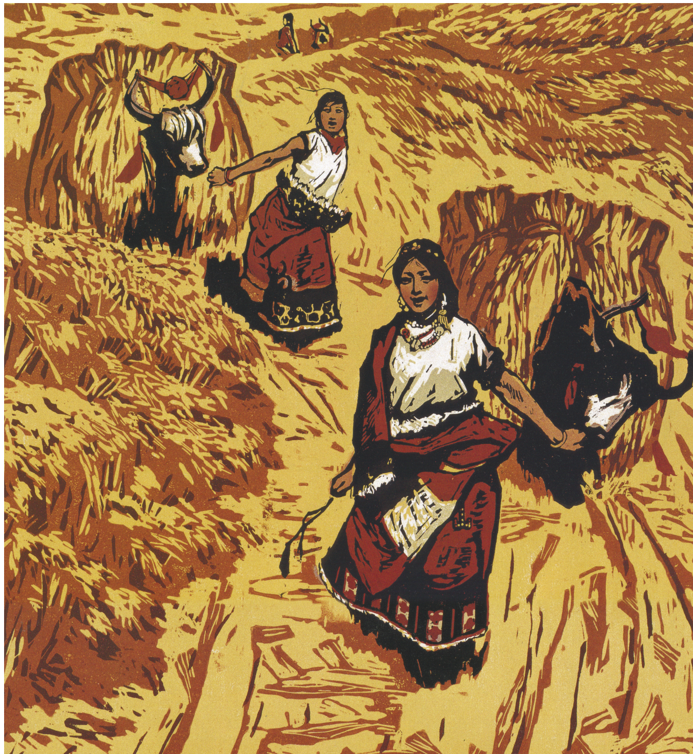
■ 初踏黃金路 李煥民 套色木刻 1963

好康大放送：即日起在全省7-11、ok、萊爾富買《四方報》送《犇報》，不要錯過了喔！