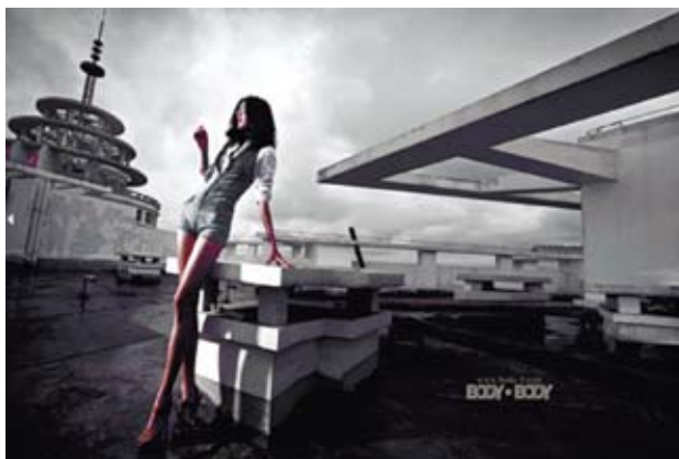
Body Body 攝影工作室作品

【龍脈相傳·共創未來】2012年第二屆兩岸犇報青年徵文比賽 ■主辦單位：兩岸和平發展論壇、《兩岸犇報》、《台聲雜誌》 ■活動內容：以「我的陸生同學」為題撰文投稿至本報，得獎者將受邀參加暑假期間所舉辦的「創意中國研習營」，暢遊京滬杭三地，走訪大陸文創產業的最新發展，歡迎青年朋友踴躍投稿！ ■徵文題目：我的陸生同學 以紀實、敘事散文等手法，暢敘學習與生活中對大陸同學的真實情感 ■徵文對象：台灣大專院校、研究所之在學青年（不含在職專班） 1) 本活動由兩岸主辦單位同步舉行（大陸同學請洽台聲網站） 2) 於參賽時間內繳交符合規格之參賽作品 3) 由於本活動含旅遊行程，患重大疾病需藥物控制者請勿報名 ■徵文格式：稿件1500-2000字以內，須以電腦打字，採用WORD檔案，投稿至本報信箱chaiwanbenpost@gmail.com，投稿信件標題應註明 [徵文獎參賽稿件]並附作者姓名、年齡、電話、地址、電郵、學校等資訊，未註明者恕不受理 ■活動時間：徵文時間一即日起至6月15日（以電子郵件收件紀錄為憑）評選時間一於截稿日起30日內公布評選結果 研習時間一2011年8月底，共12天行程 ■活動資訊：行程與更多詳情請見犇報官方部落格：chaiwanbenpost.blogspot.com