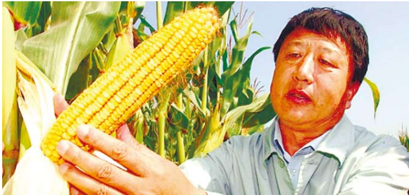
李登海全生命投入玉米雜交新品種。

李登海培育的玉米種，使中國大陸土地由每畝養活1個人提升到養活4.5個人；他的玉米種子已累計在全大陸10億畝土地上推廣，直接增加經濟效益1000億元。在大陸，李登海與「雜交水稻之父」袁隆平齊名，被種業界譽為「南袁北李」。