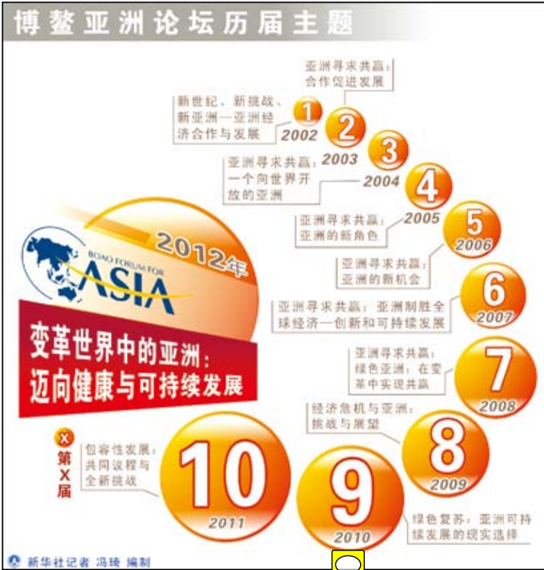
博鰲亞洲論壇歷屆主題。(新華社 馮琦 編制)

將有助於擴大人民幣離岸業務、推進人民幣國際化進程。在歐債危機影響、全球景氣尚不明朗的大環境下，台灣企業界呼籲，爭取台灣成為香港之外第二個人民幣離岸中心，以參與經營人民幣存款、貿易融資、金融商品等業務，擴大營運範圍。 要想在台灣建立人民幣離岸中心，就要有結算銀行進行貸投作用，並且建立在台人民幣回流的機制。