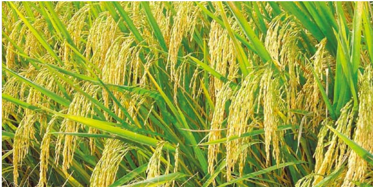
袁隆平的畝產900公斤雜交稻。