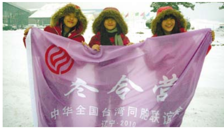
每年2月由中華全國台灣同胞聯誼會舉辦之冬令營

昏昏沉沉的睜開眼，拖著沉重的步伐，揮別了略顯倦態、笑容卻依稀可掬的空姐。跨過艙門，預期刺冷寒風會透 腿上僅有的絲襪，然而迎面而來的是失落感，我回到台灣了……。在瀋陽的八天行程就像童話故事灰姑娘，當指針走向十二點，我乘著爸爸的黑色轎車回到了那個熟悉的家，王子的笑靨不復見，唯一溫存的是這八天清晰可見的記憶。