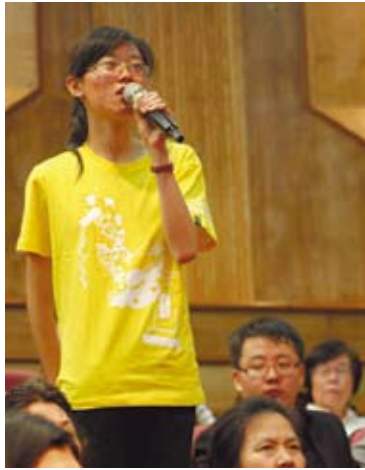
參與論壇的陸生舉手發言

去年台灣預計招收兩千多名陸生，實際來到台灣只有九百多人，其中一個重要的原因，就是法令的限制。陸生為什麼想來台灣？一個原因是大家覺得台灣與大陸社會不一樣，我們在台灣可以學習更多，可以發現未來考慮自己的未來，若是發現未來是不明朗的，怎麼可能會有更多的陸生來