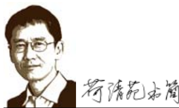
與台灣青年朋友的通信