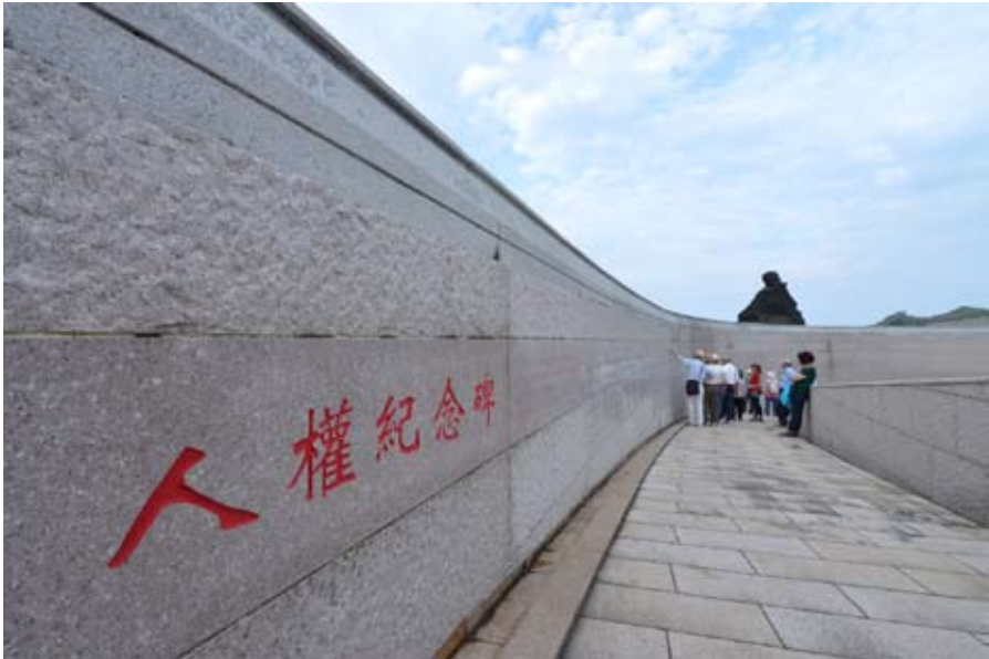
刻寫著受難人名字的「人權紀念碑」。

離開綠島前，我的心思早已不在島上美景，而是前輩們未完成的志業，究竟該如何在我們這輩裡繼續進行？