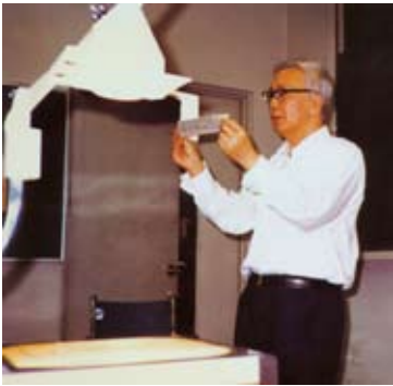
華羅庚生前最後一張照片。

回國後短短的幾年中，他在數學領域裡的研究碩果累累。他寫成的論文《典型域上的多元複變函數論》於1957年1月獲國家發明一等獎，並先後出版了中、俄、英文版專著；1957年出版《數論導引》；1959年萊比錫首先用德文出版了《指數和的估計及其在數論中的應用》，又先後出版了俄文版和中文版；1963年他和他的學生萬哲先合寫的《典型群》一書出版。