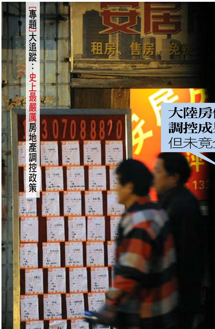
【專題】大追蹤：史上最嚴厲房地產調控政策