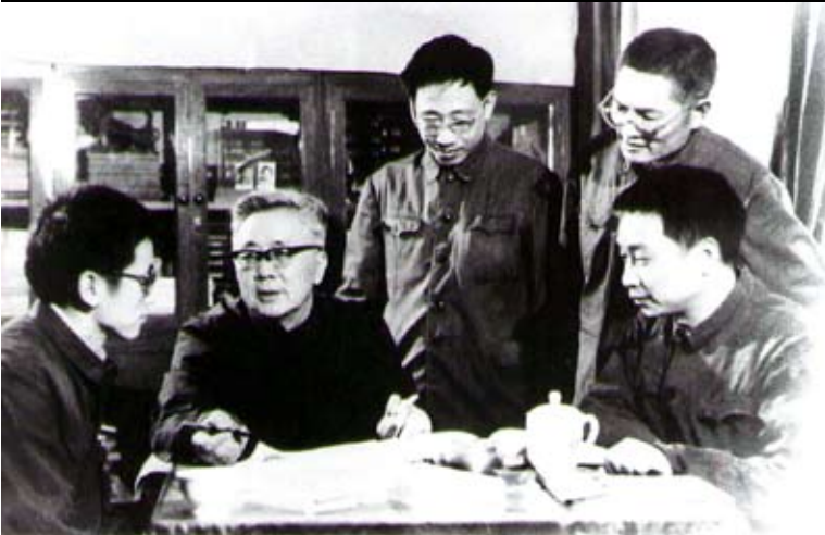
1970年代華羅庚深入廣西的工廠內講解優選法。