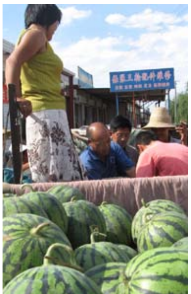
河北保定農村合作經濟。