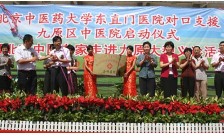
北京中醫藥大學東直門醫院對口支援包頭市九原區中醫院啟動儀式。（網路圖片）