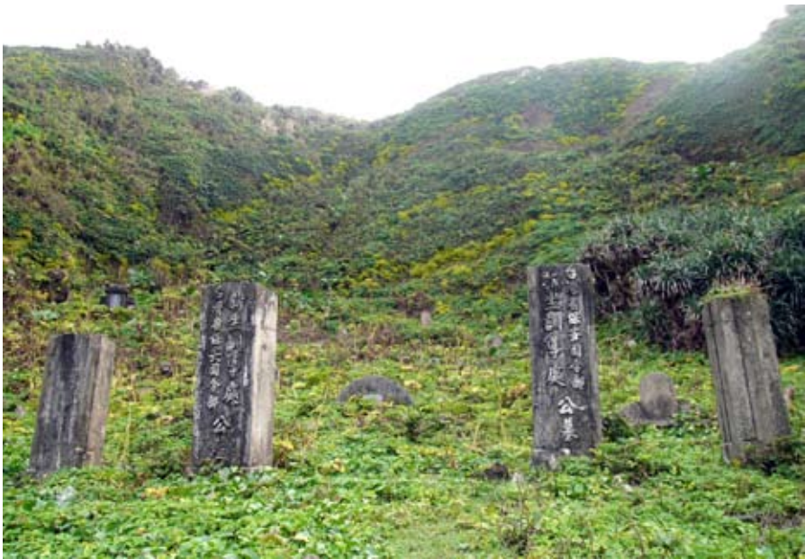
綠島新生訓導處「十三中隊」公墓，安息於此的是當時病逝或自殺的受難者。