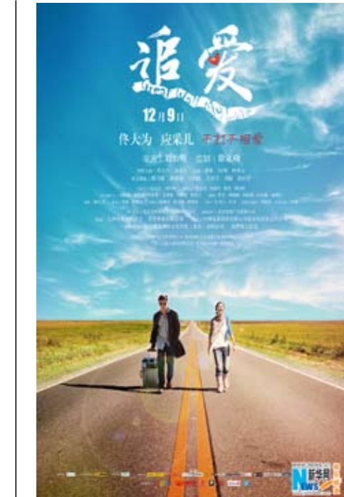
愛情喜劇公路電影《追愛》上映海報。