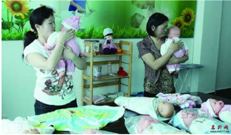
生育專家預計，龍年嬰兒較往年增長5%，推高了龍年月嫂薪資暴漲。

較往年增長5%，而這正是推高龍年月嫂薪酬暴漲的主要原因。據北京新陽光月嫂家政公司的工作人員王女士介紹，目前該公司有50多位月嫂，目前大多數春節前已經預定出去了，基本都在顧主家中工作，但現在每天預定電話還是被打爆。同時，伴隨大陸經濟快速發展和人民生活品質不斷提升，越來越多年輕父母更重視對子女生活教育，傳統「老人帶小、伺候月子」的方式已經不能完全滿足初為父母的期望，而具備「新生兒科學餵養、產婦護理、新生兒行為訓練」等技術的專業家政服務無疑滿足了市場需求。家庭不惜重金聘請經驗豐富的月嫂，她們的工資水漲船高就不足為奇了。（合作媒體：你好台灣網）