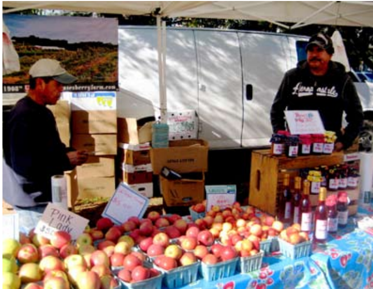
康乃狄克州的新澳(New Haven)市集。（網路圖片）

美國可直接食用的甜玉米(sweet corn)，甜玉米的澱粉度較低，甜嫩多汁，更像是蔬菜而不完全是穀物。（網路圖片）