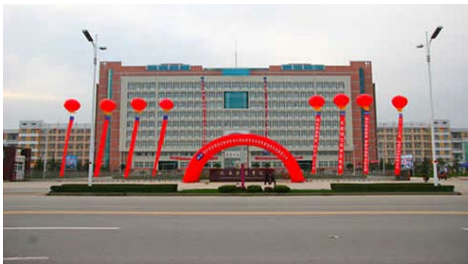
咸陽中醫藥大學