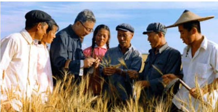
1974年華羅庚教授（左三）文革中仍深入農村推廣優選法和統籌法。（網路圖片）

編按 華羅庚先生（1910年11月12日～1985年6月12日），國際數學大師，中國科學院院士，是中國解析數論、矩陣幾何學、典型群、自安函數論等多方面研究的創始人和開拓者。他為中國數學的發展作出了無與倫比的貢獻，被譽為「中國現代數學之父」。