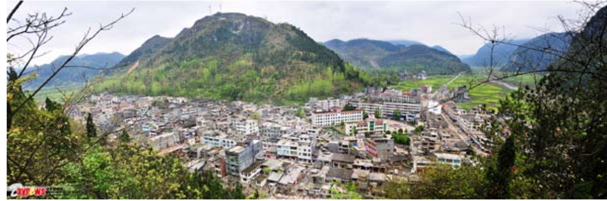
貴州省印江縣木黃鎮的小城鎮建設。(網路圖片)