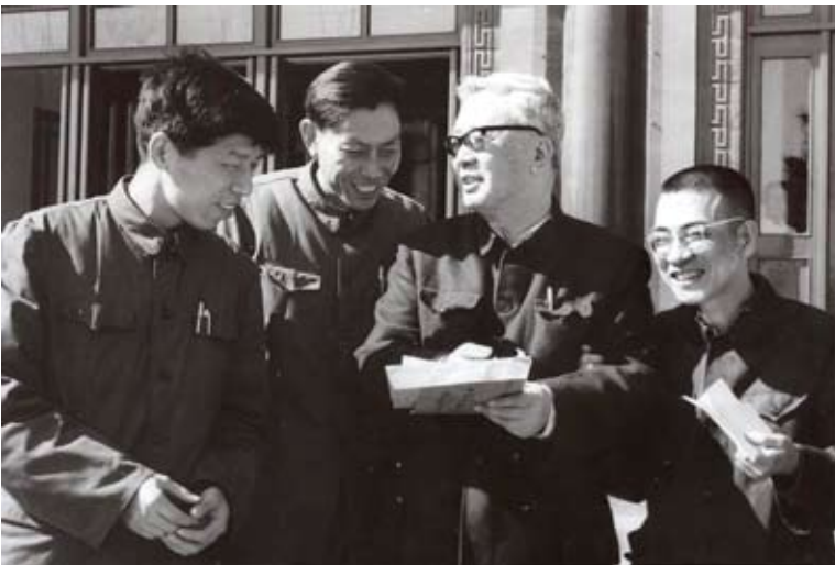
左起分別為：楊樂、張廣厚、華羅庚、陳景潤。（網路圖片）