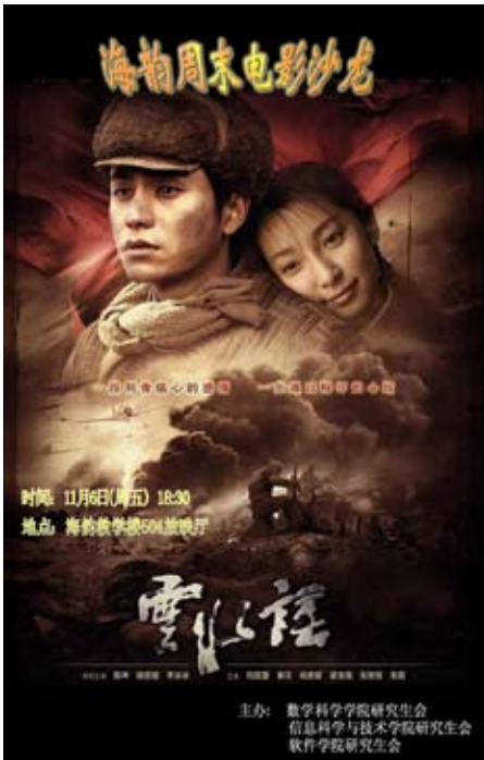
《雲水謠》由上世紀40年代兩個台灣年輕人的邂逅開始。