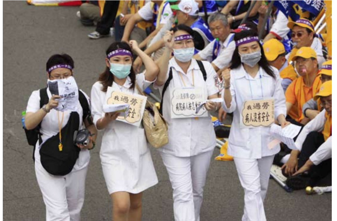
這個屬於勞動者的五月，醫護人員的權益成為勞工遊行的議題。