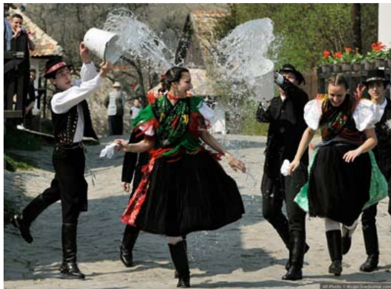
匈牙利東部的傳統民族服飾與舞蹈（網路圖片）

但是學術的水準仍然很突出，也很嚴格。藉由老師們的教導，我們能用匈牙利文流利地把自己的想法與感覺寫下來。