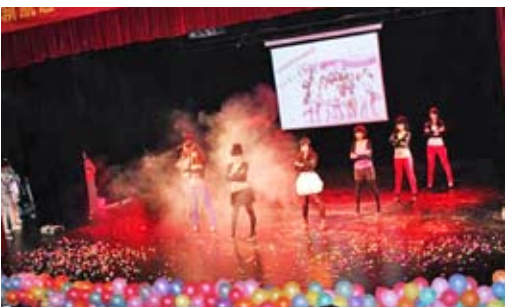
南京大學新聞傳播學院迎新晚會