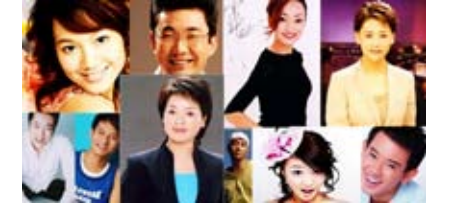
浙傳培育出許多大陸影視新聞界知名人物