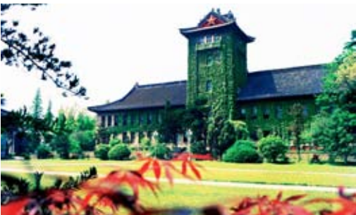
南京大學新聞傳播學院擁有精緻而務實的學習條件

綜合實力強勁的南京大學，在大陸高校中的排名一直穩定在前十位。雖然建系晚於復旦、人大等新聞名校，但南大的金字招牌還是吸引了許多新聞界的名師。如研究新聞理論的丁柏銓，研究新聞實踐的丁和根，研究傳播學理論的段京肅和都是這些研究領域內的重要學者，杜駿飛教授是大陸最早研究網路傳播的學者之一，出版的許多著作如《網路傳播學》等是研究網路傳播的必讀經典之一。