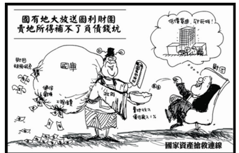
抗議國有地標售解禁的漫畫

讓社會住宅在公有的國營事業土地上興建，特別是這些尚未開發的土地，其規模以及地點都具有指標性，同時也標誌著社會住宅並非是一種作為住宅市場外的社會扶助的補充，反而是回應M型社會結構的積極取向，也是重振國營事業公共性聲望的機遇，而且是可遇而不可求的機遇！