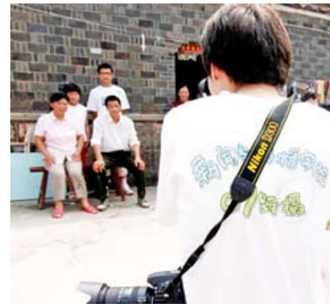
南師新攝系學生為農民工家庭拍攝全家福