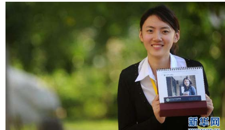
「最美陸生」入選台灣校園桌曆（新華網）

一年前，兩岸之間的密切交流進入到新的階段，政府開放陸生來台，兩岸之間學子開始了更為直接的互動接觸。新學期第一堂課，教室裡還是生面孔，忽然一位同學自我介紹：「諸位好，我打山東來的，我是…」一時之間，全班其他本地同學開始議論紛紛，對這位大陸同學充滿好奇。也許是歷史的偶然，也可能是現實上的必然，總之，陸生開始正式踏入我們臺灣人的生活，並開啟了新的故事篇章。不能免俗的，我也和其他同學一樣，對大陸學生充滿了新鮮感和疑惑重重。但隨著日子一長，友善的客套褪去，陸生熱潮漸退，新的問題就是我們究竟如何看待這些外地來的「大陸同胞」。台灣社會不是一言堂，充滿了各式各樣的不同立場，於是在逐漸相識的過程中，兩岸長期的文化差