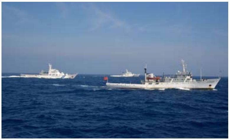
中國大陸漁政船編隊在釣魚島附近海域排除日方船隻干擾並嚴正交涉。

中國大陸的和平發展道路與互利共贏的開放戰略，是否能有效維護中國自身利益，並能繼續同世界各國一起推動建設持久和平、共同繁榮的和諧世界，讓我們拭目以待！