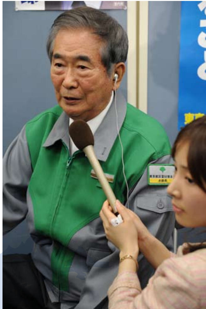
東京都知事石原慎太郎（圖中接受訪問者）高調宣佈購買釣魚島計畫以來，日方各種勢力蠢蠢欲動，從設立捐款帳戶、國會質詢、議員視察直至組織政客赴釣魚島「釣魚」。