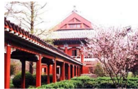
南師新聞專業被稱為江蘇新聞學的「第一塊牌子」