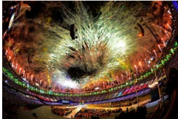
第30屆夏季奧林匹克運動會閉幕式在倫敦奧林匹克體育場舉行。這是閉幕式上的焰火表演。

相對於台灣觀眾對倫敦奧運的「冷處理」，經歷過氣勢恢宏的北京奧運會開幕式的大陸觀眾對奧運會的熱情顯然並未退潮。在大陸各地，圍繞倫敦奧運會舉辦的各類主題活動緊鑼密鼓的展開，顯示奧運元素在大陸激發的蓬勃熱情。 一場崑崙山源水採集祈福儀式在青海