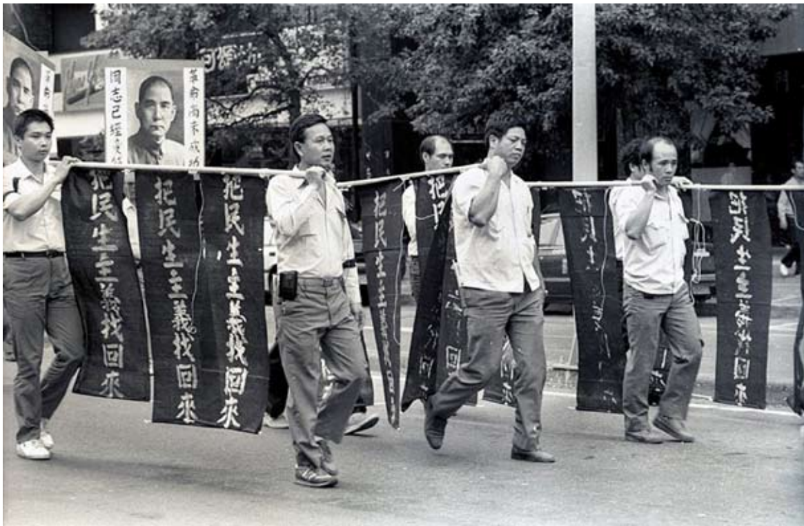
國營事業員工抗議私營化