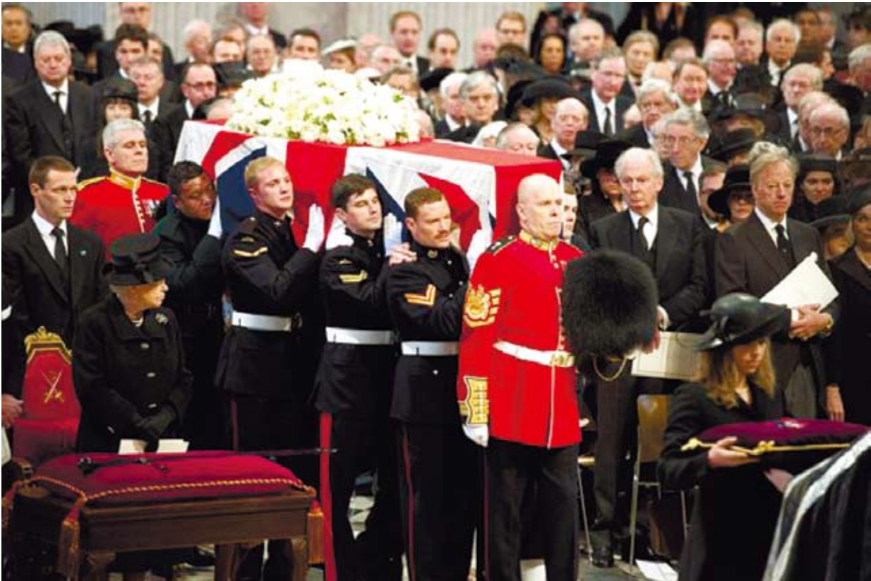
余契爾死了，但余契爾主義的「盜版」們卻仍在世界各地對其經濟主張進行拜物教式的病態崇拜。（網路圖片）

過去台獨總是妄想加入美日安保條約，保障台灣獨立的安全。如今不分台獨或獨台，為了維護自身利益，一味將美國與日本的勢力引進，大張旗鼓地宣告加入美日反共軍事同盟的行列。台灣「選邊站」的態勢愈來愈明顯，兩岸關係的進程只能停留在經濟與社會的交流，台灣依然要做美日軍事霸權的順民。漁業協定的簽署，絕不是為了漁民的生計與東海區域的和平，不過是在強化與美日之間的同盟關係，鞏固美日在東亞的軍事優勢。台灣自甘為美日「以台制中」戰略的棋子，《東海和平倡議》與《台日漁業協定》成為破壞和平的兇手，潑了兩岸關係一桶冷水。台灣拿主權換漁權，這個代價未免也太大！