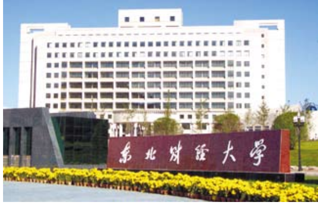
東北財經大學有開辦雙校園模式的聯合培養項目，大學前兩年在東財國際商學院學習，後兩年在國外合作大學學習，符合畢業條件的學生，可以同時獲得東財和國外合作大學兩個學士學位。（網路圖片）