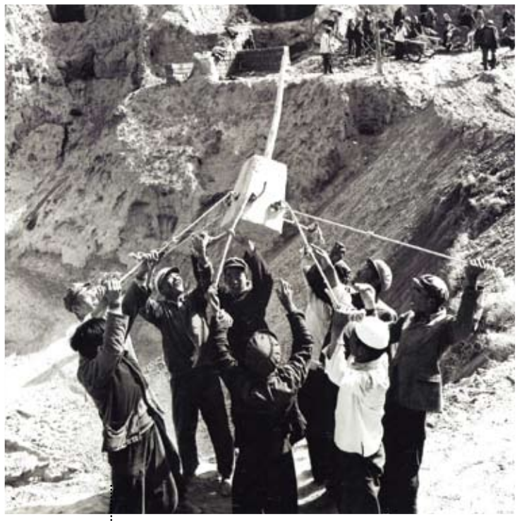
20世紀70年代，在生產合作組織的建立之後開展的人民公社運動帶來了極為重要的經驗。圖為1974年10月，寧夏自治區關橋公社脫產大隊興建七公里長的脫場引水渠，社員在打夯。(蘇俊慧攝/民族畫報)

【編按】近年來有關「中國崛起」的各種論述方興未艾，關於當代中國社會性質的討論與質疑也莫衷一是。實事求是地說，上述問題的討論不僅涉及這個古老民族如何從半殖民半封建社會走向社會主義現代化的崎嶇道路，從世界史的角度來看，也意味著廣大第三世界人民如何從西方帝國主義的壓迫與宰制中解放出來的、一條可供借鑑的出路。針對這個問題，著名全球化問題專家、國際政治經濟學家、依附理論的主要代表人物之一：薩米爾·阿明(Samir Amin)，近日在美國《每月評論》(Monthly Review)雜誌2013年第3期，以《China 2013》為題提出他的觀察與見解，值得關心中國未來與人類發展前景的台灣讀者參考。本刊將依據原文的章節〈小農生產的「中國特色」〉、〈作為過渡階段的國家資本主義〉、〈中國每天都站在十字路口〉陸續在《兩岸薈報》思潮版刊發，敬請關注。