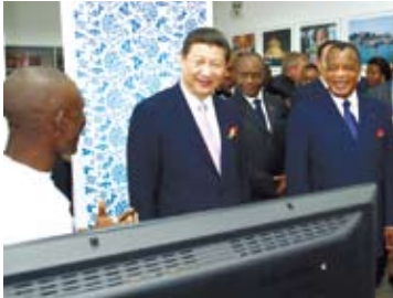
大陸國家主席習近平與剛果共和國總統出席恩古瓦比大學圖書館啟用和中國館揭牌儀式。

無論如何，習近平在就任大陸國家主席後即出訪非洲，從某個意義來說，乃是對外顯現其世界秩序觀的一些重要特徵，而習近平最近勾勒的「世界夢」，似乎也愈加明確起來。