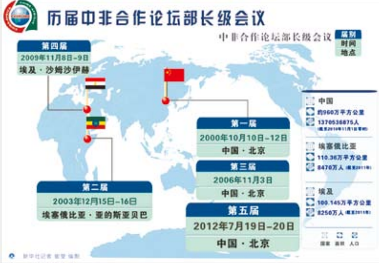
歷屆中非合作論壇部長級會議舉辦時間與地點。（製表：新華社）

無論如何，習近平在就任大陸國家主席後即出訪非洲，從某個意義來說，乃是對外顯現其世界秩序觀的一些重要特徵，而習近平最近勾勒的「世界夢」，似乎也愈加明確起來。