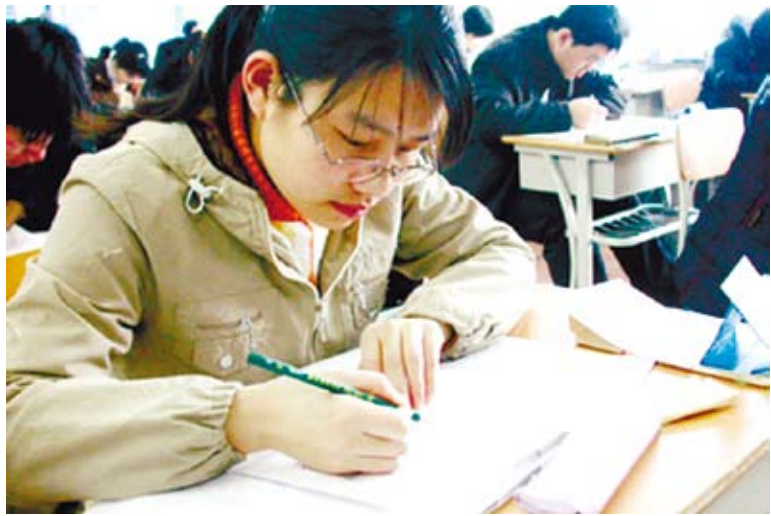
準備考試或許是許多兩岸學生生活中最深刻也最撞牆的記憶，但也因為有著共同的悲難目標，而累積出同學間的革命情感。（網路圖片）