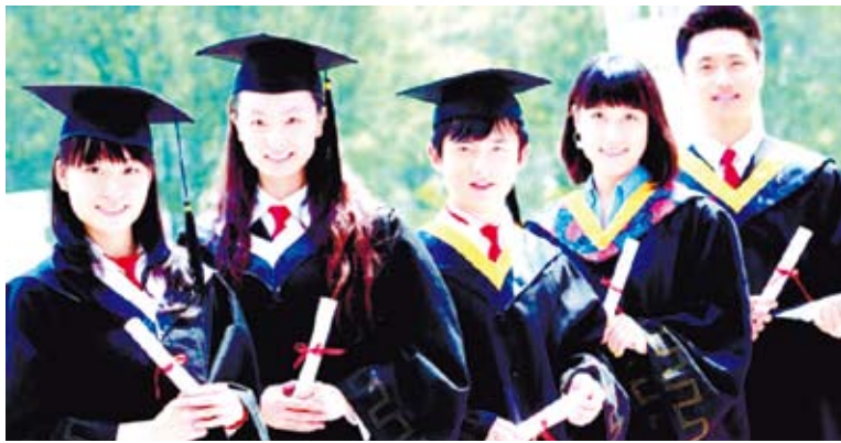
到大陸求學與就業，是越來越多台灣學子的選擇，在體驗過更多不同的地方生活、接觸過更多不同的人與事，才能鍛鍊出異中求同的自信。（網路圖片）

阿碧個子高高瘦瘦的，留著齊耳短發，大大的眼睛清澈中閃爍著智慧的光芒，喜歡穿開司米型的大毛衫，下面常常著花色的褲子，個人風格很