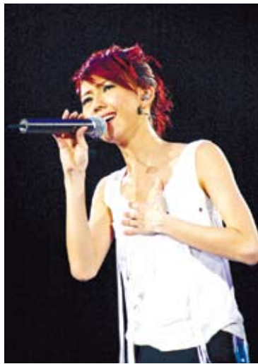
流行歌曲往往是兩岸學生交流中最熱切的共同話題與青春記憶，圖為歌手孫燕姿演唱在兩岸都很受歡迎的熱門歌曲「我們的紀念日」。（網路圖片）

去，遇見之後都相互為伴去完成複雜的入學手續。 大學剛入學，對大多數人來說，來到一個新的環境，難免有些不適應，或者覺得孤單。而我們開學即相識，加上宿舍離得也很近，便順理成章地在以後的日子結伴而行。時間久了，彼此間的一個眼神、一個微笑，都會知道對方在想什麼，很是默契。最「默契」的，是在一次英語考試中，我們的考場並不在一棟樓上，距離很遠，當考試結束後，我們見了面，都悶悶不樂的，說後才知道，我們在同一道題上犯了相同的錯誤，且都沒有將選好的答案寫在答題卡上。 有時，我們也會對一些事情有不同的觀點，從而出現分歧，這些分歧可能跟從小接受的教育和成長環境有關吧。比如，宿舍樓門前有塊草坪，經常會看到有人為了少走幾步，從草坪中踏過去，時間久了，就走出一條小道。剛開始我看到別人走也會憤慨一番，可到後來自己也突破底線，加入了踐踏草坪的行列之中，因為這條