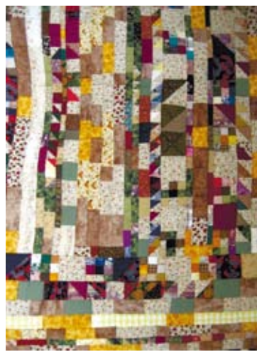
《我家門前有條河》·100x150cm·Z拼布作品。

Z ：法國當代社會主義者，米歇爾·博德(Michel Beaud)在其所著《資本主義史1500-1980》一書裡，有這樣的總結，「資本主義帶來無產階級化、工資支付制、城市化、和消費目標與生產進程及生活方式的一致性」。