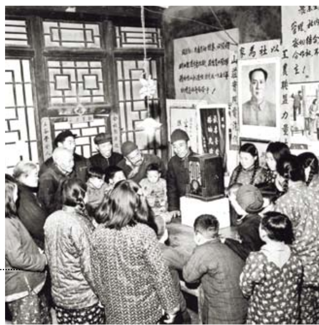
中國革命解決土地問題的獨特之處，在於農民分得的耕地並未私有化；它仍然是國家財產，而農村家庭所使用的僅僅是使用權。圖為1956年春節，河北省房山縣水利站發電，村民在聽收音機。