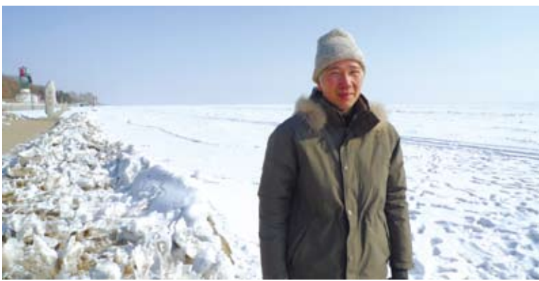
如果用「溫度」來比喻陳映真思想的話，那麼他的思想的特色是冰火同源——滾燙的對世信念與冷悞的自我懷疑。圖為本文作者趙剛攝於黑龍江興凱湖。（圖／人間出版社）

陳映真的文學所展現的正是這樣的一個思想過程。我們閱讀陳映真，當然是想要向他學習，好讓我們自己成長。在學習中，這樣的一種「過程性的陳映真」的體會尤其重要。尤其當我們知道，在中國的知識傳統中，知識分子的學習不是以經典、著作，甚或言教，為單一對象，而更是向一個作為整體的人與身的學習。緣是之故，陳映真文學的另一個深刻意義恰恰在於提示了一個重要的知識的與倫理的問題：「如今，我們如何向一個人學習？」昔日，我的讀書習慣是把人和作品切割，把人和時代切割，把作品和時代切割，抽象地理解「思想」或「理論」，習得其中的抽象思辨方法與概念，也讓我理解了如何回答上面那個問