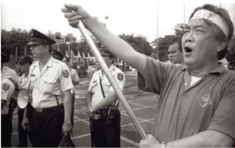
陳映真的文學願引讀者走向歷史、走向現實、走向第三世界。圖為1996年5月1日，陳映真參加在高雄舉辦的五一遊行。

如果用「溫度」來比喻陳映真思想的話，那麼他的思想的特色是冰火同源——滾燙的對世信念與冷悞的自我懷疑。圖為本文作者趙剛攝於黑龍江興凱湖。 如果用「溫度」來比喻陳映真思想的話，那麼他的思想的特色是冰火同源。我曾在前一本書《求索》的序言裡，如此描述陳映真文學，說它「總是蘊藏著一把奇異的熱火與一根獨特的冰針」。火，是陳映真滾燙的對世信念，而冰則是他冷悞的自我懷疑。這裡，陳映真說：「因為我們相信，我們希望，我們愛……」（注二）。那兒，陳映真又說：「革命者和頹廢者，天神和魔障，聖徒與敗德者，原是這麼相互酷似的學生兒啊」。對著他的亡友吳耀忠，陳映真幾乎可說是哭泣地說：「但願你把一切愛你的朋友們心中的黑暗與頹廢，全都攆了去……」（注三）。陳映真的思想因此不只是思辨性的，更也是情感性的、道德性的，乃至「宗教性」的。我們體會陳映真的思想狀態，不應以一種對思想家的習見冷冰理智的設想去體會。或許，我們甚至也不應該將陳映真的思想抽象地、形上地結論式地標定在一種「二元性」上。那樣也可能會誤導。「陳映真思想」不是一種純粹的狀態，也不是一種結果，而是一種過程——一個人如何和自己的虛無、犬儒，與絕望鬥爭的過程。