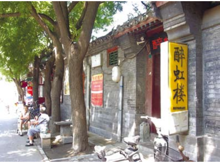
醉虹樓所在的帽兒胡同，老人們坐在樹蔭下聊天。（8月8日）

近幾年南鑼鼓巷火爆興起，而隨著兩岸往來更趨熱絡，「台灣熱」風行大陸，王印夫婦的生意也越來越好。到這裡來的，不僅有常住北京思念「家鄉味」的台胞，還有慕名而來尋找地道「台灣味」的大陸遊客。