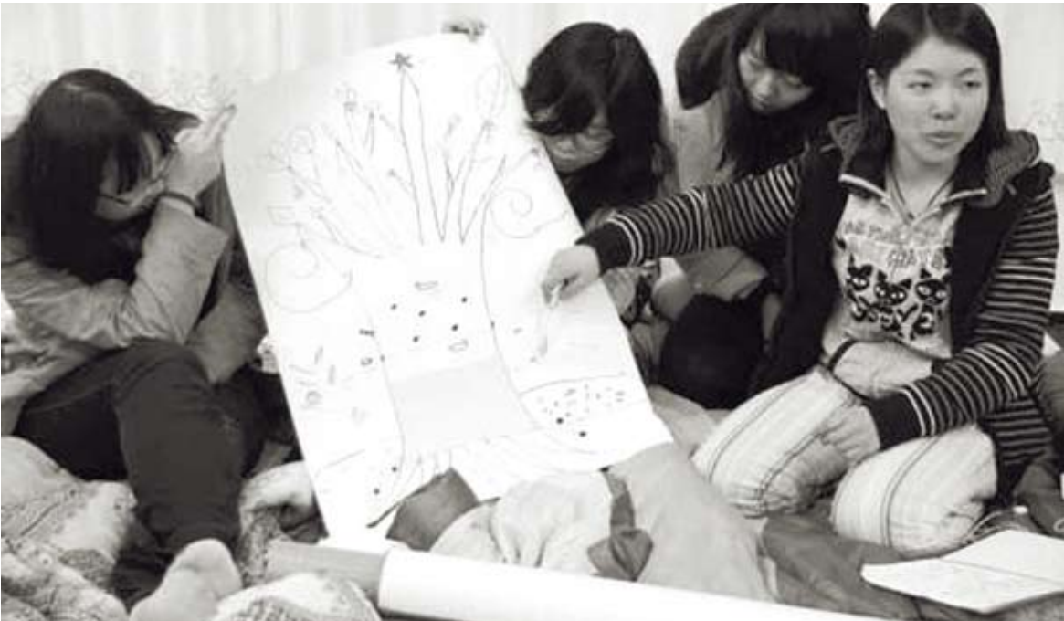
夜間反思會學生在分享一天所得。