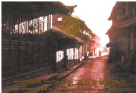
晨曦照耀著大研古城。

張藝謀執導的《印象麗江》觀後打幾分呢？給他70可以嗎？再添3分好了。他在桂林山水編導的《劉三姐》，我也看過。很長一段時間以來，張導似乎總供應諸如此類的大菜，他不是漸漸下崗了。