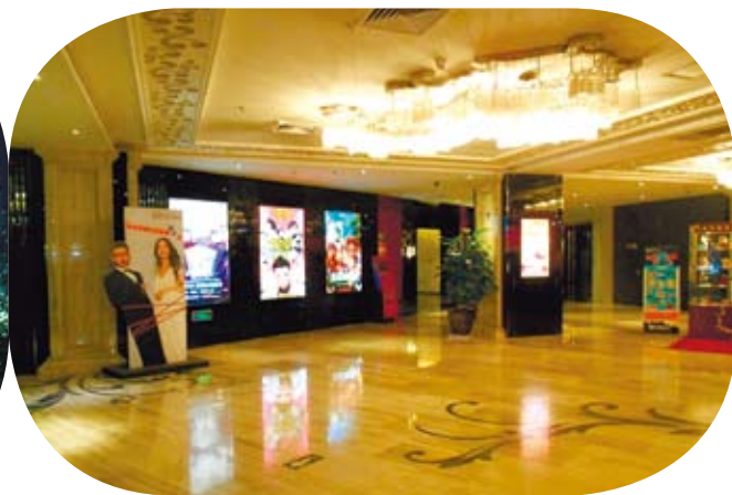
北京國際電影節現場。