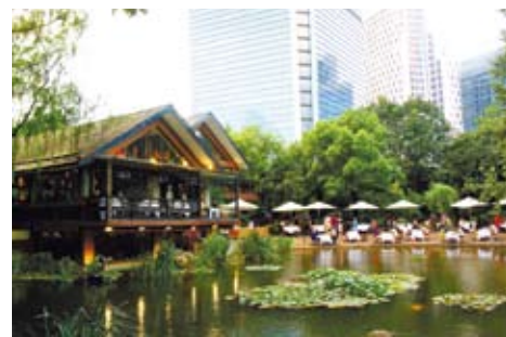
靜安公園，掩映在高樓大廈間，更顯禪境安逸。