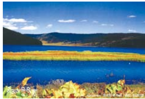
站在屬都湖畔。

自然讓脈搏慢跳鞋履放緩，隨時停駐速度的行進，呼吸調勻，如今規劃屬都湖3.3公里的步道，這一段不妨好好把它走完，別張望岸邊靜滯的遊艇，遊艇兜不足遊客，恰可降低它減少耗油的污染，無形中你也盡了一小份額環保的關懷。