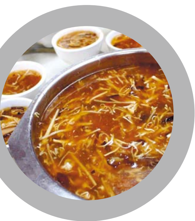
在粵菜中，蛇是上等佳品。

廣州是一座歷史文化名城，不少的廣州小吃都是流傳自明清時期，經過漫長的歷史沉澱，經久不衰，一代代流傳下來。「食在廣州」不是虛言，「識飲識食」的廣州人大都深諳哪條街道的角落有最馨香濃郁的牛雜，也知道哪間店鋪的廣式生滾粥最綿滑，各式各樣、大大小小的美食分布在廣州的大街小巷，在廣州人的心中，他們都有自己的一幅「搵食地圖」，他們從來不會為尋找美食而失去耐性和方向感，那些地道的廣味美食總會讓一個吃貨的幸福感爆棚！