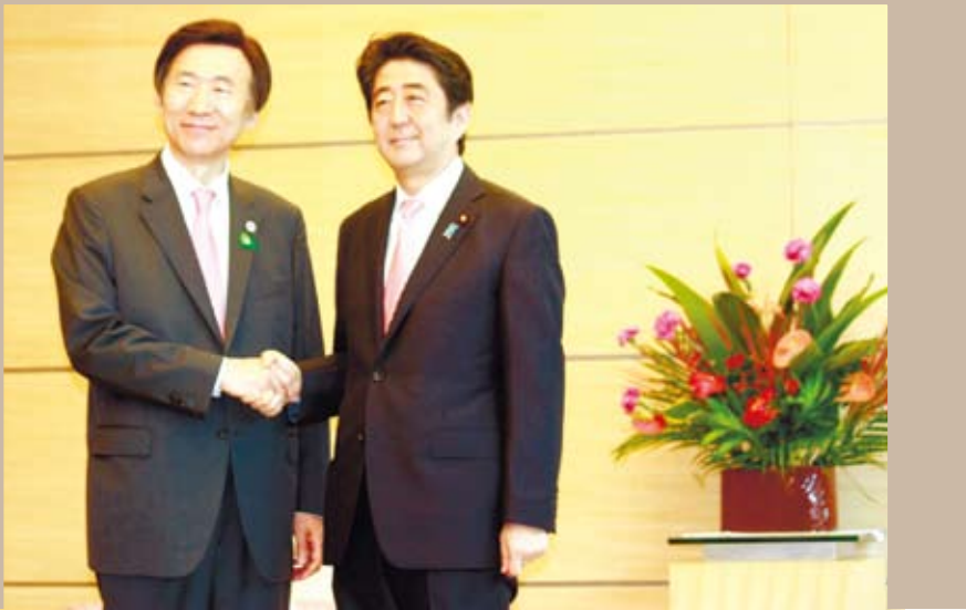
日本首相安倍晉三（右）與韓國外長尹炳世握手。

希臘政府6月29日宣布，該國各銀行從當天起停止對外營業，以避免銀行系統崩潰。外國銀行的借記卡或銀行卡持有人暫時不受這一大決定影響。圖為雅典民眾在關閉的國家銀行外的自動取款機前排隊取錢。