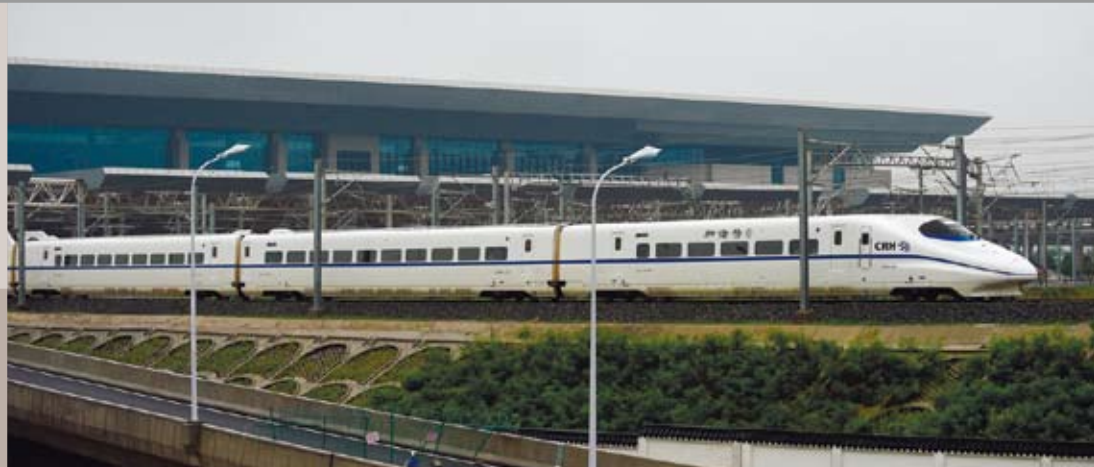
合福高鐵路G2621次列車駛出合肥南站。

合福高鐵路不僅是一條旅遊線路，它南段還連接福建福州，與東南沿海相連通達泉州、廈門等海峽西岸城市群，中間縱貫長江中游城市群環鄱陽湖經濟圈的東北部，北端接入長三角經濟區的安徽合肥，並在合肥鐵路樞紐銜接京滬高鐵路一路北上，直達北京。