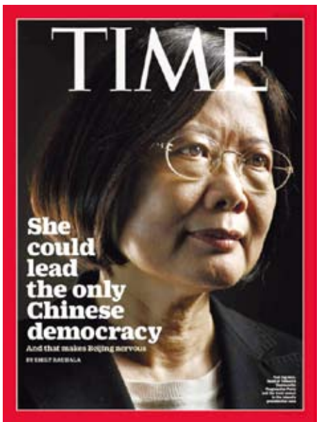
很多媒體一直關心，蔡英文如何面對美國的考試。

在國防事務上，我堅信，台灣要成為在區域安全中的可信 的伙伴，適度投資於有效嚇阻是重要關鍵。面對日益增加的軍事安全威脅，台灣發展不對稱作戰能力，是嚇阻戰