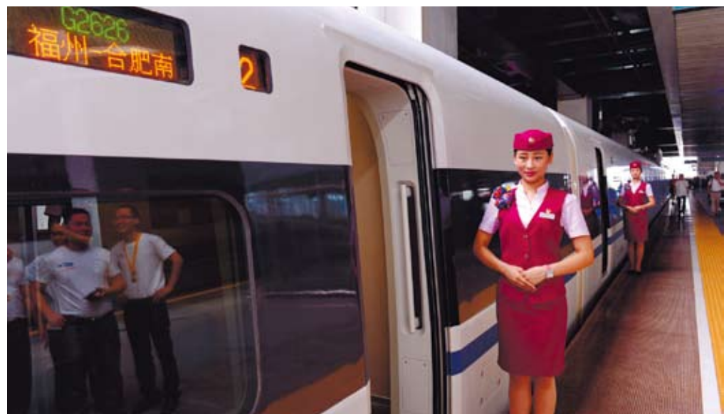
一列福州開往合肥南的G2626次高鐵路列車的乘務員在車門旁迎接旅客。

大陸一些專家表示，合福高鐵路連接中國大陸經濟發展活躍和頗具潛力的諸多地區，運輸需求旺盛、經濟互補性強。時空距離的大大縮短，將促進沿線人流、物流、資金流向21世紀海上絲綢之路的核心區福建匯聚，然後走向東南亞。從而使合福高鐵路成為加「一帶一路」區域合作的「黃金通道」。