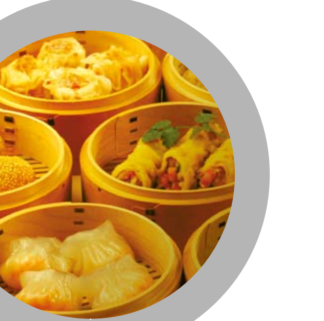
豐富的廣東點心。