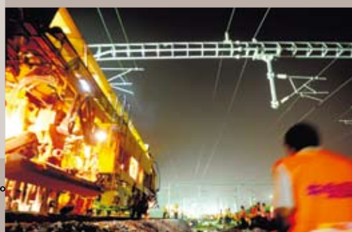
合福高鐵路的工作人員在現場進行施工。