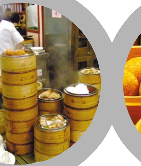
豐富的廣東點心。