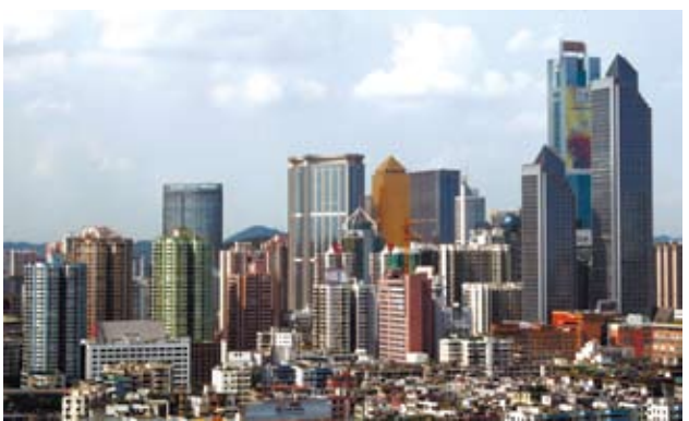
廣東是聞名中外的美食城市。

廣州地處亞熱帶，瀕臨南海，四季常綠，物產富饒，可供食用的動植物種類繁多，蔬果豐茂，四季常鮮，給飲食烹飪提供了廣闊的天地。唐代，廣州飲食用料之博雜已聞名宇內；烹任製作技術也形成多樣化、精細化的特點。明清時珠江三角洲富庶，中心城市廣州更為興旺；講究飲食之風盛行，使廣州飲食更為豐富多彩。近代商貿繁榮，中外交往頻繁，更為廣州飲食市場拓寬了空間。漫長的歲月，使廣州人既繼承了中原飲食文化的傳統，又博採外來烹飪技術精華，根據本地的口味、嗜好、習慣，不斷吸收、積累、改良、創新，從而形成了菜式繁盛、烹調工巧、質優味美的飲食特色，近百年來已成為大陸最具代表性和最有世界影響的飲食文化。到現在，廣州的飲食無論出品的數量、質量，酒樓食肆的數量和規模，抑或是飲食環境、服務質量，在大陸都是首屈一指，在國外也享有盛名。據有關部門統計，廣州的飲食店檔已發展到2萬家以上，餐位超過100萬個，從業人員近150萬人，平均日接待人數近200萬人次，年營業額500億元（人民幣，下同）以上。