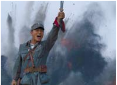
出川抗戰斯人已逝。圖為大陸影集《壯士出川》劇照。（翻攝畫面）

「千秋萬歲名，寂寞身後事。」一塊前清老秀才醜贈他出川男兒傷時拭血、死後裹身的「死」字白布，裁決了失卻民族精神和歷史良知的窩裡門，和所謂「民國範兒」那些顧影自憐的唯美想像。出川抗戰斯人已逝，他們以血肉築成的歷史豐碑，讓後人追加的軍銜與稱號望塵莫及。