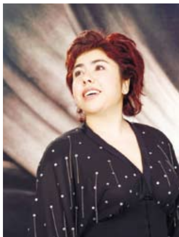
中國維族花腔女高音歌唱家迪里拜爾。