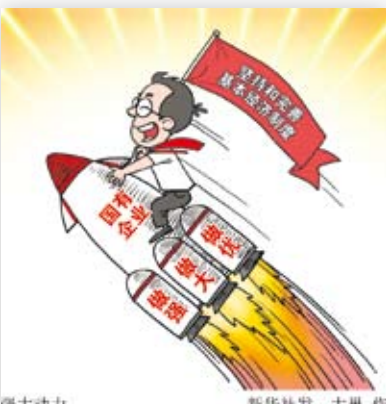
強大大動力 大巢作 國企改革的強大動力。（大巢製圖）

編按 今年9月，中國大陸發布《關於深化國有企業改革的指導意見》，確立了國營企業改革的具體方向。其中最引人注目的是，國營企業改革的重點不是過去台灣所熟悉的民營化或私有化，而是透過制度的設計，讓國營企業成為國有經濟的核心支柱，成為共同富裕的重要力量。大陸媒體新華社甚至發表評論文章指出，國企改革確立了反對私有化方向。為了讓本報讀者對中國大陸的國營企業改革方向有更直觀的理解，本期以「中國大陸國企改革的反民營化方向」專題，提供第一手的資訊。