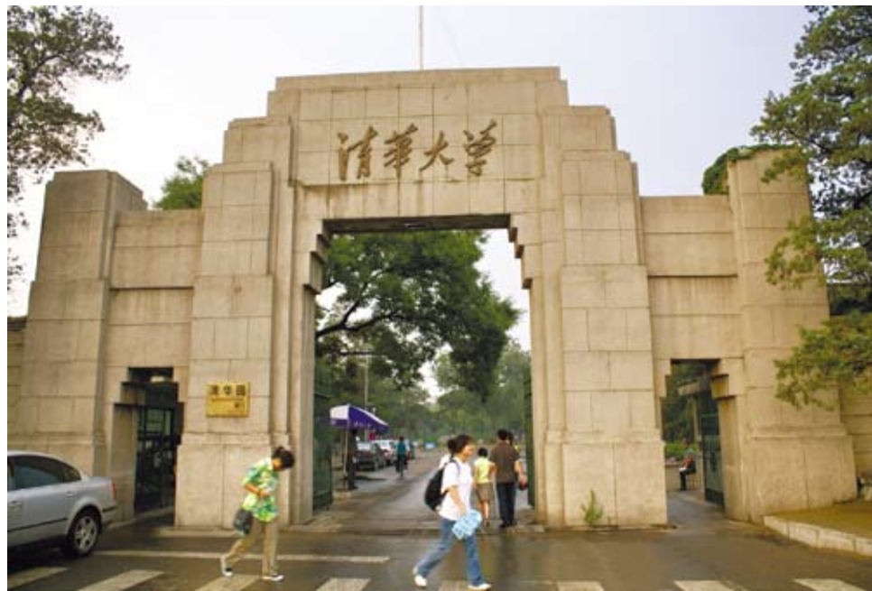
北京清華大學校園一景。（網路圖片）

彼此的想像，得到了驗證，實質的交流讓我們更加了解雙方相似以及相異的地方。在熟識彼此後，我們開始了前往華北農村的籌備活動，在籌備的過程中，我也觀察到了台灣學生跟中國學生的特質，台灣學生充滿創意而中國學生則是執行力很高且一些瑣碎的事情都能有條不紊的解決。或許因為身處的社會環境的不同，結構的不同造就出來的特質也就不同吧！在籌備的過程中，因為我喜愛拍照跟念政治學與社會學的專業，因此成為了團隊的攝影師以及加入負責政治活動調查研究的小組。在資料蒐集完畢後，我們驅車前往了四百公里外的曲長城村，開始進行調查研究的活動。早