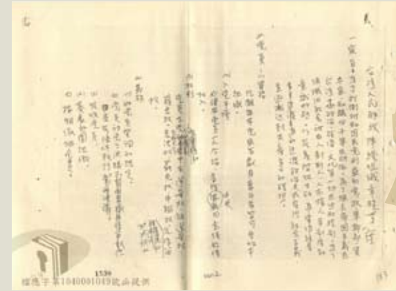
台灣人民解放陣線組織章程草案。

台灣地區「白色恐怖」歷史重建與研究方興未艾，但除了控訴「國家暴力」還能如何？在線性史觀下，彷彿人類社會無論政治與經濟都會有「第X波」的演化，但「台灣人民解放陣線」案卻讓我們尷尬。高喊「轉型正義」與「人權」的台灣，政黨輪替再輪替，都『無法』平反本案。為什麼？而我們又還能怎麼看待「台灣人民解放陣線」的發生？案發時，成員中年紀最大的不過二十七、八，年輕的甫升大四，他們怎樣走上這條路？當時怎麼想？看似突發的案件，該怎麼放在歷史長河中理解？三十八年過去了，這個「左派青年」案，又能對今天與明日的青年運動有何啟發嗎？能對歷史認知有啟示嗎？