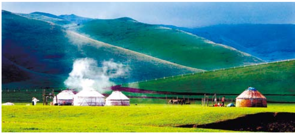
在溫馨的蒙古包酒席上，我們一起大口吃羊肉。（網路圖片）

十天的時間裡，隨著時間的推進，本以為要「求同存異」的我們卻發現我們的共同點越來越多。在內蒙古大草原上的蒙古包裡，我們徹夜長談；在溫馨的蒙古包酒席上，我們一起大口吃羊肉；在居庸關長城腳下，我們盡情揮汗如雨，登頂長城，同做好漢。猶然記得，從居庸關長城成功登頂時，我們一起哼唱著歌，引得路人紛紛駐足注意。那真是一直以來未曾有過的放鬆與瀟灑，是只能與真正的知己在一起