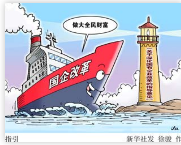
指引 《關於深化國有企業改革的指導意見》對大陸國企改革的指引作用。