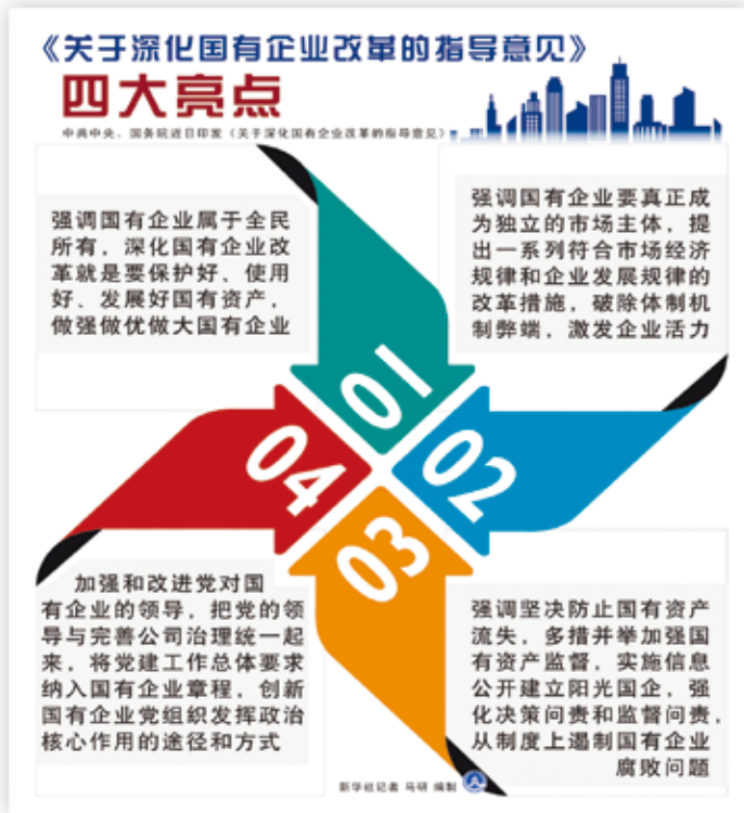
《關於深化國有企業改革的指導意見》四大亮點。（新華社 馬研編製）

《關於深化國有企業改革的指導意見》是大陸新時期指導和推進國有企業改革的綱領性文件。可從五大看點，進一步瞭解大陸國企改革。