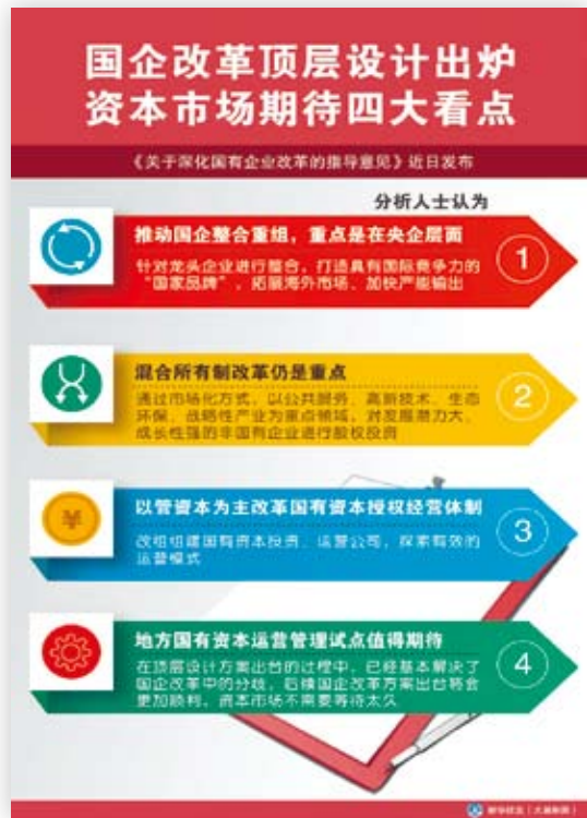
大陸國企改革頂層設計出爐，資本市場期待四大看點。（大巢製圖）