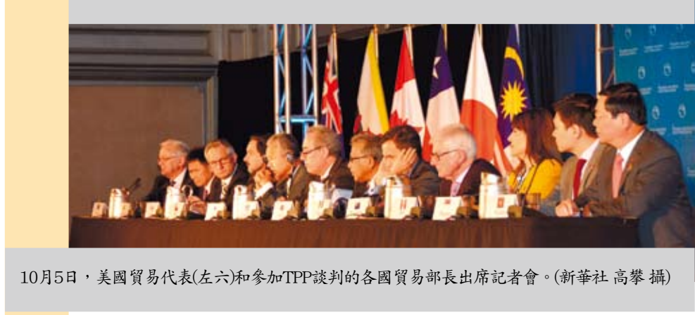
10月5日，美國貿易代表(左六)和參加TPP談判的各國貿易部長出席記者會。

改革試驗的不止有上海。今年以來，福建、天津、廣東自貿區相繼掛牌，推出了一系列新的開放措施，形成多點開花的自貿區試驗模式。它們在簡政放權、投資貿易便利化和金融改革等領域取得的經驗，能向全大陸推廣。