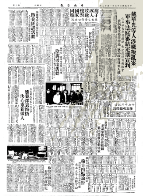
中央日報頭版判決報導。

坦言之，歷史之所以「斷裂」，常常是由歷史「書寫」釀的禍。左翼運動之中的恩恩怨怨、糾糾葛葛，自然也助燃了歷史