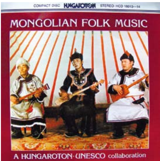
蒙古民謠 / 匈牙利錄音製造