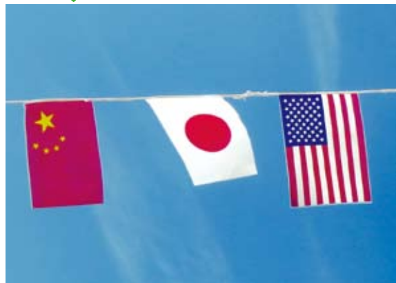
中日韓三國在政治上的摩擦與美國的介入有關。（網路圖片）

在自由貿易談判浪潮席卷全球的今天，中日韓自貿談判的停擺顯得尤為「奇怪」。中日韓三國是當今世界經濟最活躍的地區之一，三國經濟總量、對外貿易總額、對外投