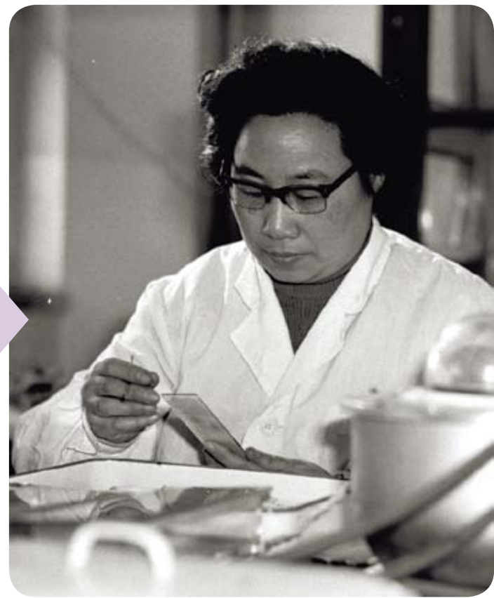
上個月月初，大陸的一位「五無」科學家屠呦呦獲得諾貝爾醫學獎，引起轟動。

並且，因為國民黨不能提供良好的身教，使中華文化變成考試用的死材料，對人不具說服力和吸引力。該黨的無條件反共更使台灣人民與中國大陸長期隔絕、敵對，以致人心疏離。 二、日本的殖民統治與皇民化。日本在1895至1945年間殖民臺灣，將臺灣作為侵略中國的基地，推行誣蔑、醜化中國的宣傳與教育。台灣老一代的本省人受日本教育影響，不論自覺與否，往往習於輕視中國。1988年以來，在獨台與台獨的輪替統治下，反華與去中國化幾乎成為臺灣社會的主流思潮，並經由教改深深植入年輕人的心中。臺灣為了建立對立於中國的國族認同，還主動繼承、繼續推動日本殖民時期的皇民化運動，使台灣人更難瞭解、認同自己祖先的文化。 在這方面的代表人物，就是曾經當過12年中國國民黨主席和中華民國總統的李登輝。他不僅反中仇中，還公開宣揚其日本認同。在他寫的《「武士道」解題：做人的根本》一書中，他說：「對於總統任內十二年的奮鬥，我自認確實能一貫始終地朝理想奮進，而我內心最大的支柱，當然就是早年『日本教育』打下的『大和魂』，也就是『武士道』精神。」他並自承他在1996年首次大選總統時提出的「心靈改革」政見，就是「試圖在台灣讓武士道精神以獨特形式發揮，…希望藉此奠定『新台灣人』精神的穩固基石。」並且，在他執政期間，「堪稱是我全力灌注、最終努力目標的，便是『教育』。」當年李登輝發動的臺灣獨改，被陳水扁發揚光大，又被馬英九延續至今。而馬英九本人就曾在李登輝的「循循善誘」之下，公開宣布要做「新臺灣人」，並在1999年單獨捐助成立「新臺灣人基金會」。這些事證，都顯示了日本皇民化與臺灣、獨臺之間盤根錯節的密切關係。這是如今阻礙臺灣人重新認識中國文化、重建中國認同的最直接障礙所在。 三、中共建政以後所犯的錯誤。中共在1949年建政以來，雖然整體方向是朝向民族復興，但是從1957年反右直到1978年以前，犯了不少過左的錯誤。改革開放以後，腐敗現象亦曾幾近失控。這些事件與現象，經過國民黨反共與臺灣反中的擴大，更妨礙了臺灣民眾正面認識中國大陸。 四、「五四」以來的反傳統思潮。五四運動時，一大群西化派人士為了救國，在輸入西方文化的同時，更大張旗鼓地醜化、反對自己的傳統文化。此一思潮一直發展到中共文革達於頂峰，1978年以後才