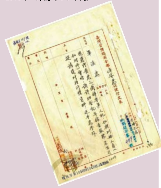
「摘錄專案」監聽需求單。