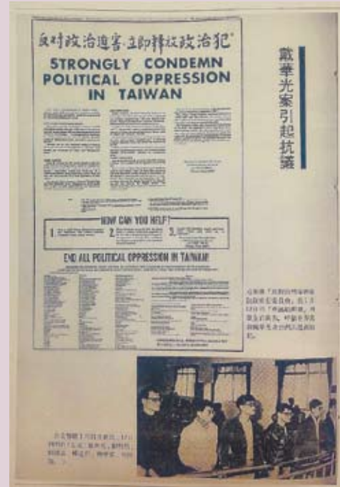
1978年二月號《七十年代》。