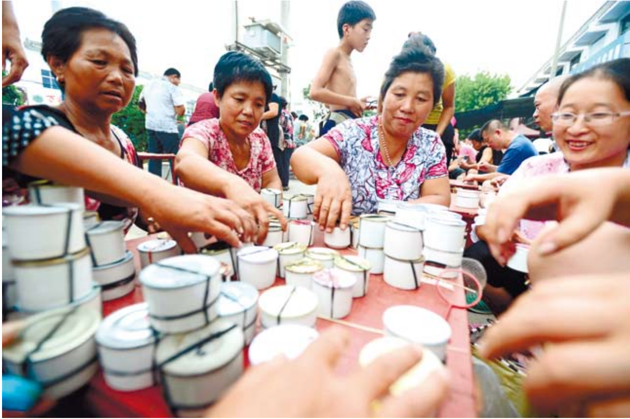
山東寧陽縣酒店鎮蟋蟀市場，村民把自己捕捉的蟋蟀擺在桌上等待交易。全鎮因蟋蟀交易而帶動第三產業年產值達10億元以上。

編按 隨著近日中國大陸的「十三五」（第十三個五年計畫）計畫的曝光，對過去近五年的「十二五」（第十二個五年計畫）的執行與落實成果也成為媒體關注的焦點。更重要的是，「十三五」所預告要實現的「全面邁入小康社會」的構想，其成敗雖然直接關係到「十三五」本身的推動，但是「十二五」打下的基礎也不能忽視。當代中國將陸續推出一系列對「十二五」計畫成果的觀察，希望讓讀者對當前中國大陸的發展有一個知識輪廓。