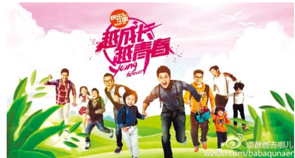
從生活中來看，我們接觸到大陸最密切的就是電視節目。

兩岸之間的交流應該要愈來愈頻繁，如此才能吸取彼此之間的優點，借助台灣的人才、創意、軟實力等等，加之以大陸的資金、市場、技術，彼此一定能夠互相成長，台灣也才不會一直停留在原地而毫無進步。我們應該要擔心的是，中國停止成長，而非中國一直成長我們該怎麼辦？