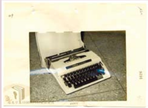
檔案材料中打字機照片。