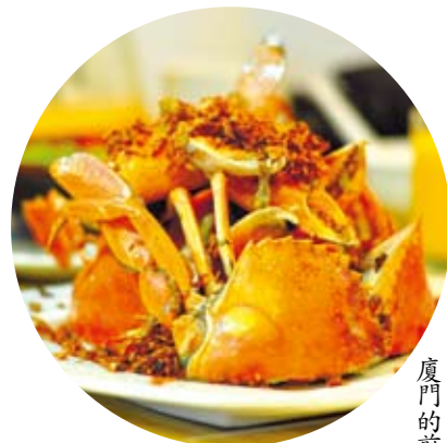
廈門的煎蟹，蟹黃、膏黃、蟹肉皆恰好處。