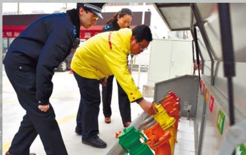
北京嚴格執法「迎戰」霧霾。圖為12月8日,北京大興區環保局機動車排放管理站的工作人員在大興區一加油站檢查油氣回收設施。

河北省環境應急與重污染天氣預警中心工程師張良說,在當前排放量仍然較大的情況下,不利氣象因素對大氣品質影響很大。只有逐步降低排放量,抗擊氣象影響的能力才會越強。並不是停幾個企業,空氣品質就會好,根本在於調整產業和能源結構。