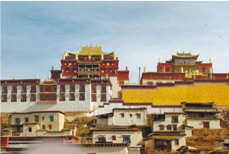
肅穆的小布達拉宮淨化心靈

然而，雲南的廣袤、多姿，不只有麗江古鎮和玉龍雪山才能詮釋，更多新奇秘境值得你為之流連忘返。更何況，雲南除了麗江、昆明、香格里拉，還有更多吸睛景點等待你的造訪。