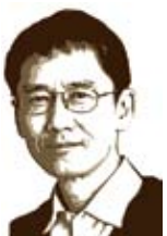
與台灣青年朋友的通信 行 陸苑 中簡