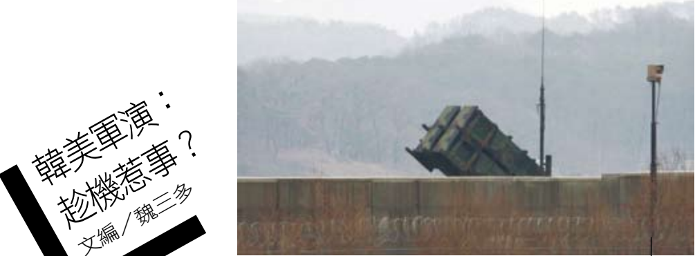
美國在南韓增加部署「愛國者」導彈系統。