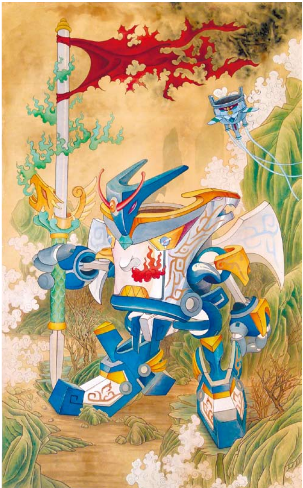
徐偉軒作品：《御宅天王-奇崖爭胜》。

。」小宅進一步介紹說，台灣的工藝美術市場上，比較「厲害」的工藝品一般都有自己的品牌。台灣工藝品市場做品牌營銷會比大陸同行更在行一些，即便是剛開始籍籍無名的工作室，只要做成功了，也最終要借助「品牌力」來發展。感覺在這方面，大陸並不是很重視，因此要引進過來試一試水。