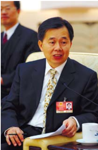
全國人大代表陳蔚文。