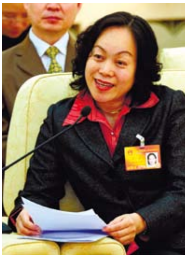
全國人大代表陳軍（高山族）。