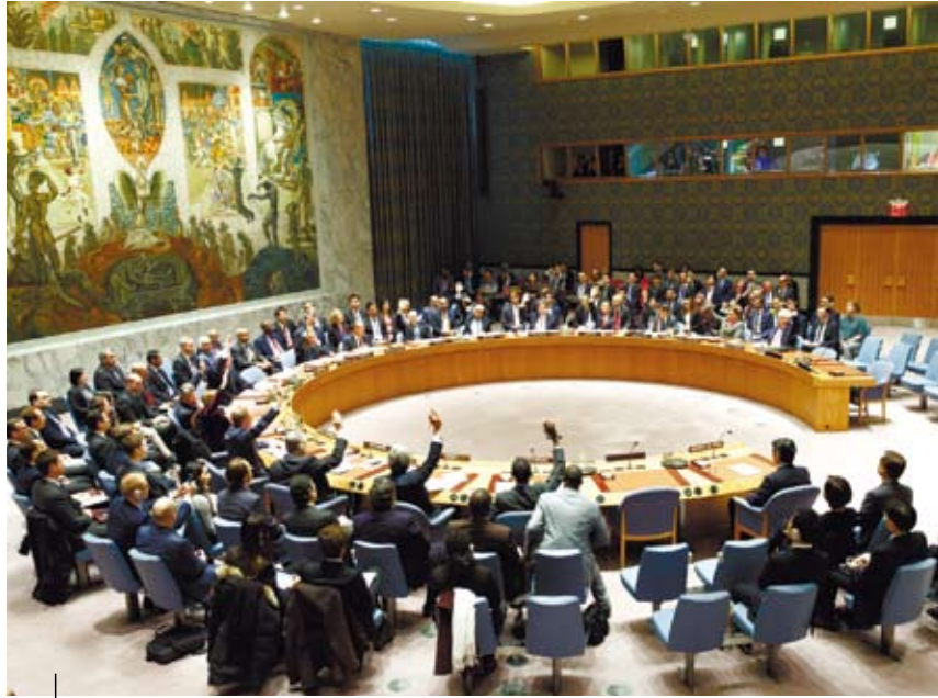
聯合國安理會通過決議遏制北韓的核、導開發計畫。(新華社 李木子攝)

聯合國安理會3月初通過決議，決定實施一系列制裁措施遏制北韓的核、導開發計畫，並呼籲恢復六方會談。