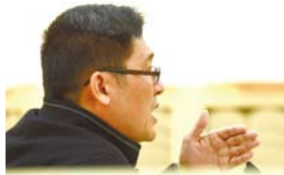
全國人大代表符之冠。

每年兩會是人大代表提案的重要時刻，台籍人大代表也不例外，在開會前也進行一連串的調研「備課」，他們的關注點涉及兩岸經濟、社會、文化往來的諸多領域。例如，怎樣通過深化合作，提振經濟發展動能，推進企業轉型升級，進而助益改善民生；又如，怎樣採取積極有效舉措，促進兩岸青年交流合作，鼓勵、支持台灣年輕一代分享大陸發展機遇；以及怎樣創新形式、拓展內容，深化兩岸文化教育交流等等。 陳蔚文人大代表去年參加了台灣農民創業團的調研。他說，自2006年以來，大陸共設立了29個國家級台農創業團總體進展較好，但是各地發展不平衡，他由此提出建議：給予台創園土地用地指標政策傾斜，靈活寬鬆；設立台創園專項基金，降低融資門檻。 另一位台籍人大代表陳軍議案，台灣文創產業起步早、品質好，但缺乏市場，與大陸有互補性，要積極搭建文創新平