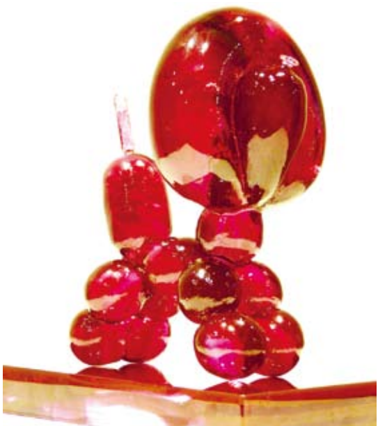
徐偉軒作品：《氣球狗》。