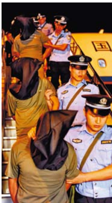
2011年兩岸警方曾聯手破獲跨境電信詐騙案，一舉抓獲598名嫌犯（其中大陸居民186名、臺灣居民410名、柬埔寨居民1名、越南居民1名），圖為電信詐騙嫌犯被押回廈門。