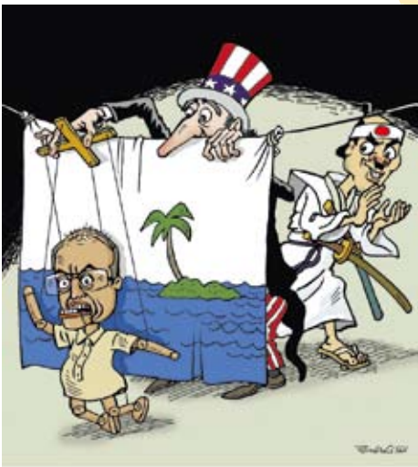
圖 新華社發 范建平作