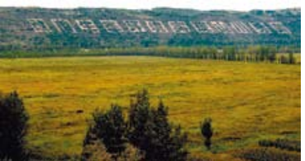
治沙前(上圖)與治沙後(下圖)兩種不同的景色。