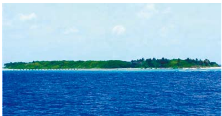
被南海仲裁案貶為礁岩的太平島。

沒有回應。菲律賓莫要做「不知其可」的國家，而是成為讓別國可以信任和尊重的國家。我們也希望，仲裁庭和有關域外國家，除了維護國際法的尊嚴，所言所做不要偏離基本倫理和常識。