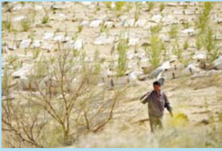
中國大陸的治沙林場，利用「治沙板」栽種樹木。