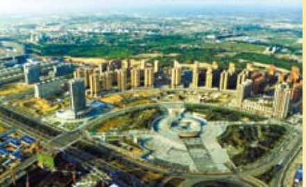
榆林市西沙地區過去全是沙漠(上圖)，經過治理成為人居城市(下圖)。(新華社 劉瀟攝)。