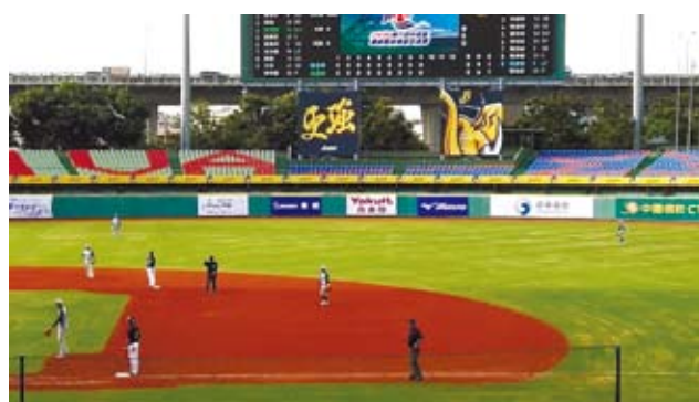
天津對台北市延長賽的第10局突破僵局制，一開始需免費奉送兩個跑壘員上壘。最後以2：4輸球。

而在預賽中和台北市交手的天津隊，前一場雖在台體大棒球場以0比7敗給合庫。但對台北市的這場比賽，展現強盛的贏球企圖。賽前一陣短暫的西北雨後，隨即雨過天晴。兩隊皆派出左投先發，均有效壓制雙方打擊，野手群更是美技連發，沒收了好幾支可能的安打球，雙方9局打完依舊是0比0平手。隨即進行自北京奧運以來就有的突破僵局制。