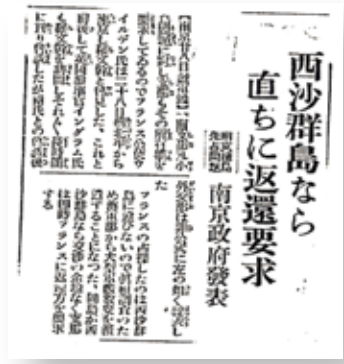
昭和八年（1933）日本媒體刊載南京政府抗議法國強佔南海諸島的聲明。

為「島嶼」的太平島主觀地認為「岩礁」，就是刻意以「法律」，來破壞中國南海的主權。這不僅違反了「海洋法」的一般普遍的原則，更讓國際法庭淪為某些霸權國家的鷹犬。