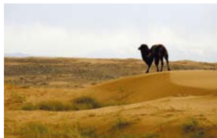
甘肅武威古浪縣封沙育林80萬畝，生態環境惡化趨勢得到初步遏制。