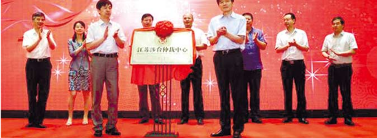
江蘇成立首個涉台仲裁中心 助台商解決民商事糾紛。圖為江蘇涉台仲裁中心揭牌儀式現場。