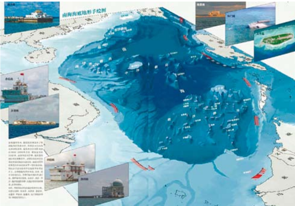
由大陸中國科學院繪製的南海海底地形圖。

2006年，中國大陸依據《公約》第298條作出排除性聲明，將涉及海域劃界、歷史性海灣或所有權等方面的爭端排除在以《公約》強制