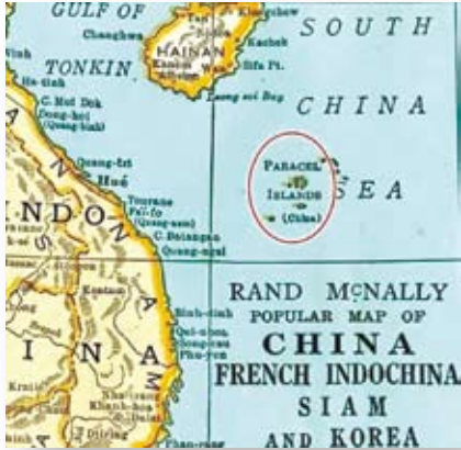
加拿大發現美國老地圖清楚表明：南海屬於中國領土！

從上述分析可以看出，由美國人支持菲律賓出面日本右翼分子所主持的國際法庭，根本無視南海諸島的歷史及現實地理條件，將本