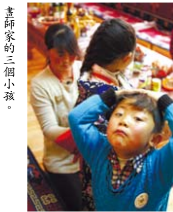
畫師家的三個小孩。

務」天天去參加廟會，不去還會被罰錢。我倆又帶著畫師家的三個小孩一起去看戲，順便充當一回藏人爸媽。