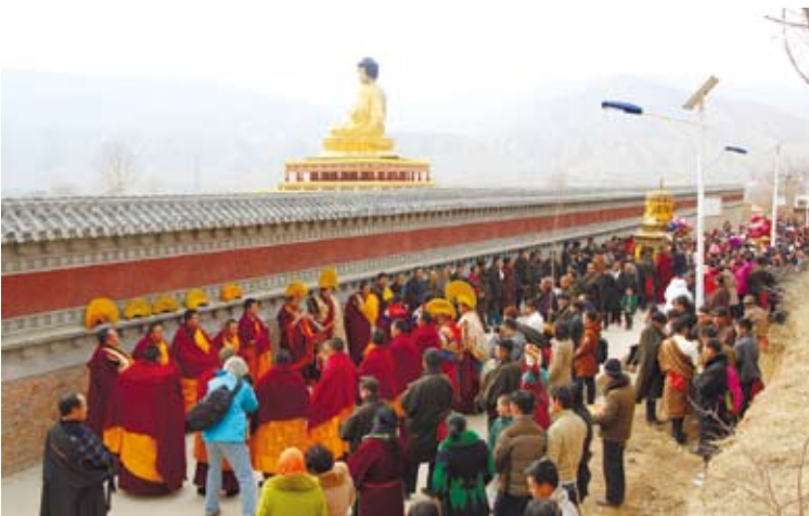
吾屯下寺熱鬧的人群。

到了之後，發現吾屯下寺熱鬧滾滾，原來是喇嘛們在排練隔天要上演的廟會。當我們拿出相機，想拍點東西時，只見好的位置被一群大爺大媽佔據。他們看來熟門熟路，還指點著J「哎呀那邊順光，拍起來不漂亮！」看著他們手上拿的「大砲」，再瞅瞅我跟J的基本款單眼，我倆頓時有點羞愧。其中一個阿姨東喀擦、西喀擦完之後，打個懶腰，「哎呀～拍得好爽呀！」