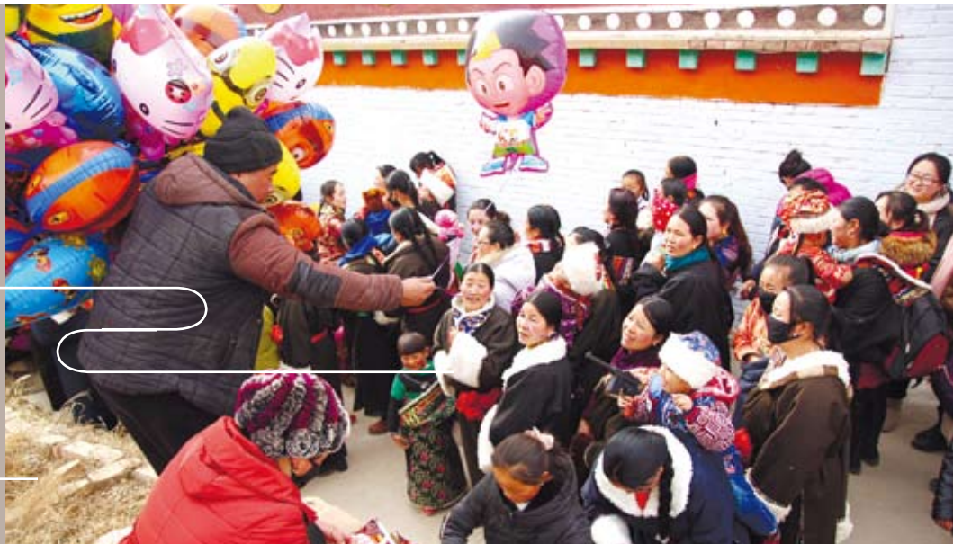
寺門外賣著各式零食、玩意兒的攤販。