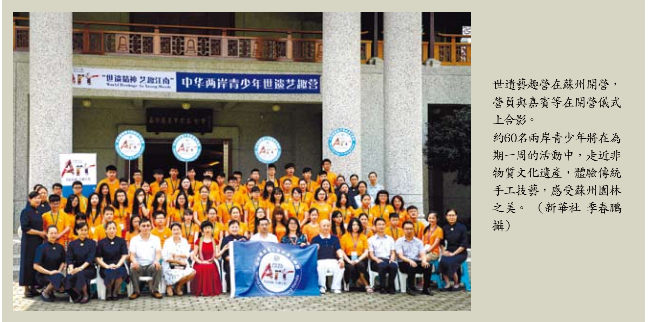
世遺藝趣營在蘇州開營，營員與嘉賓等在開營儀式上合影。

▲ 8/26 國台辦主任張志軍在北京會見了台灣勞動黨主席吳榮元一行。張志軍希望勞動黨繼續旗幟鮮明堅持正確立場，維護和推進兩岸關係和平發展。吳榮元表示，勞動黨將繼續秉持一個中國原則，堅決反對台獨，與台灣社會各界、各階層攜手為推動兩岸關係和平發展作出新的貢獻。