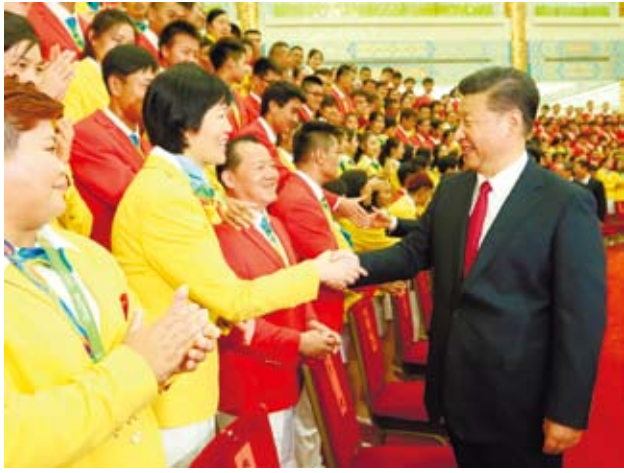
習近平在人民大會堂會見大陸里約奧運代表團全體人員。圖為女排主教練郎平（左）與習近平握手。