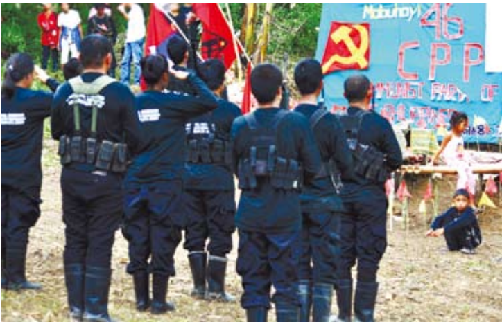
菲律賓新任總統杜特立提出與菲國共產黨「新人民軍」和解。（網路圖片）