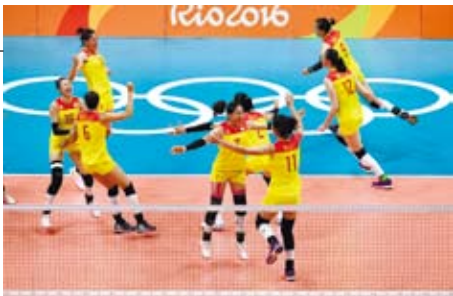
2016年里約奧運會女子排球決賽中，中國大陸以3比1戰勝塞爾維亞，奪得冠軍。