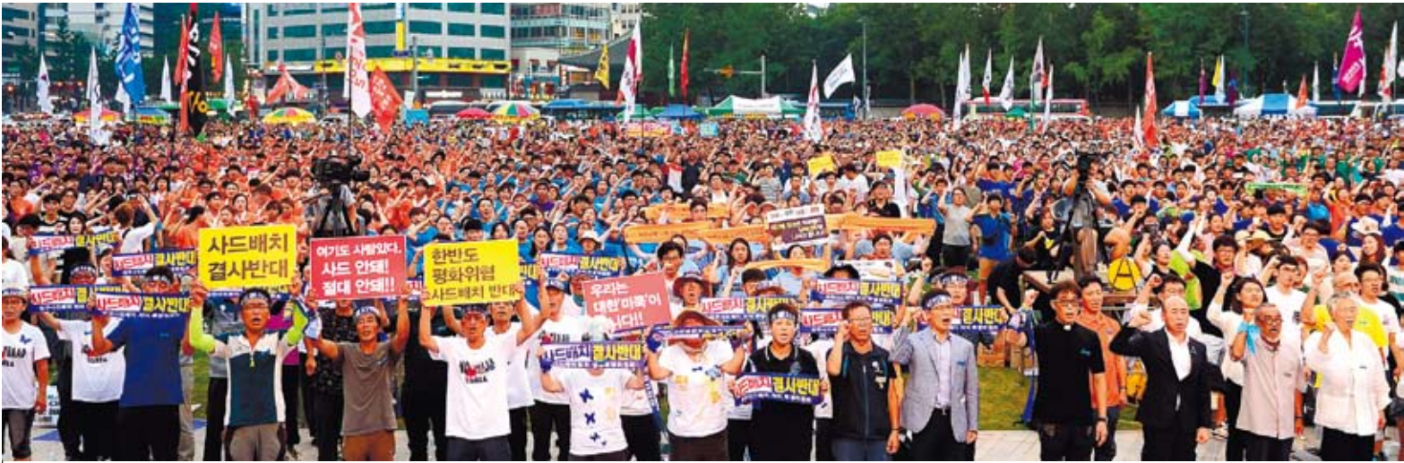
南韓民眾再度舉行大規模集會反對部署「薩德」系統。

在抗議集會上，來自星州的抗議民眾代表在台上與台下近5000民眾同唱反對薩德的歌曲。集會主辦方還與正在星州郡廳前舉行第33次反對部署薩德燭光集會的民眾進行視訊連線，星州代表打出「在我們的土地上不需要薩德」的橫幅，台下民眾高呼反對薩德的口號，現場反對薩德的氣氛達到高潮。