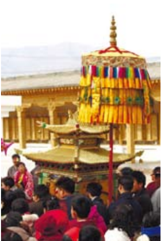
活佛乘坐的金光閃閃的車子。