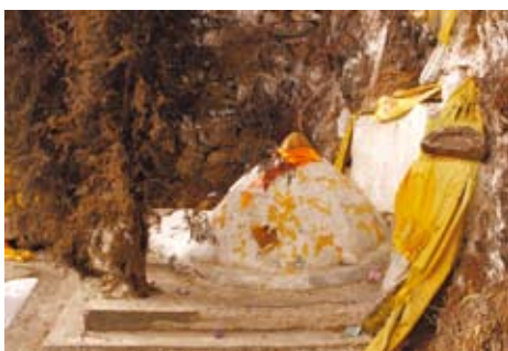
三世章嘉的衣冠塚。

我們爬上某個小山丘，看到了三世章嘉被風馬旗佈滿的衣冠塚，如今這兒也是人煙罕至。知客喇嘛說，「諾，就這個了。」從這個地方望出去，可以眺望被白雪覆蓋的佑寧寺，底下的寺廟頓時變得好好小小。章嘉活佛成為國師的歷史始於乾隆皇帝，他與三世章嘉是相當要好的朋友。一旁也有張小小的告示牌，簡易地述說章嘉活佛的歷史，其中也包含七世章嘉。