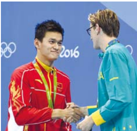
大陸泳將孫楊獲里約奧運男子400米自由泳銀牌。圖為孫楊(左)在頒獎儀式上和冠軍澳洲選手霍頓握手致意。