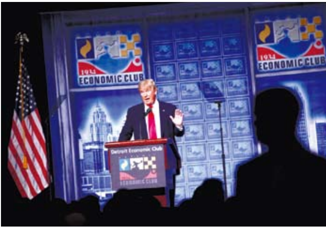
川普競選團隊負責人因「秘密」收受烏克蘭地區黨錢財而被迫辭職，圖為川普在美國底特律發表演講。