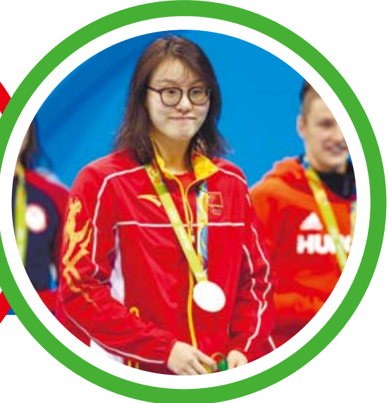
大陸冰將傅園慧以「洪荒之力」贏得里約奧運女子100米仰泳銅牌。圖為傅園慧參加頒獎儀式。