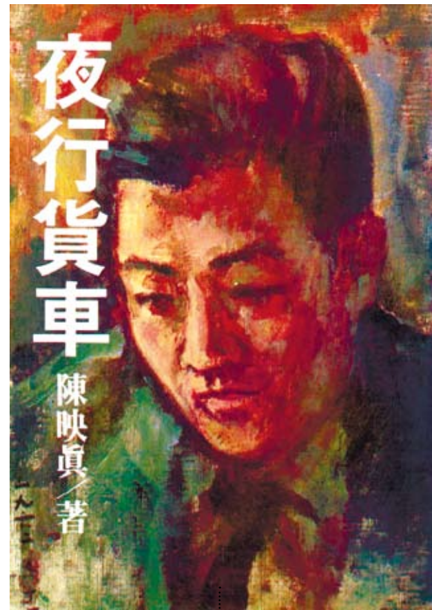
我第一次讀到陳映真的書是在母親的書架上，那是1979年由遠景出版的《夜行貨車》。（資料圖片）

我第一次讀到陳映真的書是在母親的書架上，那是1979年由遠景出版的《夜行貨車》，母親購於1983年1月，我出生前幾個月。我記得書的側頁印著黑黃的拇指印，而那列長而黑而強大的、開往南方的列車，在故事中曾三度出現，就在那幾行字的左方，深深地壓著黑藍色的原子筆所畫下的線。