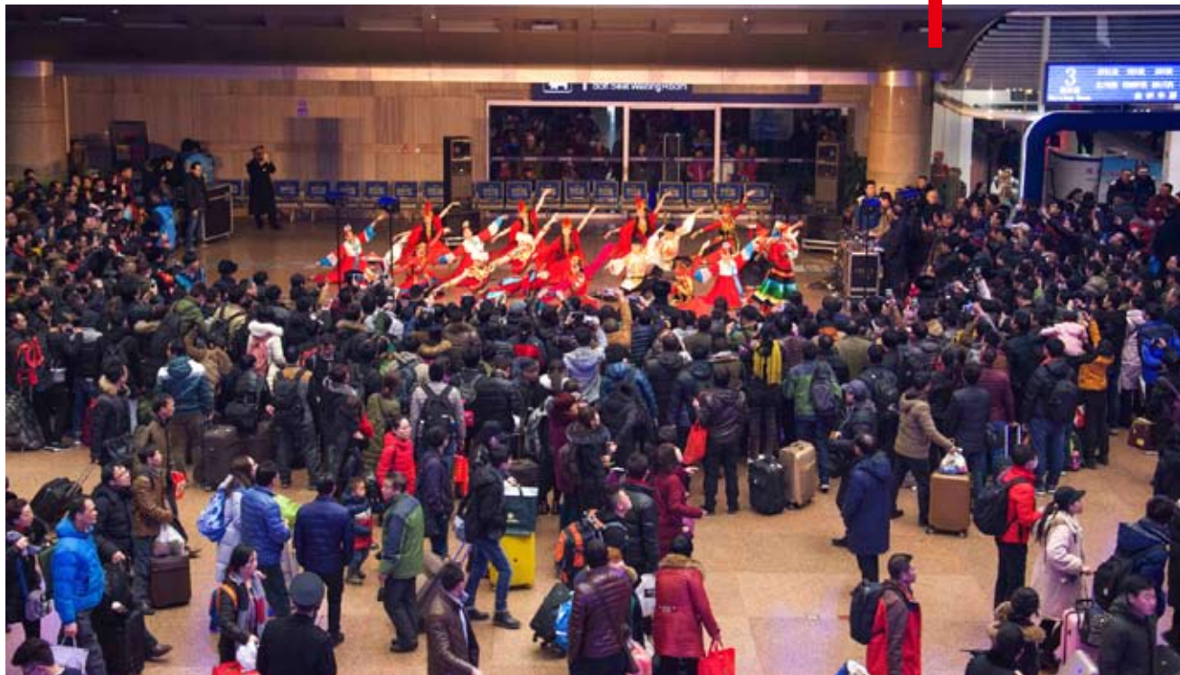
大陸鐵路文工團的演員在北京西站為春運返鄉的乘客表演。

白皮書提出，構建橫貫東西、縱貫南北、內暢外通的綜合運輸大通道。到2020年，高速鐵路營業里程達到3萬公里，覆蓋80%以上的大城市。新改建高速公路通車里程約3萬公里。基本建成京津冀、長三角、珠三角、長江中游、中原、成渝、山東半島城市群城際鐵路網。