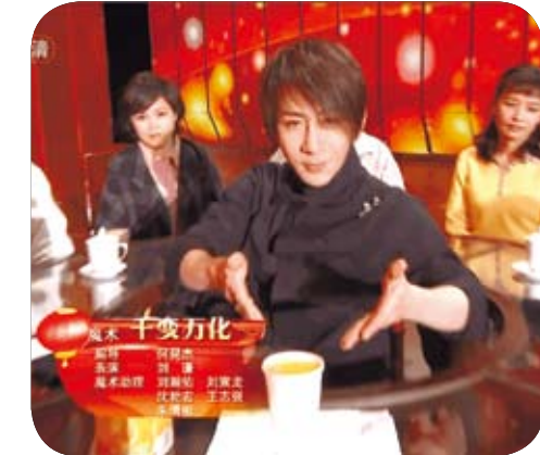
2010年劉謙魔術第一次登上央視春晚。