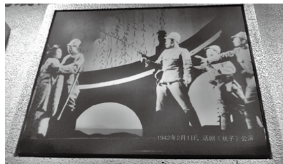
被譽為「中國話劇的聖殿」的抗建堂。