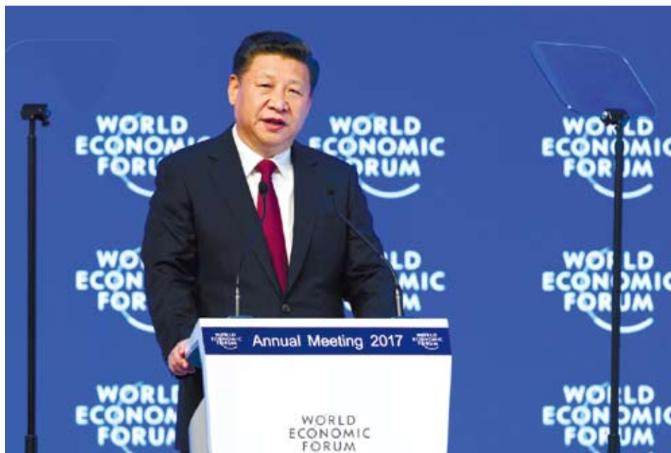
習近平在達沃斯發表主題演講，強調合作應對全球化的挑戰。

是為了服務其民眾。美國民眾希望孩子得到優質教育，安定環境和良好工作。此乃正直人民所發出的公正合理之訴求，但是對於大多數人來說，現實卻遠不相同。在內城中生活的母子們深陷貧窮，工廠锈跡斑斑好似墓碑，學校充斥權錢交易卻讓年輕學子得不到應有的知識。犯罪、黑幫還有毒品已經奪去了太多生命，盜走太多未能發覺的天賦。這場對美國人民的屠殺將在此時此地停止！我們是一國之同胞，他們的苦難就是我們的苦難，他們的夢想就是我們的夢想，他們的成功將是我們的成功。我們心心相連，共享家園，承載同樣光榮的命運。我今日所做之宣誓將忠於所有美國人民。幾十年來，我們以犧牲美國工業為代價，發展外國工業；以消耗美國軍隊為代表，援助外國軍隊；以破壞美國邊境為代價，保護著外國邊境。我們在海外花傾盡所有，而我們的基礎設施卻年久失修，陳腐破敗；我們助他國致富，而我國的財富，力量和信心已經漸漸消逝在地平線上。工廠一個個關停，搬往他處，將成千上萬的美國工人丟在腦後；財富從我們的中產階級的手中流逝，卻被分配到了世界各地。但是那些都是過去，現在我們直面未來。從今天起，只有美國優先，美國優先！每一個貿易、稅收、移民和外交的決定都將以美國勞工和美國家庭的福祉為第一考慮。我們必須保護我們的邊界免受他國蹂躪，他們生產我們的商品，偷走我們的公司，破壞我們的工作機會。