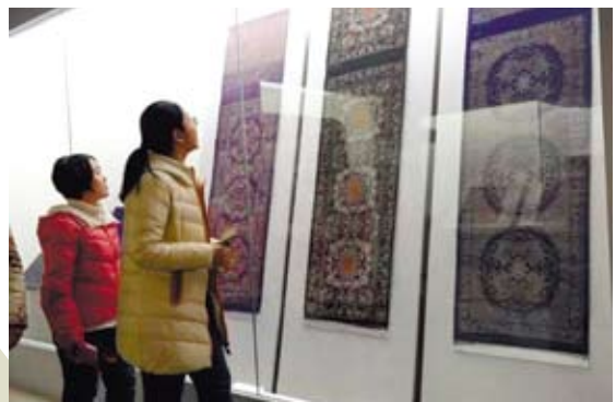
1937年抗戰爆發，這批原屬當時河南博物館的織錦輾轉多地，終於遷移到台灣，最後由台北歷史博物館收藏。