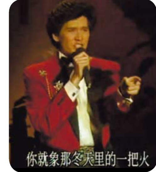
1987年費翔登上央視春晚獻唱「冬天裡的一把火」。