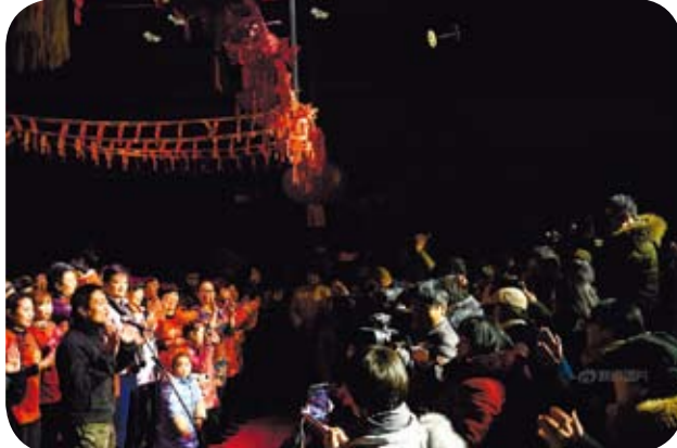
2017年，第六屆《打工春晚》又回到沒有任何取暖設備的「新工人劇場」裡舉行。

數據顯示，流動人口有2.47億。作為一個被官方話語稱為「農民工」的群體，他們像跨境移民一樣，經歷了「文化震動」和其文化被城市主流文化邊緣化的過程，他們渴求精神文化，但不是自上而下的「關懷文化」或「送戲下鄉」，而是來自工人生活、思考和夢想的文化。在文化上，他們不是被給予者，而是創作者。在這個意義上可以說，《打工春晚》產生不是偶然的。自從中國大陸改革開放出現流動人口之後，就有了打工文化。最早在南方工業區出現了打工詩歌和打工文學等，現在也有工人民謠、民眾戲劇等形式。勞者歌其事，其訴求、心聲、夢想需要說出來，需要交流和思考，這就有了打工文化。《打工春晚》正是流動工人文化的匯集。