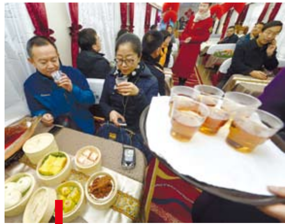
春運期間，旅客在銀川發往杭州的列車上用餐。