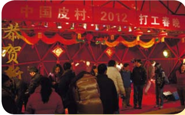
2012年，第一屆《打工春晚》舉辦現場。