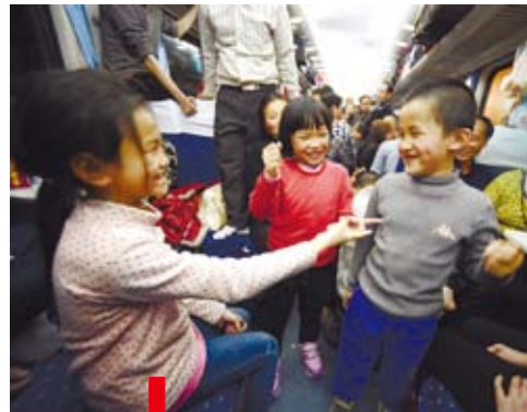
春運期間，外來務工人員專列內，小乘客在玩遊戲。