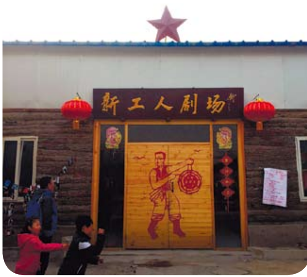
「新工人劇場」是《打工春晚》的出發地。