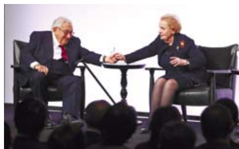
美國兩位前國務卿認為中美應保持「密切關係」。圖為美國前國務卿季辛吉（左）和萊斯在名為「領袖對話：國務卿論壇」的活動上互動。

當然，我們也要承認，經濟全球化是一把「雙刃劍」。當世界經濟處於下行期的時候，全球經濟「蛋糕」不容易做大，甚至變小了，增長和分配、資本和勞動、效率和公平的矛盾就會更加突出，發達國家和發展中國家都會感受到壓力和衝擊。反全球化的呼聲，反映了經濟全球化進程的不足，值得我們重視和深思。當前，最迫切的任務是引領世界經濟走出困境。世界經濟長期低迷，貧富差距、南北差距問題更加突出。究其根源，是經濟領域三大突出矛盾沒有得到有效解決。一是全球增長動能不足，難以支撐世界經濟持續穩定增長；二是全球經濟治理滯後，難以適應世界經濟新變化；三是全球發展失衡，難以滿足人們對美好生活的期待。施瓦布先生在《第四次工業革命》一書中寫道，第四次工業革命將產生極其廣泛而深遠的影響，包括會加劇不平等，特別是有可能擴大資本回報和勞動力回報的差距。全球最富有的1%人口擁有的財富量超過其餘99%人口財富的總和，收入分配不平等、發展空間不平衡令人擔憂。全球仍然有7億多人口生活在極端貧困之中。對很多家庭而言，擁有溫暖住房、充足食物、穩定工作還是一種奢望。「大道之行也，天下為公。」發展的目的是造福人民。要讓發展更加平衡，讓發展機會更加均等、發展成果人人共享，就要完善發展理念和模式，提升發展公平性、有效性、協同性。經過38年改革開放，中國已經成為世界第二大經濟體。道路決定命運。中國的發展，關鍵