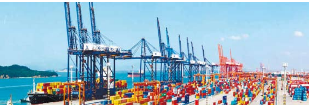
福建自貿區還率先採信台灣食品檢驗檢測機構出具的認證結果，是目前最便利的台灣產品通關模式。