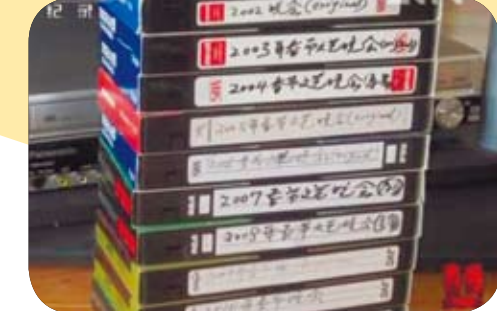
大陸央視春晚歷年的製播錄影帶。