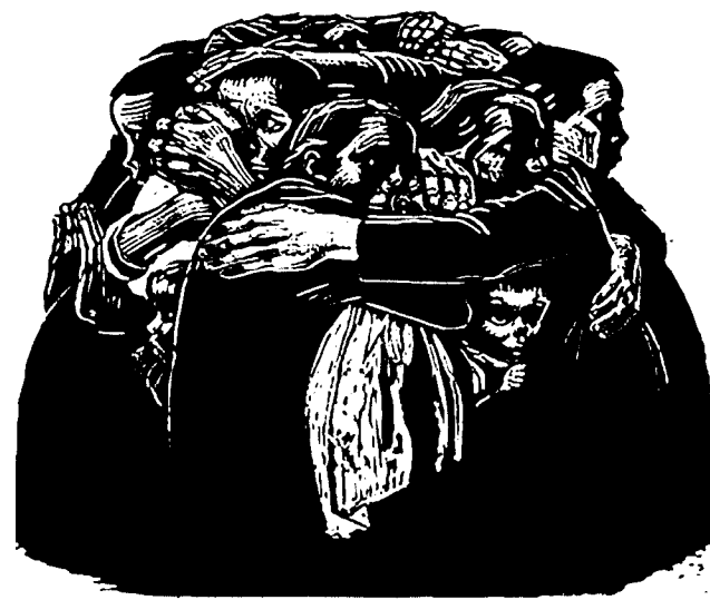
魯迅的新興木刻運動，影響了兩岸許多的知識份子。圖為柯勒惠支版畫《母親們》。

可以說，閱讀陳映真的過程，是與閱讀馬克思主義相關理論一起展開的，而我這樣的知識慾望，不能說是個人傾向，而是時代的緣故。八零年代至今台灣實行經濟自由化政策，勞動彈性化、高失業率、長工時、低工資，在1970年代形成的中產階級與其生活形態其實正在崩解。人心普遍不滿的狀態下，當前的台灣社會看似公民運動蓬勃，卻未能真正提出一個跳脫唯個人權益論與私有財產、質疑資本主義代議民主體制的社會藍圖，而所謂的政黨輪替看似完備了台灣的政治民主化程序，但國、民兩黨所代表的幾乎同一的親美反共意識形態與親資立場，以及總體來說越來越低的投票率，在在顯示出台灣民主的孱弱體質。在親美反共結構下，以中國為對立面所打造的台灣主體意識，成為支撐美國介入干涉東亞事務的內部結構，而其現象，就是台灣社會越來越強烈的針對中國的排斥與歧視。雖然每場運動性質不同，但每當看到高舉著資產階級民主與人權觀的公民運動，以進步旗幟號召公民上街，卻自動排除了那些非公民者，或者以反中為號召的各種實體的、網路的言論，大刺刺地操弄著歧視語言，我都不禁想起《夜霧》中李清皓的自