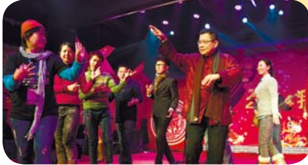
2014年，第三屆《打工春晚》在北京朝陽區文化館小劇場舉辦。