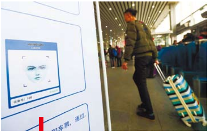
2016年12月，北京西站啟用「刷臉進站」自助驗證驗票系統。