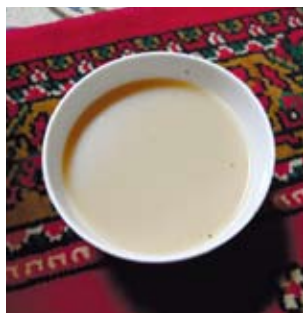
以黑茶兌上鮮奶的新疆奶茶。

其他熟食，最令人難忘的，就是拌麵和大盤雞了。拌麵的料可以自己選擇，拌在一起，紅紅的看起來很開胃，而且能吃到當地回民的特色小吃真是一個非常難忘的回憶！因為回民特別愛乾淨，所以如果到一個地方怕吃東西會瀉肚子的話，就選擇回民小吃吧！他們對吃的東西可是非常講究的。大盤雞是另一道令人回味無窮的佳餚，雖然我不太喜歡吃肉，好在大盤雞裡有很多土豆（馬鈴薯），新疆的土豆和西紅柿（番茄）也是非常可口的特產。大盤雞的醬鹹鹹香香的，配上乾辣椒的香味，幾種味道在嘴裡碰撞的感覺，非常美妙，非常下飯。除