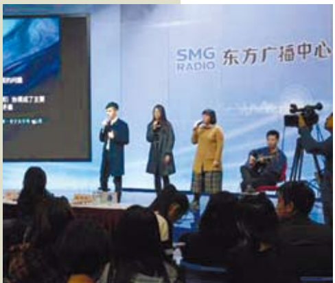
文創是台灣的優勢產業，正好和大陸新創產業發生關聯和互補，成為兩岸經濟合作交流的重要領域。

近年來，大陸各地相繼推出多項辦法，為兩岸年輕人在文創領域的交流合作、創業實踐提供便利和幫助。作為大陸國台辦授牌的首批海峽兩岸青年創業基地之一，上海金山科創園確立的四大主導產業也將文創產業納入其中。