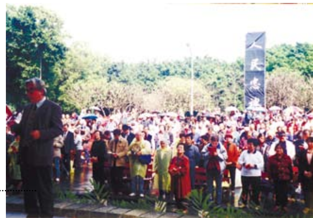
1993年青年公園春祭上的陳映真。……

於我而言，這兩段與母親交疊的記憶，構成我最初對陳映真的模糊印象。青少年時期，我消遣地、零碎地閱讀一些被書商歸類為「中國現代文學」的作家與其著作，很難說我是否特別喜歡陳映真，但若問我還記得哪些讀過的東西，那麼是陳映真《萬商帝君》裡的林德旺。我尤其記得他病假離開公司後，在延吉街上看到了一隻骯髒的流浪的外國狗的場景，他擔心著「那樣子滿臉滿嘴的毛，連眼睛都蓋住了，怎麼認路，怎麼走路？」讓我印象深刻的，還有《夜霧》的結尾處，電話那端對著丁士魁說「丁老師，時代怎麼變，反共安全，任誰上台，都得靠我們。」我在聯合副刊上讀到《夜霧》。時值1990年代末、2000年代初，我是高中生，聯考的壓力把我隔離於那個正為政黨輪替所躁動的台灣社會。當時的我只覺得小說中的李清皓、丁士魁，以及那位被冤假錯的張明在消費主義大街上不合時宜的吶喊，似乎透露給我一個不同於眼前這個所謂「邁向民主、一片光明」，並為之沸騰的台灣社會的另種面貌，那個面