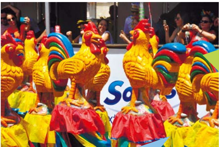
巴西狂歡節致敬中國雞年。