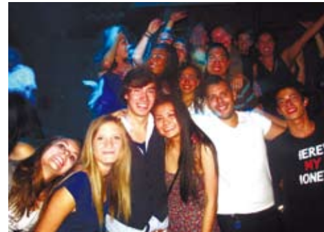
五道口的酒吧是外國學生愛流連的地方。

而另一種說法則是流傳的時間最長，也最受到生活在五道口的年輕人所接受。因為在很多生活在五道口的年輕人眼中，五道口是一個多元文化交融的地方，以清華北大為主的8所知名高校在這裡交匯，還有諸多科研院所、IT大公司總部分布在周圍，這使得酒吧、夜店、咖