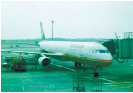
飛機降落在哈爾濱太平國際機場。

乘著飛機展開一段哈爾濱之旅，對於從小到大都沒看過雪的人來說，這是一個充滿無限幻想的地方，在還沒出發的時候，想著：「那裡的人是不是不怕冷？人的個性是不是也跟那裡的天氣一樣沒那麼熱情？」很多很多的想法就讓我在下飛機後——找出答案吧。