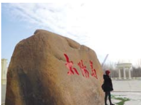
雪雕園所在的大陽島。

記得還沒下飛機的時候，許多人就開始把一件件衣服往身體裹，就我一人穿著一樣的服裝走下飛機，但一出機門頓時發現講話充滿霧氣，才感覺到原來我已經到了哈爾濱，一陣陣的寒風也讓我感受到這片大地的歡迎，入境後有了志願者前來接我們，這也展開了哈爾濱八天的奇幻旅程。