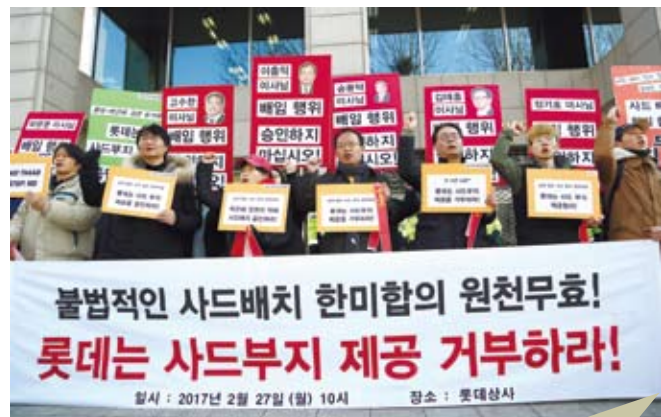
韓國民眾抗議樂天集團同意與軍方交換「薩德」用地。

國際諮詢公司畢馬威日前發佈的統計報告顯示，去年投資者對中國大陸金融科技公司的整體投資交易額比上年增長逾四成，達到67億美元的歷史新高。