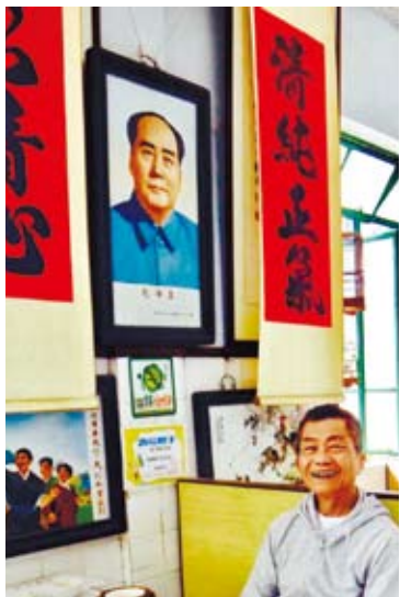
詩人於澳門龍華茶樓留影。

兩人走抵蛋撻店，正有一組拍攝人員錄影工作中，我們買好蛋撻走出店閃閃躲躲，深怕被他們以路人甲、路人乙錄進影中，也想找個地點把一枚十元澳幣的葡式蛋撻，趁餘溫尚存