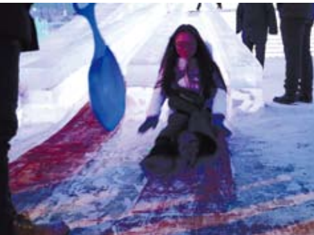
透過冰雪活動來體驗哈爾濱的冰雪文化。

隔一天，我們來到了冰雪大世界，在那裡我們看到不只有雪而是一座座維妙維肖的冰雕作品，而在霓虹燈的襯托下，讓這些作品都有如注入了新生命般活了起來，我也藉此更了解到「冰城」哈爾濱的冰雪文化！