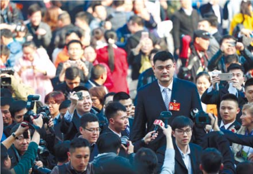
記者們採訪全國政協委員姚明。

今年大陸兩會期間，政協委員、著名籃球明星姚明，以「體育強國不僅僅是金牌，體育產業不僅僅是金錢」為題，在政協大會上發言。 姚明認為建設體育強國，金牌是必要的，但體育強國的內涵不僅僅是競技體育金牌，也包括群眾體育、體育產業、體育文化的齊頭並進。發展體育產業，投資是必須的，但投資只是建立體育產業生態鏈的一個環節。實體的運營、操作與管理同樣占據非常重要的位置。 因此，姚明提出了五點建議，內容如下： 一、培育市場。市場需要穩定、忠實的消費者，需要有人穿著專業的運動裝備，主動到運動場鍛煉，或者買票去看比賽，至少經常打開電視或者移動終端看直播。對體育的熱愛來自於興趣，興趣要從小培養，需要習慣養成。學校體育課不能成為