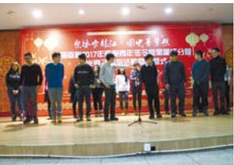
在黑龍江大學舉辦的兩岸大學生聯歡活動。

到了最後一天，我們前往了黑龍江大學參觀，我覺得很可惜的是因為寒假的關係所以食堂都休息，不然真的很想吃看看他們學校特別的食物；在晚宴的時候看到了台灣同學跟大陸同學可以共同展現出一連串毫不冷場的表演，讓我內心充滿了感動的，大家認識沒有幾天卻可以展現出如此高配合度的表演，這是多麼難能可貴啊！