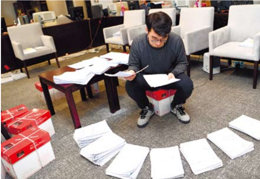
大陸全國政協十二屆五次會議提案組工作人員正抓緊整理分類提案。