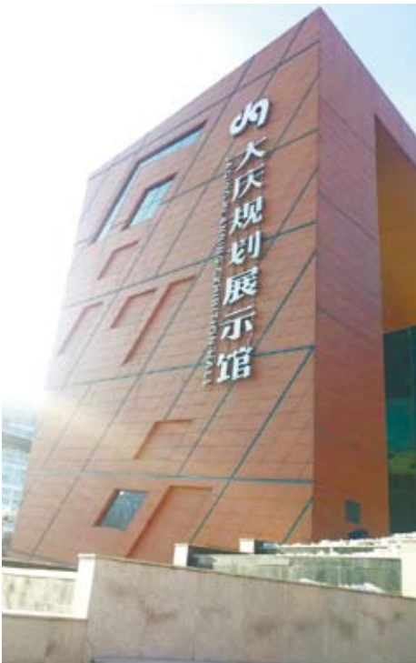
冬令營活動也安排參觀了各類展覽館，使同學們進一步瞭解東北的文化與發展現況。

這幾天的活動中我們參觀了很多紀念館，像是鐵人紀念館、大慶規劃館、七三一部隊罪證陳列館等，這些紀念館從鐵人精神到令人不恥的人體實驗，每個展區都讓我有不一樣的感觸，有的是如此的新奇，有的卻讓我如此的沉重，這也讓我更了解的黑龍江這塊土地上的歷史以及文化。