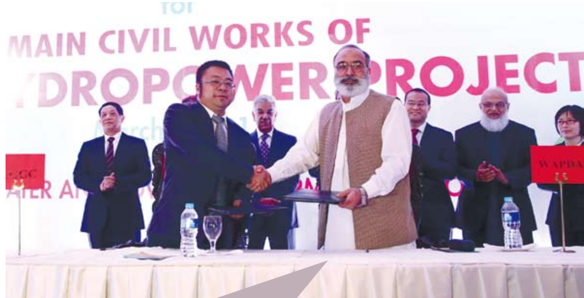
陸企承建巴基斯坦最大水電站項目，也是「一帶一路」的成果。

中國大陸提出「一帶一路」倡議，加之亞投行與金磚國家新開發銀行的成立，為區域基礎設施的互联互通以及投融資開闢了諸多經濟體合作的新途徑。許多第三世界的外國經濟學家也認為，大陸在參與國際經濟合作時，注重將本國利益與他國民眾利益結合起來的做法，是大陸能夠幫助相關國家克服貿易保護主義帶來的困難的重要原因。作為全球經濟的主要「發動機」之一，中國大陸經濟的穩中求進，或將給世界創造更多機遇。