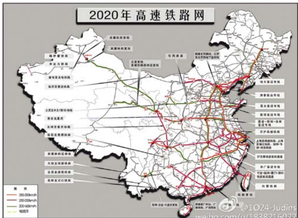
2020年大陸高鐵路網圖。

按照大陸官方目標，到2020年城市軌道交通經營里程，要比2015年（3300公里）增長近一