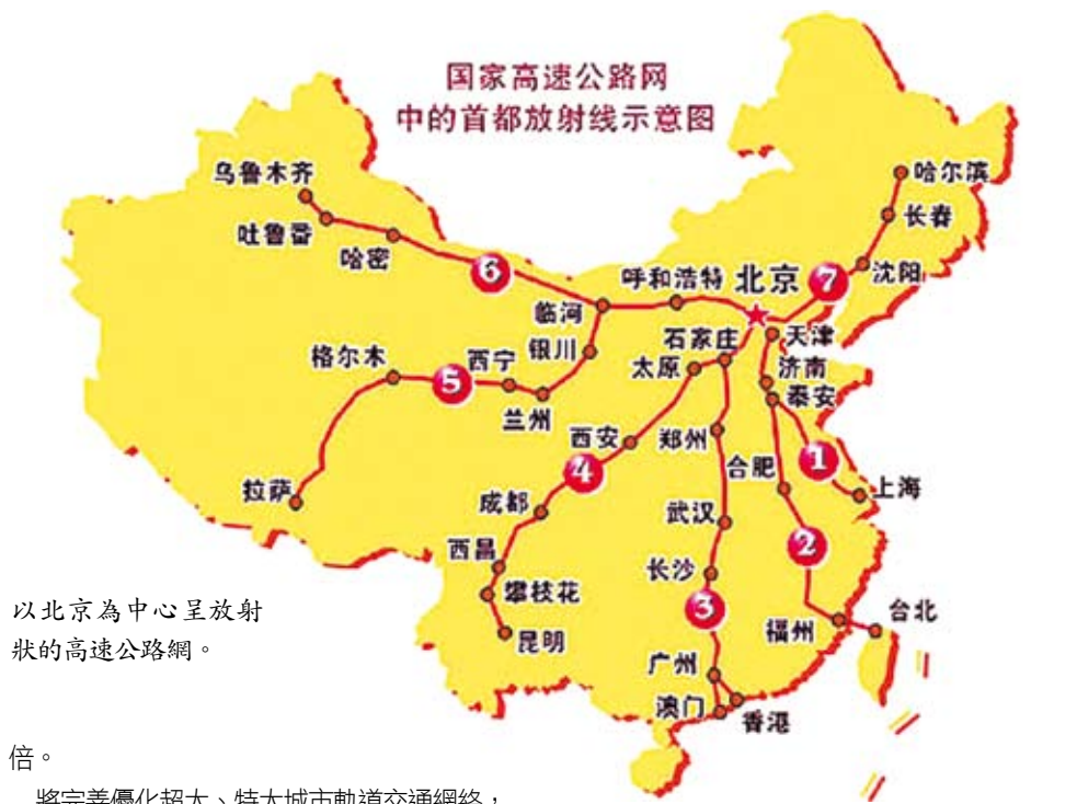
以北京為中心呈放射狀的高速公路網。