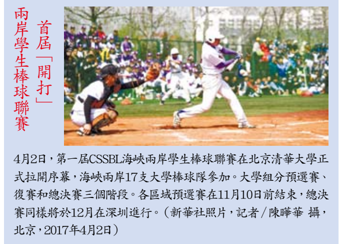
兩岸學生棒球聯賽首屆「開打」

有記者追問，台當局號稱要搞「潛艇自造」，設計階段費用就超過20億元新台幣。發言人對此怎麼看？馬曉光答問表示，台當局通過發展進攻性武器為自己的錯誤政治路線保駕護航，只能升高兩岸緊張態勢，拉開兩岸對抗局面，對台灣經濟發展和社會民生沒有任何益處。還有記者問，台灣方面陸委會負責人日前稱美國和大陸改善關係時不應把台灣作為籌碼、當成利益來交換。發言人對此有何看法？馬曉光回答說，問題是台灣當局自己想作籌碼，想被當作利益交換。