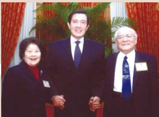
陳明忠夫婦與馬英九。