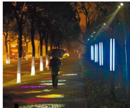
行人經過上海浦東新區張江鎮張江路。