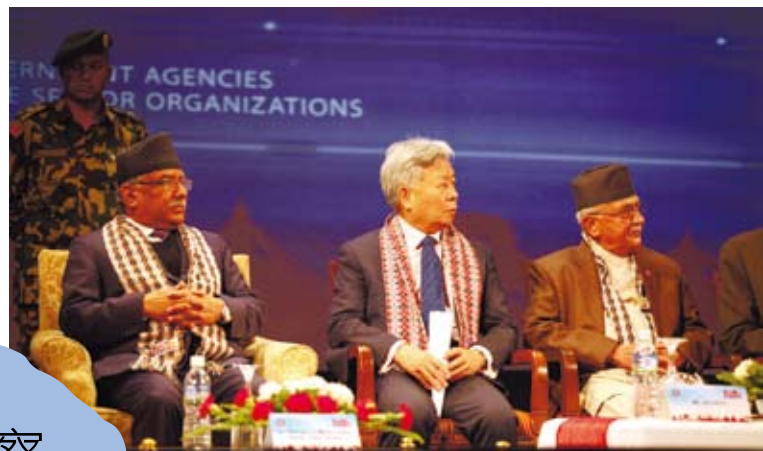
尼泊爾總理普拉昌達（左）和亞投行行長金立群（中）出席尼泊爾2017年投資峰會。

對借款國而言，亞投行猶如及時雨。2016年8月13日，巴基斯坦M4高速公路紹爾果德至哈內瓦爾段項目正