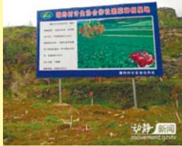
塘約村農業合作社的蔬菜種植基地。