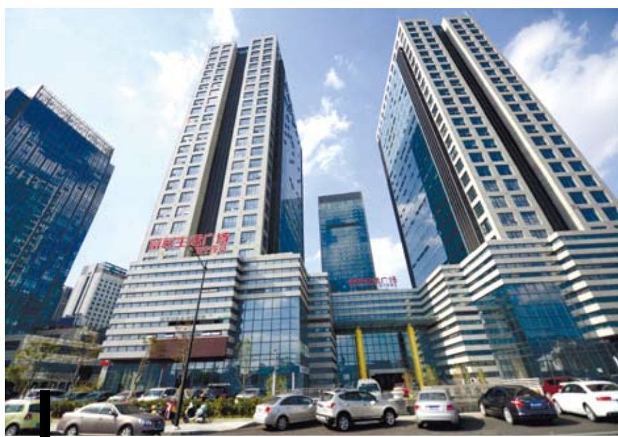
浙江舟山群島新區街景。

現代產業體系構建、生態環境開發與治理等過程中，優化資源配置，增強造血功能和自主發展能力，並不斷創新融資方式，強化國有資產的引導作用。湘江新區前身為2008年6月成立的長沙大河西先導區。2015年4月更設為湖南湘江新區，成為大陸第12個、中部地區首個國家級新區。