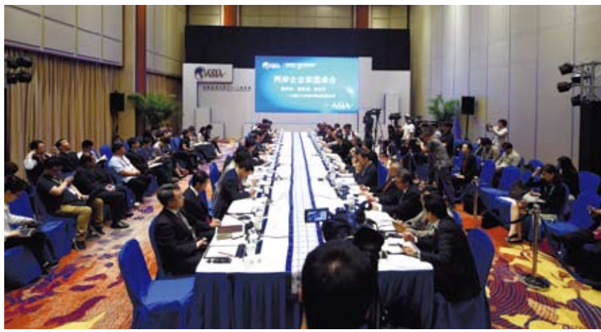
在博鰲論壇舉行的兩岸企業家圓桌會議。