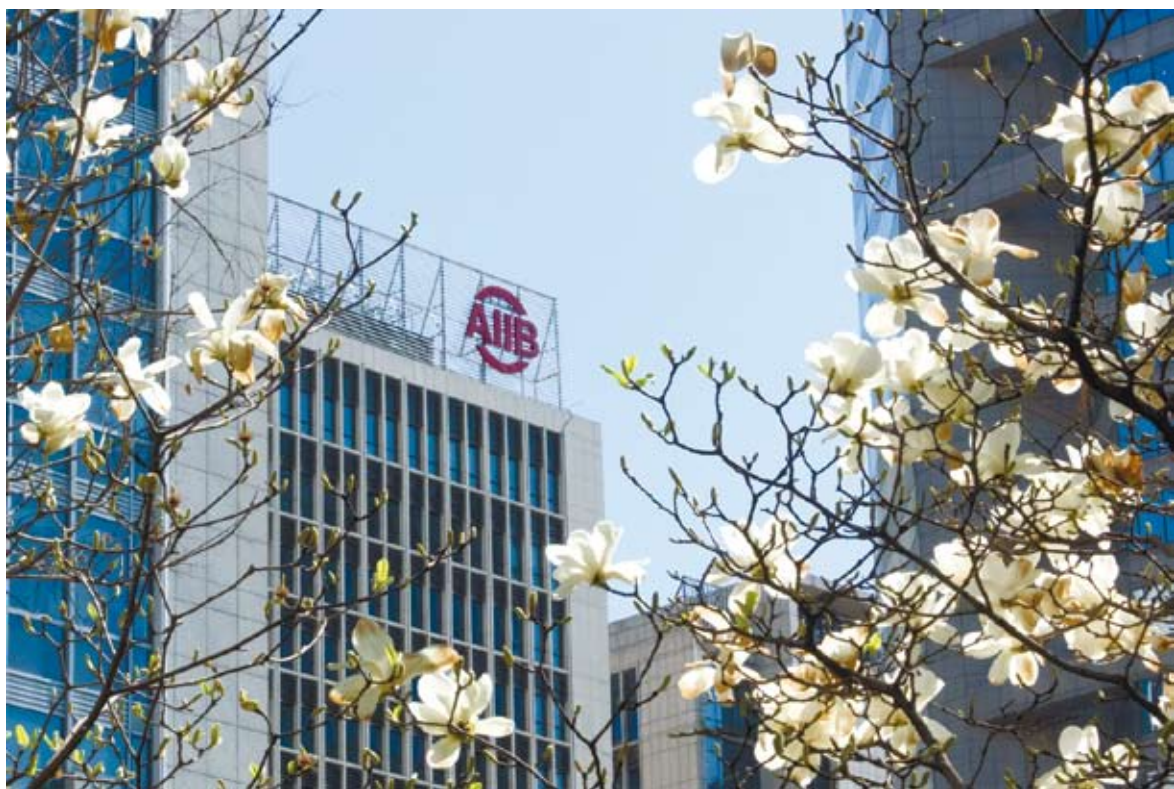
北京金融街的亞投行大樓。

近日，亞洲基礎設施投資銀行（亞投行）在北京宣佈其理事會已批准13個新意向成員加入亞投行，這是2016年初正式開業的亞投行首次擴充成員。