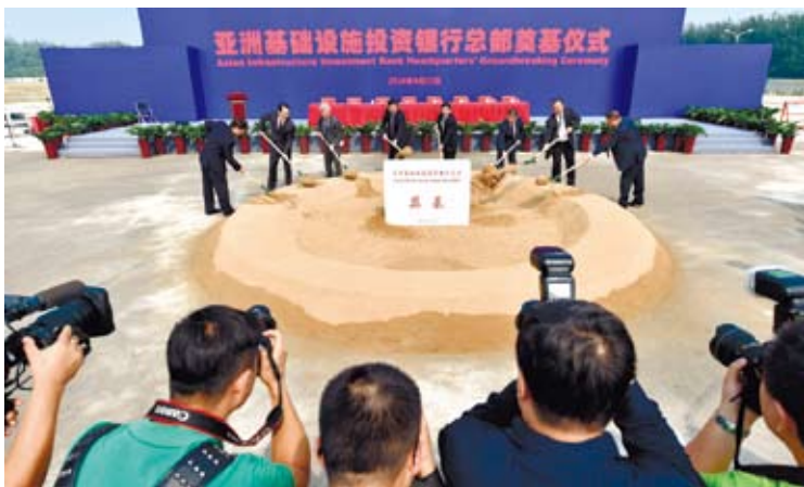
2016年9月亞投行總部奠基儀式在北京舉行。