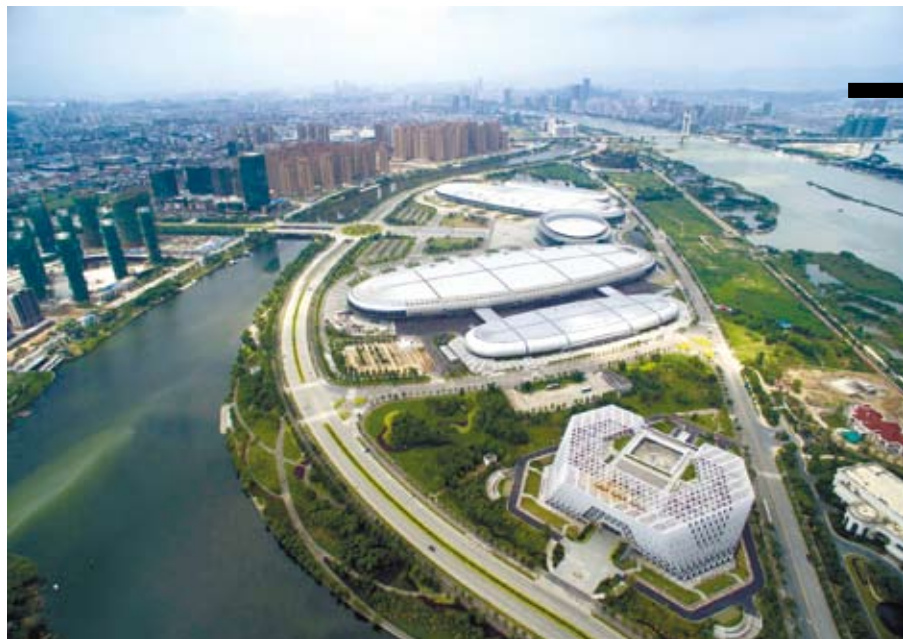
航拍的位於福州市倉山區的海峽國際會展中心和福州規劃館，這裏是福州新區的核心區。

據悉，湘江集團將在推動片區開發（梅溪湖國際新城、大王山旅遊度假區等片區）、基礎設施建設（智慧城市、海綿城市等）、