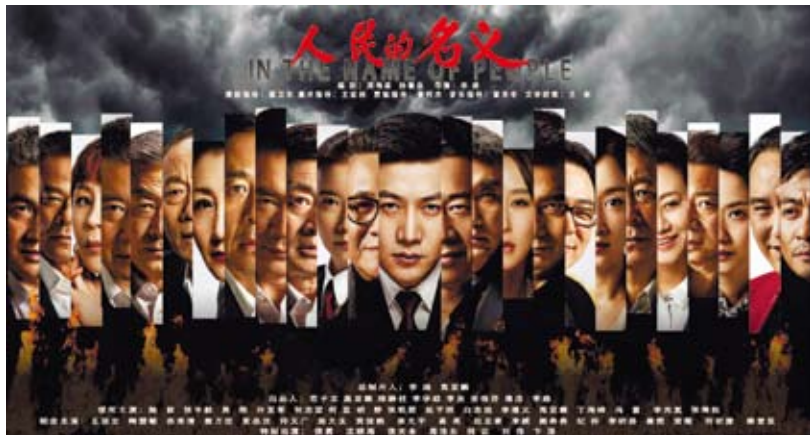
《人民的名義》力邀30位大陸實力派演員加盟。

這也會產生「蝴蝶效應」。現實中不少大陸官員受到不法商人的「圍獵」，「不與組織交心交肺，卻與老板勾肩搭背」，謀取不當利益。這種現象嚴重破壞了大陸市場經濟秩序、汙染了政治生態，危害極大。要根除商人「圍獵」官員現象，必須雙管齊下，除了法辦貪官外，也要堅決打擊行賄行為，嚴厲懲治那些「圍獵」官員的不法商人。