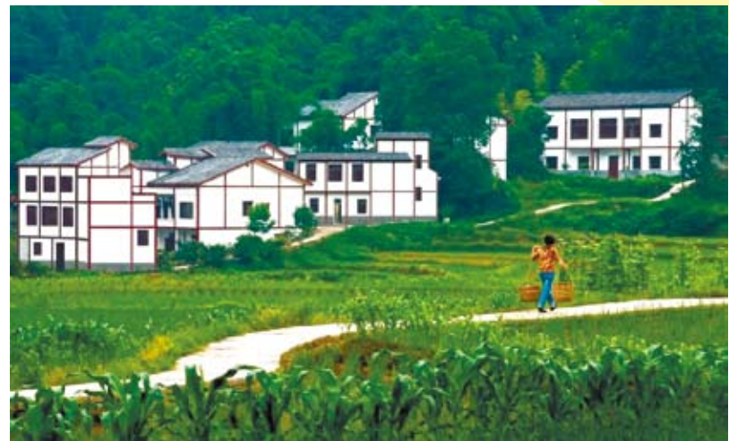
大陸農村的土地所有權是集體的，農民的承包地只是得到經營權。