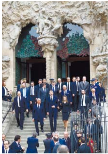
巴賽隆納為恐襲死難者舉行追思活動 8月20日，在西班牙巴賽隆納地標性建築聖家族大教堂，國王費利佩六世（中）參加為恐襲死難者舉行的追思活動後離開。

從內部因素看，受金融危機影響，歐洲許多國家經濟發展停滯、社會矛盾加劇。而難民潮進一步激化了社會矛盾，為恐怖主義的蔓延提供了土壤。從整個歐盟的角度看，它在人員流動方面控制比較弱，安檢等防範措施也不到位，因此給恐怖主義以可乘之機。