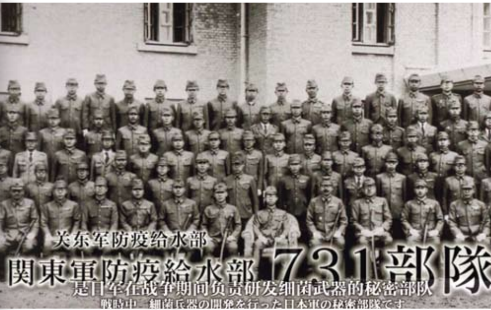
日本NHK電視台日前播放的特別節目《731部隊的真相》，引起強烈衝擊和反響。

一個國家對待歷史的態度，反映了其準備如何走未來道路。在這個大是大非的問題面前，希望日本社會有更多有識之士能夠勇敢地站出來。