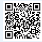
拜訪兩岸毒報的網頁