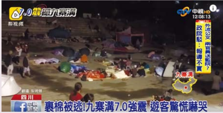
8月8日九寨溝發生七級大地震。(新聞畫面)

不時有人從雨中抱著頭衝進來，進屋一抬頭，一個美男子，又一人衝進來，一抬頭，又一美男子。真是奇了。喇嘛問我住哪兒，我其實忘了旅館的名字，只好把房卡拿給他看。他說：「瀾峰。到瀾峰出租車五元錢。我幫你叫。」於是他跑出雨巷攔車不下十次，每次失敗而返，就以比木格措的湖水還清澈的眼睛對著我說：「雨太大了！」。終於，被他攔到一部，上車時，我因為感謝或是怎地，竟突然問他名字，但他卻緩緩地揚揚手，平平淡淡地說：「不用了」。回飯店的路上，我有點悵然地咀嚼著我的俗氣、濁氣。 因此，若是你問我，這趟川西甘孜藏族自治州之旅看到了什麼、聽到了什麼，我看到了清澈，聽到了清澈——在那兒的水、雲、山，與眼之中。 今天早上，照例去學校的游泳池游泳。游完，我把頭枕在流水槽，仰望颱風環流的雲空，我突然很高興，感覺很幸福。大地上的人們啊，有雲無雲，我們畢竟在共同的蒼穹之下。