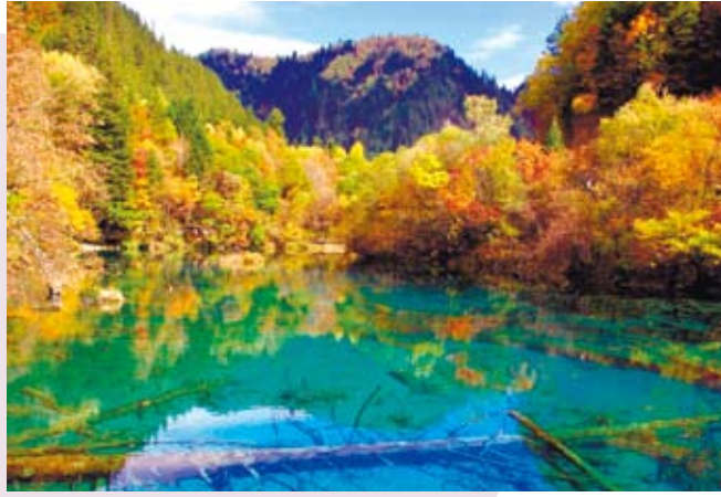
九寨溝的美景令人神往。