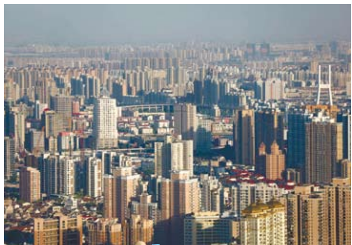
5月18日，國家統計局公佈大陸70個大中城市新建商品住宅價格下降的城市有5個，上漲的城市有65個。圖為上海市黃浦區的各類商品住宅建築。（上海，2016年5月18日）

新北京人和北京戶籍家庭的自住房、公租房等保障性住房分配「三七開」的方案，是北京樓市在供給側調控提出的4個「三七開」之一。其他3個「三七開」包括：在北京市未來5年供應的150萬套住房中，產權類占70%，租賃類占30%；在產權類的住房中，面向市場銷售的商品房占70%，定向安置等保障性質的住房占30%；在商品