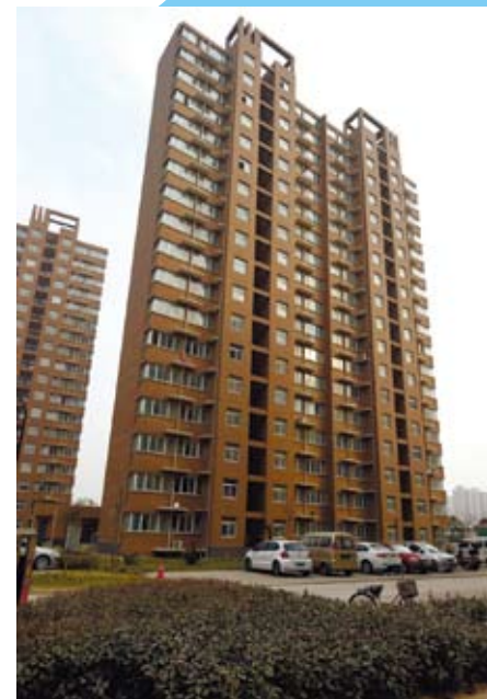
河南將試點推行公租房「租售並舉」，將來公租房將可租可買。「租售並舉」一方面可以有效回收資金，及早還付銀行貸款；另一方面可以滿足部分保障物件的產權需求。圖為位於鄭州市聯合花園社區內的公租房。（鄭州，2015年1月20日）

賃市場發展的政策。廣東1月發佈《關於加快培育和發展住房租賃市場的實施意見》，提出搭建市場化、專業化、規模化的住房租賃平台，用於收購或長期租賃庫存商品房等。截至6月，廣東省已成立肇慶、清遠、汕頭、佛山、東莞、中山等6個地租賃平台。