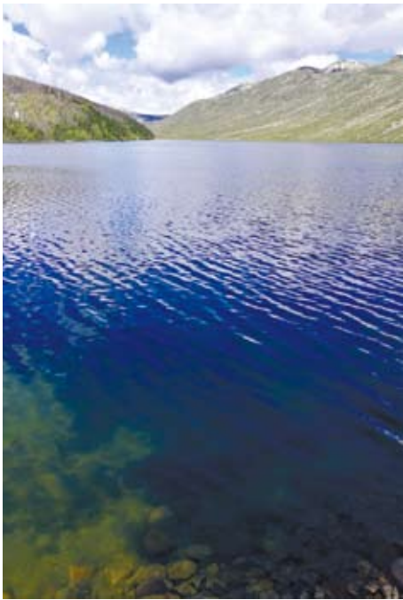
木格措湖的湖水與雲天。

識的投射。在黑人這個他者裡頭，有中國的自我。這裡頭容或有一個對強國的欲望要求，從而在某種政治正確的角度看來可說是保守的，但對這個欲望要求，我們有一種內在性與歷史性的理解，而不可以簡單套用西方帝國主義擴張那一個解釋框架。那裡頭其實可能有一種意思：中國人若是強了，我們要幫助所有受苦難的其他弱小民族。而這是近代從孫中山以來的中國思想傳統呢！」朋友於是說：那你還是很肯定嘛！我說：「不然。我只是否定那些否定而已。這片子文大勝於質，基本上是一個3D特技動作片，不值得特別讚賞。」 有一天，在穿行了無數的「九拐十八彎」之後，我們在一個傍晚到達了丹巴。打開旅館房間的窗簾，赫然見山；一座巨大而荒蕪的山聳立在前。逼在眼前的大山看久了，還是有壓力，於是我聯想起那位愚公老先生。山與我之間有一條奔流的河，叫金川河。奔流的瀾，永恆的峰，智者與仁者如此同在！這個金川就是著名的大小金川之役的那個金川。清朝平定了土司的叛變之後，廢除了土司，改由中央派官治理，是謂「改土歸流」。路上，導遊說，丹巴人很漂亮，每年還有選美比賽，第一名是金花，第二名是銀花，第三名是石榴花。還說丹巴人是一支比較特別的藏族，可能和流亡的西夏貴族有關，云云。 飯後，我獨自出去，沿著河往市區步行。起初，風和、天藍、雲白。然後，風稍作、雲稍起。我在風起雲湧之間，走進了一條藏人鋪街。剛走到街尾，突然豬八戒下凡，先飛沙繼而驟雨。沒帶傘，慌忙之間，跑到對過一家有屋簷的佛具店門口等雨停。然而雨更大了，我只好退到店屋內。往裡頭瞅，一個年輕的喇嘛與我點點頭，表示接納。雨越下越大，喇嘛也站過來。問我打哪兒來，去過哪些地方，我都一一與告。因為跟他說過塔公寺，他問我是否信佛，我說沒。他說：「很好，很好」。他的普通話比較簡單，但都是肯定的、包容的。我們有一句沒一句看著雨聊天的時候，我發現他長得極好看，黃色的無袖背心、暗紅色的寬褲，臉龐善良、堅毅、柔和，似笑又非笑。