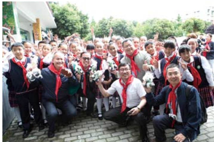
台灣嘉賓在由台灣頂新集團援建的頂新新建小學與孩子們合影。