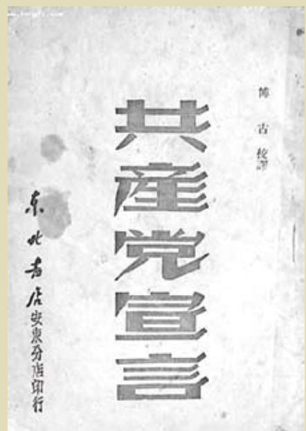
1943年在延安出版的《共產黨宣言》，由博古翻譯。

我還共享馬克思的另一個直覺——早在1848年，馬克思就對此有所表達，而後，在他晚年的作品中，他又重新表述了這個直覺——那就是，資本主義只代表歷史上的一個短期的支架；它的歷史