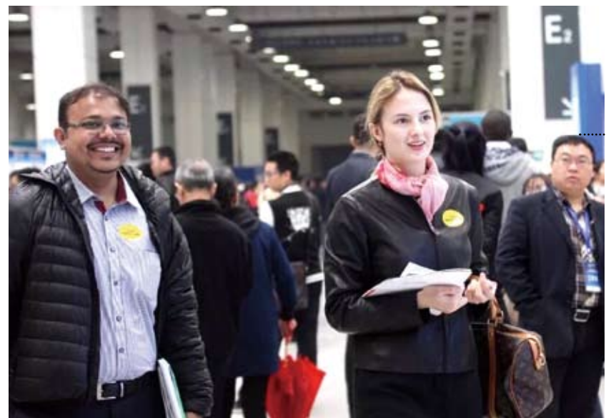
天津人才引進活動現場的外國留學生們。

大陸一些專家表示，城市間的「搶人大戰」將推動人才資源的合理配置，提升人才的利用效率、城市創新能力和綜合競爭力，在進一步推動戶籍制度的放開和公共服務均等化等方面也有促進作用。但與此同時，引進人才也必須跟公共服務提供能力和樓市調控政策結合起來，要避免人口短期急劇湧入，超過城市的承載力，出現基礎設施、教育醫療等公共服務短缺的問題。