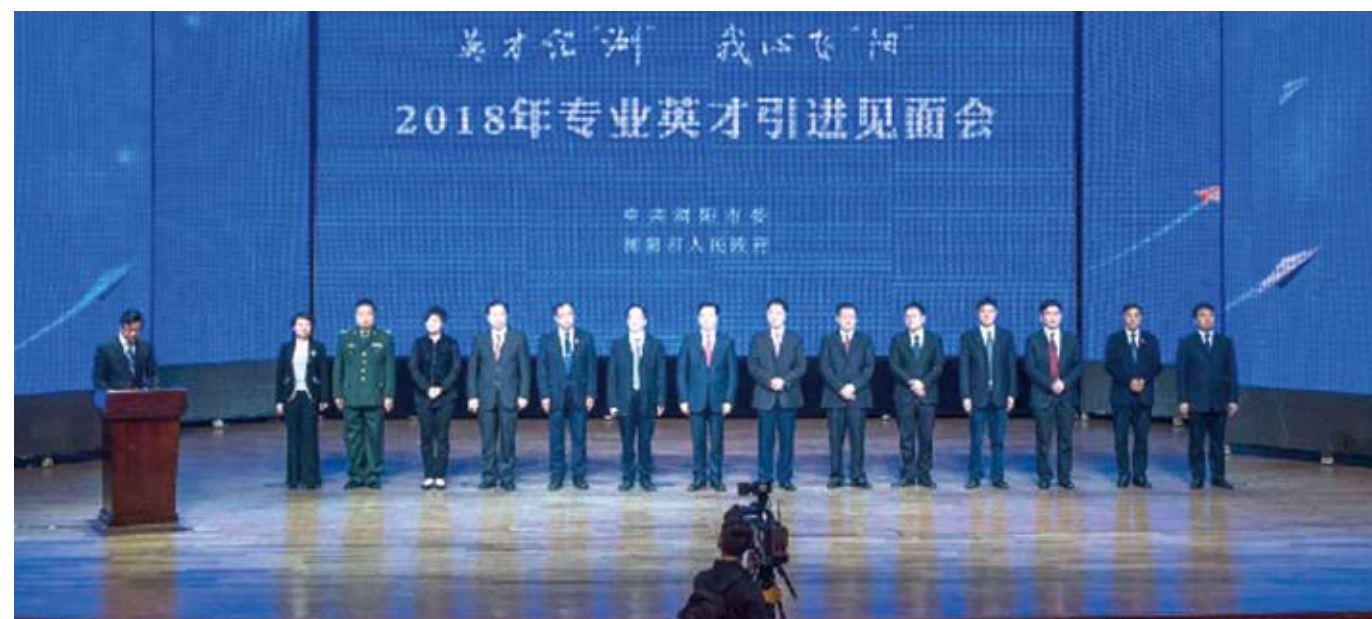
「專業英才」引進見面會上的人才們。

《揚州市企業引進人才住房保障實施辦法》近日實施，明確符合條件的大學畢業人才可享租房補貼，高層次人才可享受最高200萬元一次性購房補貼。據瞭解，新辦法擴大了資助企業和人