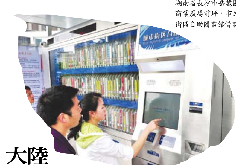
湖南省長沙市岳麓區步步高商業廣場前坪，市民在城市街區自助圖書館借書。

當晚還有一部新劇備受矚目，出品人侯鴻亮攜主演王凱、楊燦、董子健登台，為大家介紹了重點劇目《大江大河》。在後台採訪中，王凱表示，為了貼近戲中角色的形象，他瘦到了65公斤，從外表上看成果顯著。不過，他說，如何駕馭比現實中的自己小18歲的劇中角色的演繹才是真正的最大挑戰，「因為大家也知道我今年36歲了，所以要演18歲的宋運輝壓力蠻大的，不過拍攝到目前來看的話還是比較滿意的」。