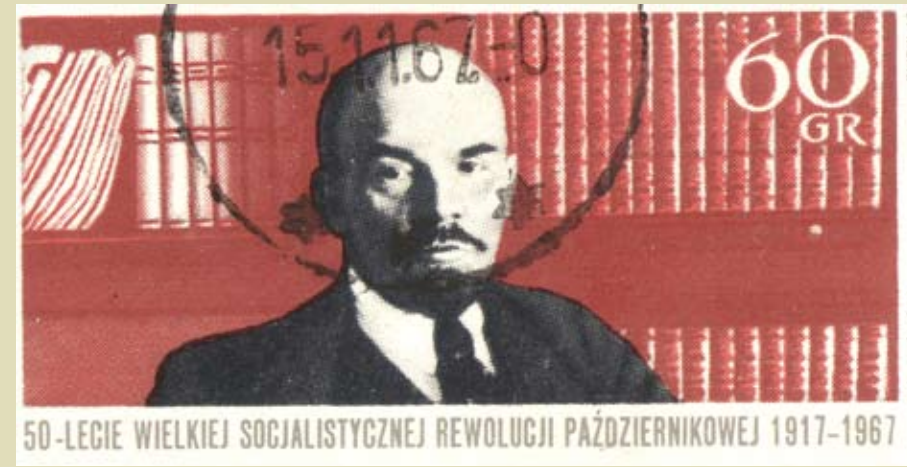
列寧的帝國主義論影響深遠。

十九世紀末的大規模蕭條，加劇了競爭壓力，加速了資本的集中和集中化過程，並最終導致了資本主義系統的質變：1800年到1890年普遍的競爭工業資本主義，讓位給了寡頭壟斷的（共享壟斷的）資本主義。這些寡頭依然是在本質上屬民族國家的基礎上組織起來的群體，儘管他們的活動也擴張到了國外，並且他們的戰略，也不時地相互滲透並有了世界主義的傾向。在這個時代，他們的競爭，激化了民族國家之間的競爭，終結了先前大不列顛的主導地位。在這個時期，世界分裂為彼此對抗的帝國主