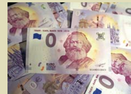
為紀念馬克思兩百週年誕辰，德國發行面值零元的歐元。

我還提到馬克思的另一個重要貢獻，特別是馬克思關於長期過渡中的「統一和多樣性」的看法。這些看法比以往更符合當代的挑戰。