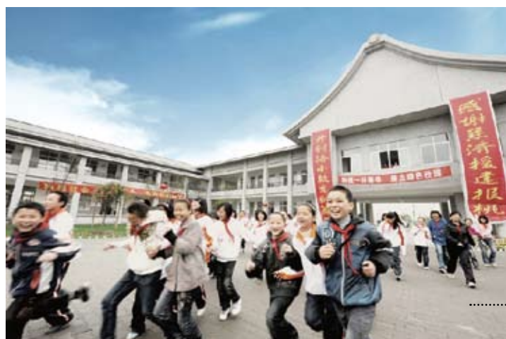
台灣慈濟基金會全資援建的什邡市洛水鎮慈濟小學。

「5·12」汶川特大地震發生後，時年64歲的台北市前副市長歐晉德，率22人的救援隊帶著餘震危險趕赴極重災區開展救援。地震十周年之際，歐晉德再次來到四川。「十年，地震災區發生了翻天覆地的變化，讓我對未來更有信心。中華民族只要團結起來，再大的困難都能克服。」