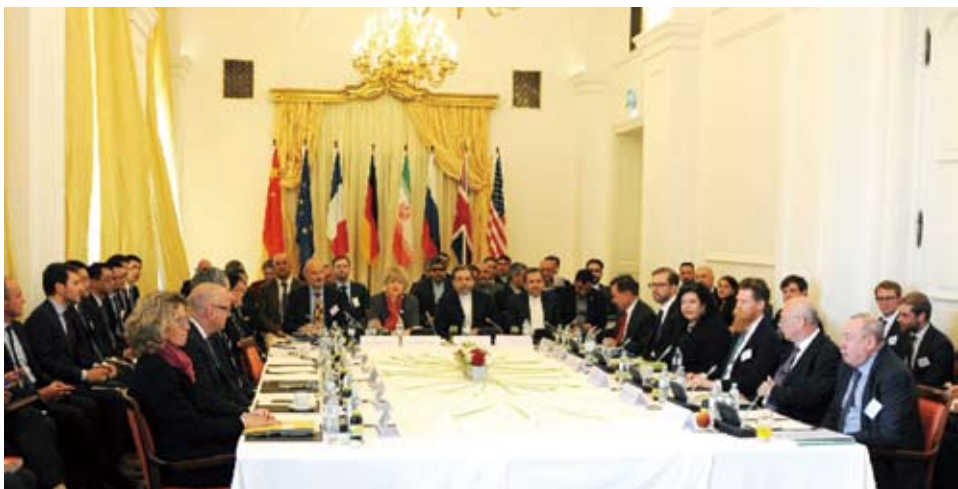
2017年4月25日，在奧地利首都維也納，伊朗核問題六國(美國、英國、法國、俄羅斯、中國大陸和德國)與伊朗舉行伊核全面協議聯合委員會第七次會議。