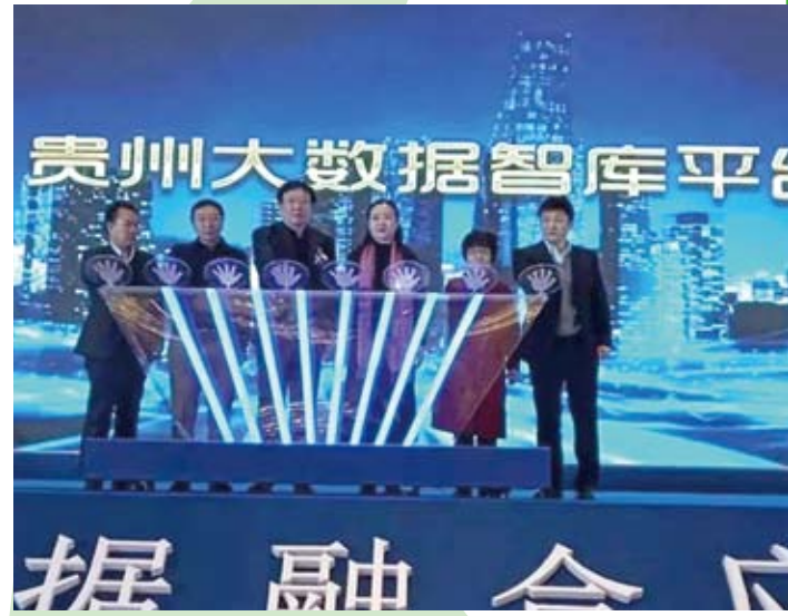
貴州大數據智庫平台啟用儀式。