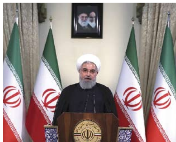
5月8日，伊朗總統魯哈尼在德黑蘭發表電視講話。

伊朗的國際問題專家表示，美國在伊核協議達成後並沒有解除對伊朗的金融制裁，這也是伊朗經濟民生遲遲得不到改善的重要原因。另外，大多數西方企業懼於美國對伊敵對政策，害怕受到牽連不敢來伊朗投資。伊核協議讓川普如鯁在喉，他不願看到伊朗有任何發展前景，所以做出背棄協議的選擇毫不為怪。