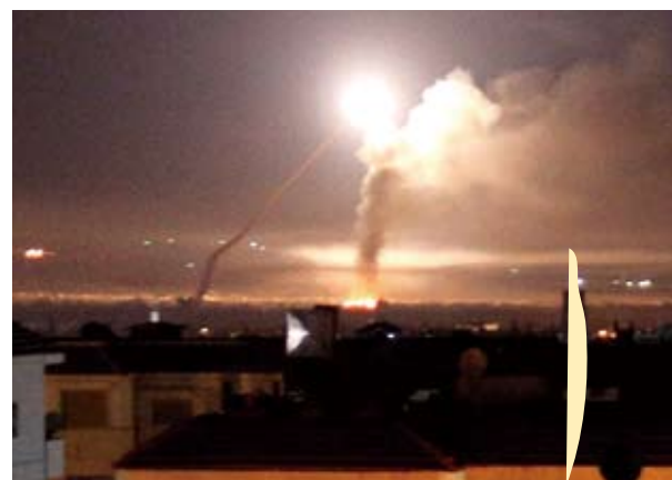
5月10日，敘利亞防空系統當天持續攔截並擊落了以色列射向敘境內的數十枚導彈。