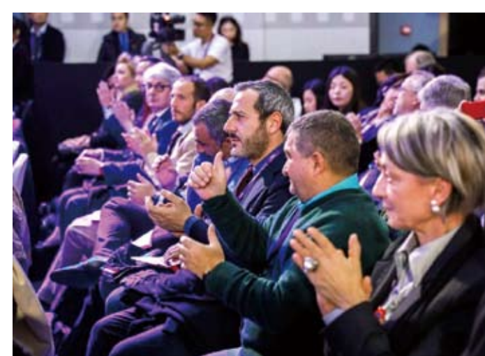
第一屆中國(寧波)海外工程師大會現場外國專家。