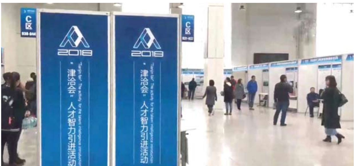
天津多措并举吸引海外人才招聘會現場。