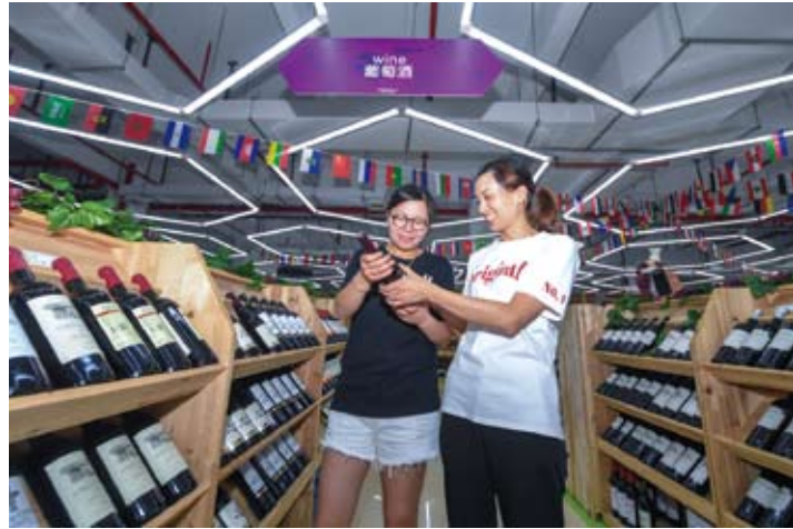
中國向世界敞開懷抱：消費者在浙江省嘉興市平湖國際遊購小鎮專業市場內挑選進口紅酒。