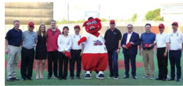
參加天豬隊首場開幕的中、美球隊職員和吉祥物合影。

德州天豬隊所屬的美國協會聯盟成立於2005年，擁有包括來自加拿大的共12支球隊。天豬隊主場位於Grand Prairie, Texas（德州大草原城）的AirHogs Stadium，可容納5,445人。天豬隊成立於2007年，曾獲得3次分區冠軍（2008，2011，2013）和一次聯盟冠軍（2011）。上賽季戰績為43勝57負。