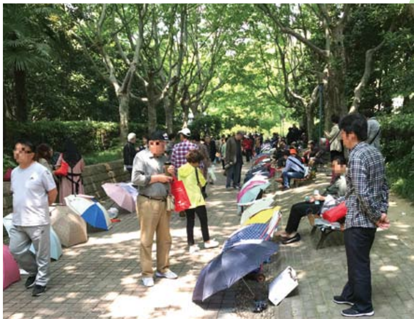
上海人民公園內的「相親角」幾乎看不到年輕人的身影。

中國大陸改革開放後經歷了1980年代的獨生子女出生潮。婚戀成本上升，工作和生活節奏快、壓力大，社交圈較小等問題，導致「80後」「90後」青年中有人安於父母之命，「湊合過日子」，也有的甘願成為「剩男」