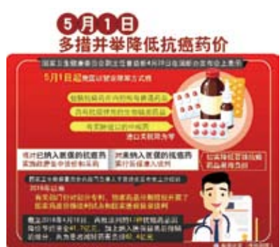
許多進口抗癌藥物關稅調降為零。