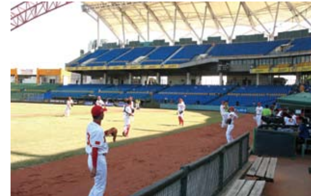
2015年於台中舉行的亞錦賽，中國大陸棒球隊和日本對戰前的練球。

近年，台灣島內不斷有非理性地民眾在球場內推行台灣隊正名運動，去年更發生中國新歌聲事件，已難看到大陸好手來台交流。由於中國大陸國家代表隊曾在北京奧運擊敗過台灣，如果我們對對岸積極地赴美交流，仍視而不見，中國大陸隊曾在北京奧運擊敗過台灣的噩夢，恐怕又會在近期的國際比賽場上演。