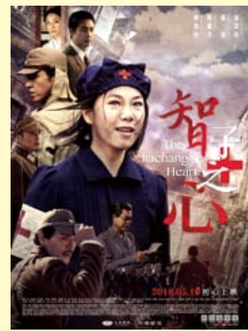
引起爭議的電視劇《智子之心》。

民族意識與反殖精神，體現了殖民地台灣人並不認同自己是與日本內地一致的日本人。回歸前後的香港人，除了少數極端的港獨龍獅旗追隨者之外，本土意識再高漲，也不會說自己是「英國人」。當前台灣在反中情緒下，瀰漫著美好浪漫的「(日本)國境之南」想像，但當年的「殖民地台灣人」也不會因此順理成章變成「日本人」。把殖民地台灣人等同於日本人，那麼台灣人對於日本的戰爭、侵略與殖民罪行，是不是也該負起相同的責任，並受到應有的清算呢？