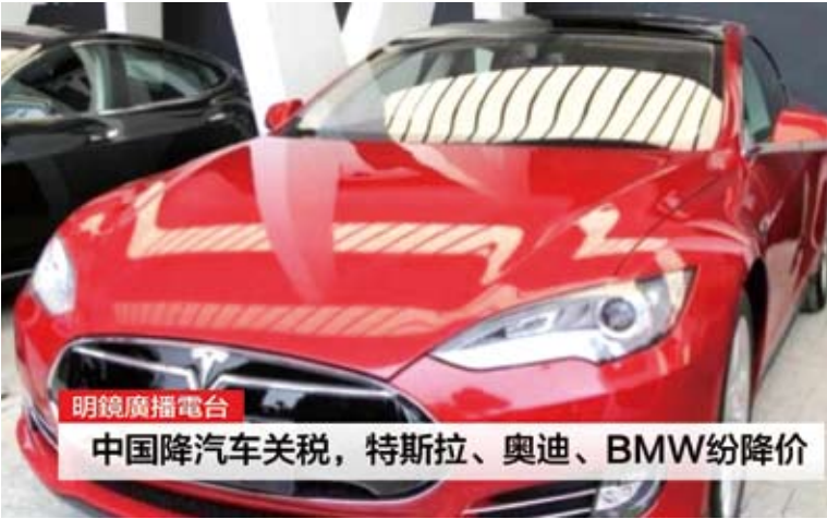
大陸汽車調降關稅後，進口車價格大幅下降。