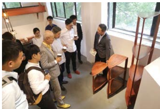
台灣青年走訪上海市「麥可將」文創園內的店舖。