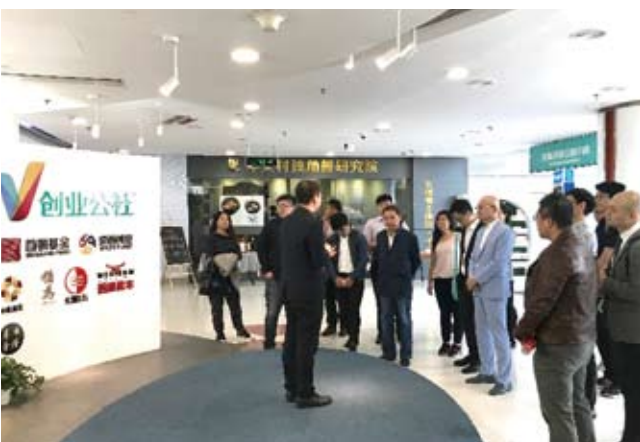
2018台灣青年創業就業大陸訪問團一行參觀國家級眾創空間創業公社·中關村國際創客中心。