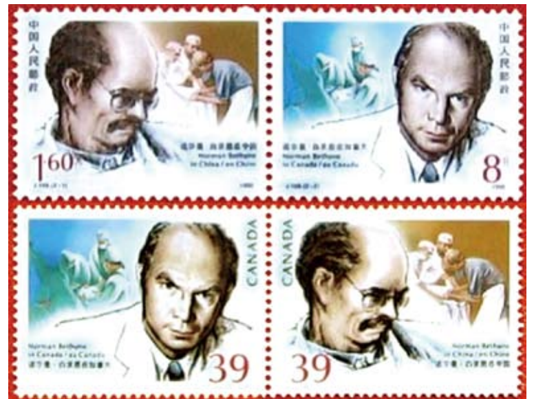
1990.3.3《諾爾曼·白求恩誕生100週年》紀念郵票。（中、加聯合發行）

今年的世衛大會，大洋洲新西蘭與北美洲加拿大的兩個代表，同一口徑發言曰：疾病無國界。它們什麼時候開始這麼慈眉善目，入境免予申報健康狀況了，舉凡接觸者檢疫、疫區檢疫和國境檢疫全免了？這兩個征服原住民族，建立白人政體的所謂文明國家，再怎麼遙遠的距離，依然可以隱隱嗅到，當地原住民被屠殺後，殘留在白色手掌的血腥氣息，那些氣息積鬱難離。