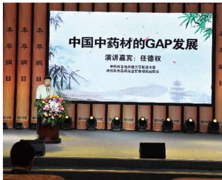
參加第八屆海峽兩岸李時珍醫藥文化與產業合作發展論壇的嘉賓在論壇上進行《中國中藥材的GAP》主旨演講。

大陸國家中醫藥管理局港澳台辦公室主任王笑頻指出，台灣在醫院管理、健保制度方面有著豐富經驗，內地在科學研究、中草