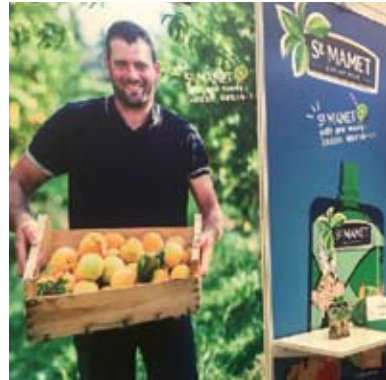
多國食品和農產品企業期待參展首屆中國國際進口博覽會。