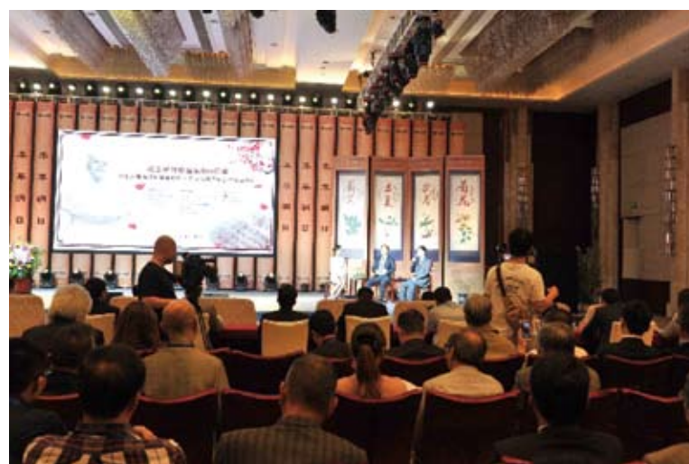
圖為海峽兩岸李時珍醫藥文化與產業合作發展論壇的嘉賓討論環節。

2008年以來，湖北省以文化傳承、產業合作為主旨，聯合台灣的中醫藥高校等已連續舉辦了七屆「海峽兩岸李時珍醫藥文化與產業合作發展論壇」。