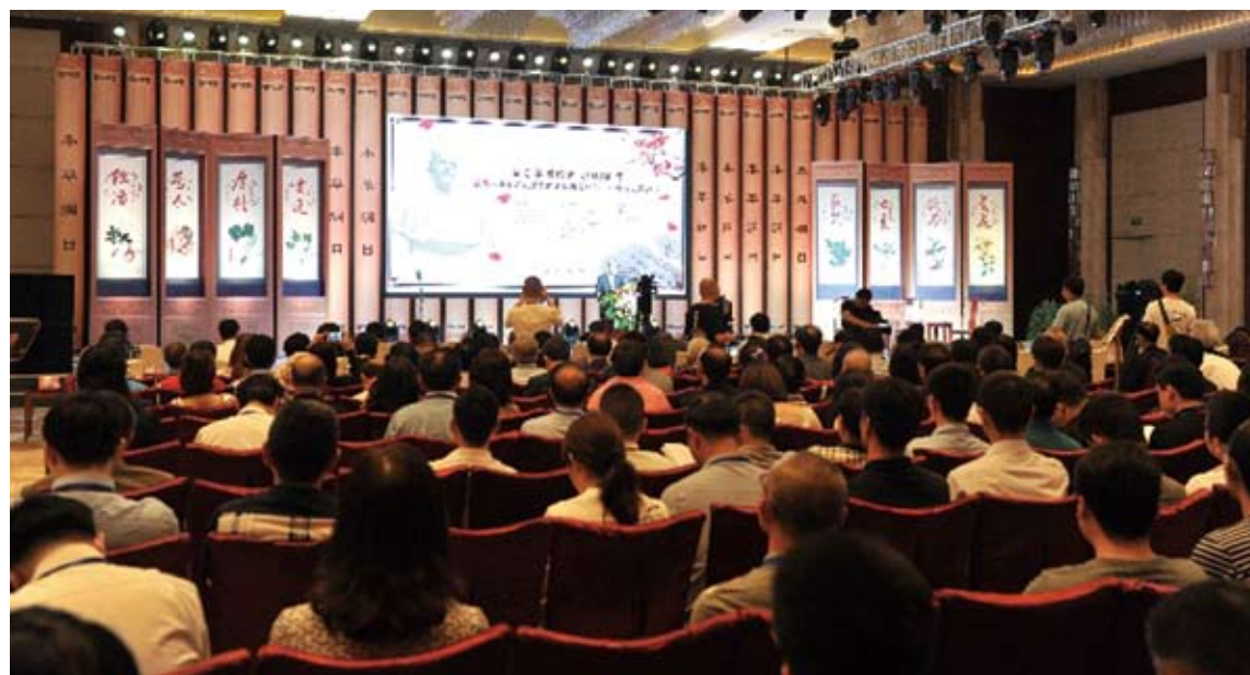
兩岸中醫藥界人士紀念李時珍誕辰活動現場圖片。

「我們希望借助這台煮麵機，讓世界各地的人們體驗到中國美味與高科技的結合，為中國『智造』創造的新零售業態點贊。」馬齋說。