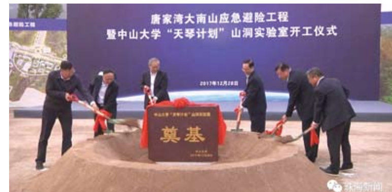
2017年，天琴計劃山洞實驗室建設開工動土。

雖然有信心，但羅俊仍希望大陸相關研究推進力度能再大些。「引力波大家都認可覺得重要，它打開了解宇宙觀測宇宙的新窗口。但如何做，技術路線要在大陸廣泛達成共識需要一個過程，這很正常。」他相信，隨著研究不斷地推進，屆時大陸科學家一定會形成共識，推動空間引力波探測加速發展。