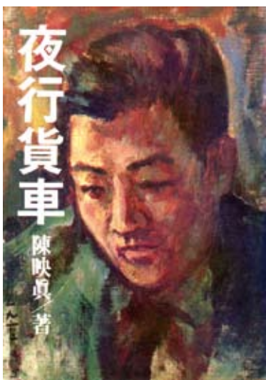
陳映真小說《夜行貨車》。