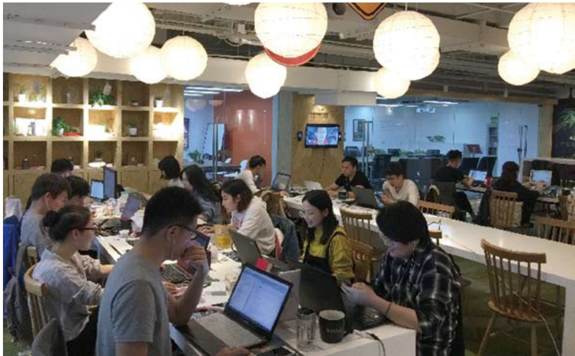
北京華燦工廠內景。(新華社 查文曄 攝)