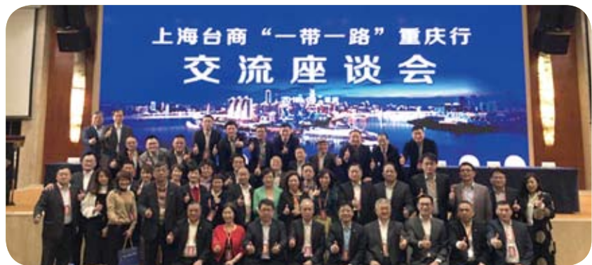
今年3月，上海台商「一帶一路」重慶行考察團，達成投資意向約16億元人民幣。

馬曉光也表示，今年大陸將繼續實施「第三屆台灣青年暑期實習計畫」，為台灣青年提供約600個暑期實習名額，此次實習崗位所在地分佈較廣，行業類別多，企業類型全。