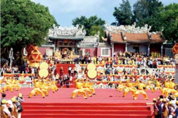
福建東山「海峽兩岸關帝文化旅遊節」 6月26日，第二十七屆海峽兩岸（福建東山）關帝文化旅遊節在福建省東山縣開幕。共有來自海峽兩岸各界人士約1400人前來參加。圖為開幕儀式上表演的武術節目。（新華社照片，記者 / 姜克紅 攝，東山[福建]，2018年6月26日）

海協會副會長孫亞夫在會上表示，當前兩岸關係貫穿著堅持與衝撞一個中國原則、反對與圖謀「台獨」、推動與破壞和平發展、維護與