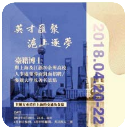
4月，上海舉辦的第二屆「英才匯聚·滬上逐夢」，吸引了70位優秀台籍博士（生）參加。