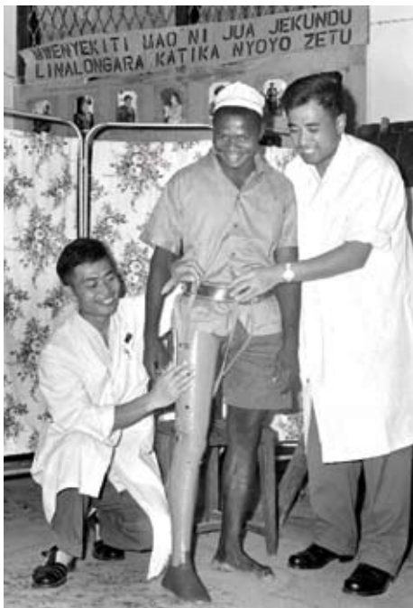
1968年3月2日，坦尚尼亞一位油料保管員，在大陸醫療隊的幫助下裝上了義肢。

陸企走進非洲，它們在這片熱土上和非洲人民一道打造一個又一個大工程大專案，不僅自身得以壯大，更為發展非洲貢獻了力量。