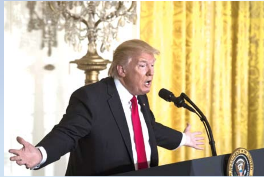
川普把自己塑造成一個「反精英」、「反建制」的政治人物。

8月16日，全美350家媒體聯合以社論反擊川普總統稱媒體是：「人民公敵」的說法。這是響應《波士頓環球報》8月10日發出的倡議。《波士頓環球報》說，美國的偉大之處在於一個自由的媒體可以向有權有勢的人道出真相。給媒體貼上「人民公敵」的標籤，既不符合美國精神，也對美國兩個多世紀以來共有的公民契約構成危險。該報號召全國媒體團結起來，反擊川普針對媒體和媒體人的「骯臟戰爭」。