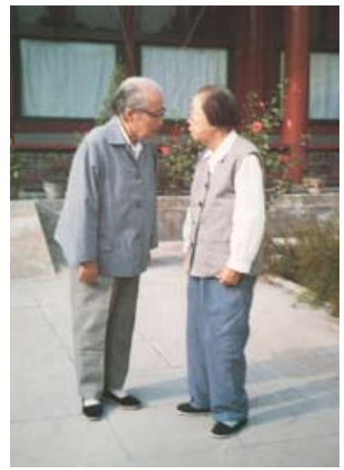
周侯松與鄧穎超交談。

文革結束，周苓仲被調到陝西省家畜改良站。平反後恢復幹部職務，直至1991年退休。恢復了政治生命的他，後來當選省台聯理事，當了省台聯副會長；再後來當選省人大代表、省政協常委，擔任過台盟陝西省副主委。他履行職責，積極參政議政，獻計獻策，為陝西的招商引資，為陝台合作做出了自己的貢獻。