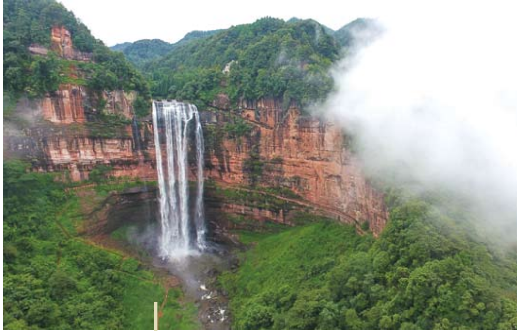
四面山望鄉台瀑布