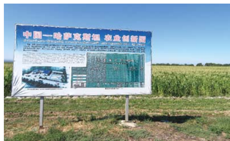
中哈農業創新園內的玉米地。

伴隨著「一帶一路」框架下中哈農業合作的推進，哈薩克斯坦人逐步擺脫了「冬天只有馬鈴薯加白菜的時代」。