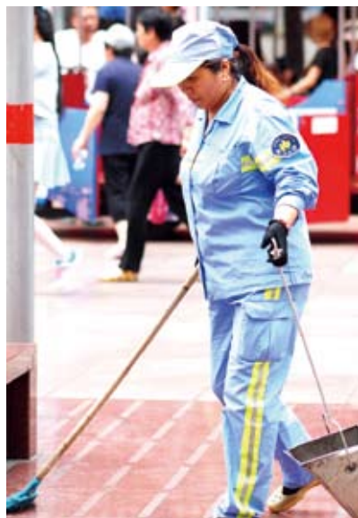
酷熱中，大陸一名環衛工人在上海市南京路上進行清潔作業。

《瞭望》週刊記者在重慶、安徽、浙江等地採訪發現，高溫津貼發放情況「參差不齊」，一些企業或單位能夠按照政策執行，高溫津貼