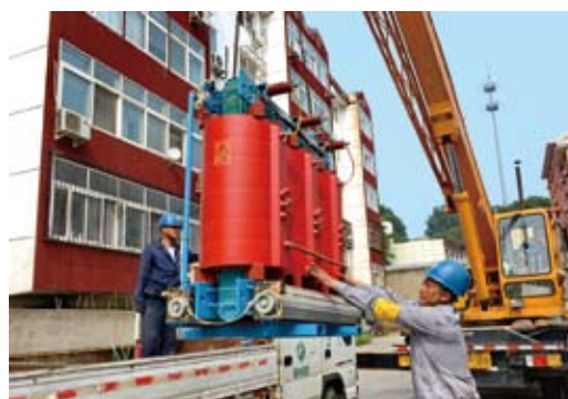
酷暑中，大陸電力工人奮戰高溫。（新華社）