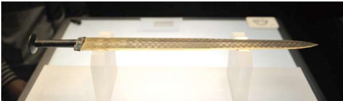
越王勾踐劍，湖北博物館收藏。勾踐是一位著名的寶劍鑑賞家。