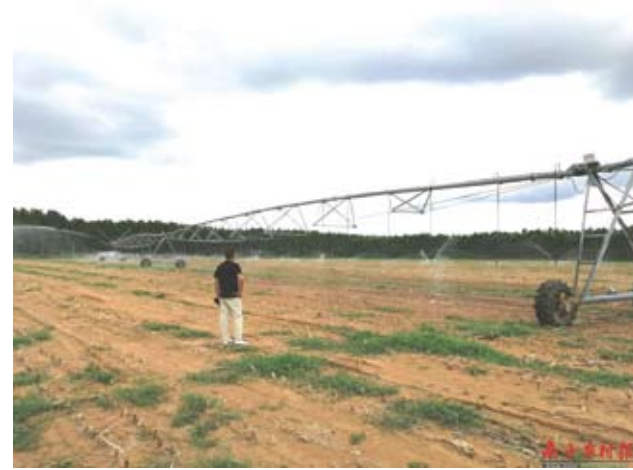
自動行走的噴灌機從東北運到廣東。