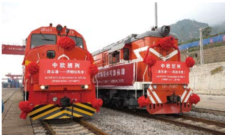
整裝待發的中歐貨運列車。