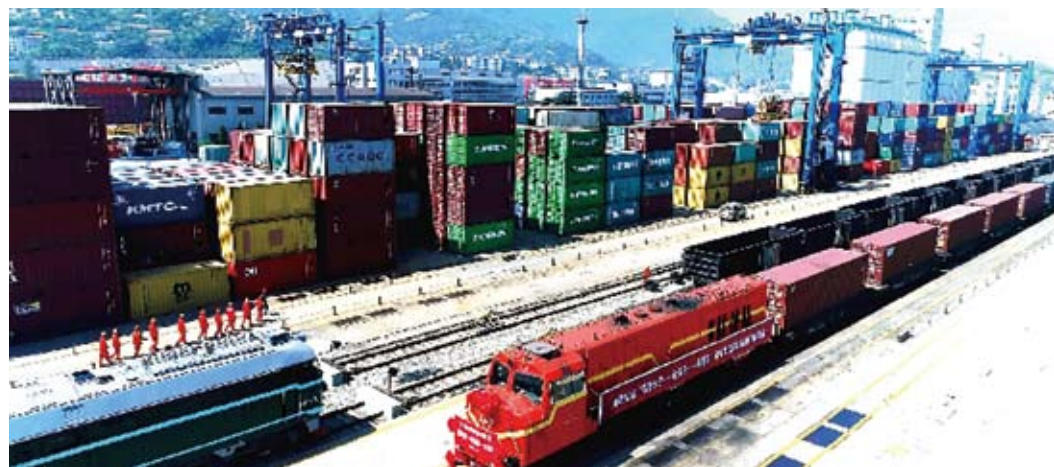
貨運繁忙的連雲港。