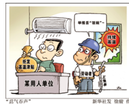
漫畫：面對「高溫津貼」，勞工「忍氣吞聲」。

事實上早在2012年，大陸就印發了《防暑降溫措施管理辦法規定》，明確要求用人單位安排勞動者在35°C以上高溫天氣從事室外露天作業以及不能採取有效措施將工作場所溫度降低到33°C以下的，應當向勞動者發放高溫津貼，並納入工資總額。