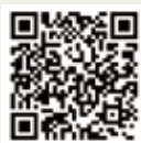
拜訪兩岸薈報的網頁