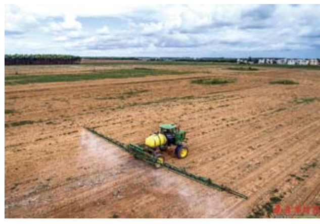
「北薯南種」盤活了遂溪的閑置土地，為當地農民帶來就業機會，增加收入。