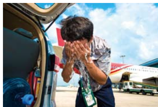
高溫下的勞動者（之二）。

《瞭望》週刊報導了大陸「高溫津貼」在各地、各種不同高溫場所發放的現況調查。第一個是陸企中建股份重慶軌道交通九號線一期工程施工現場。一台台巨大的龍門吊矗立在現場，幾名工人正在地面上進行作業，但更多的工人在地下50公尺深的隧道內施工。