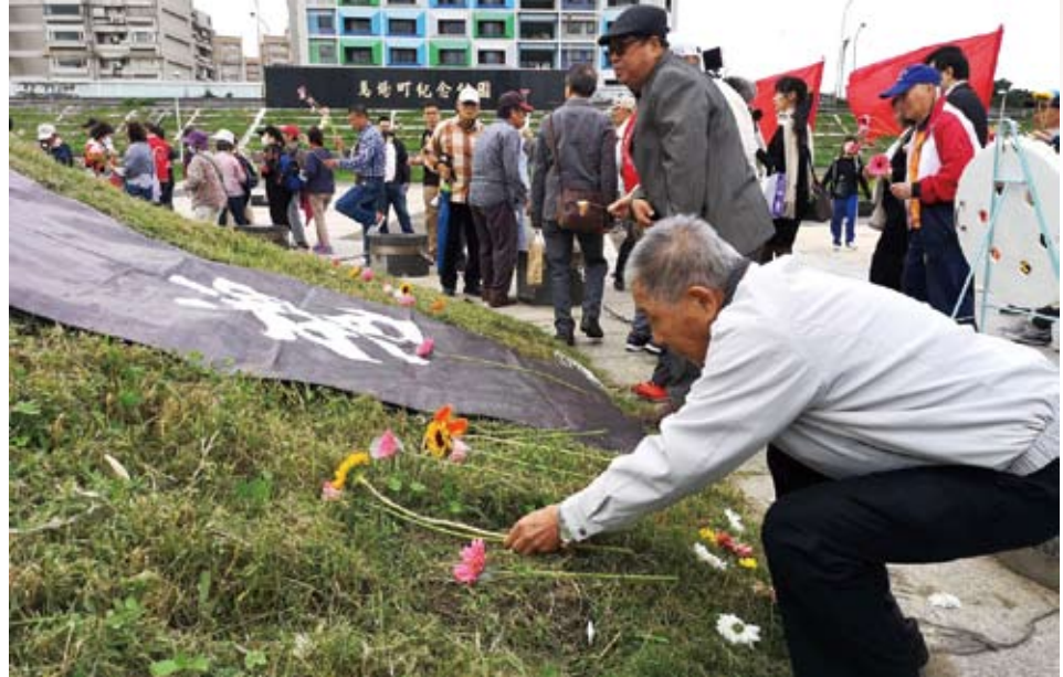
受難人與家屬向馬場町土丘獻花。

最重要的是，宣言強調反對全面以「冤案」形式對五〇年代白色恐怖時期政治案件「除罪化」，而抹煞了政治受難人當年以各種形式反抗威權體制的正當性與正義