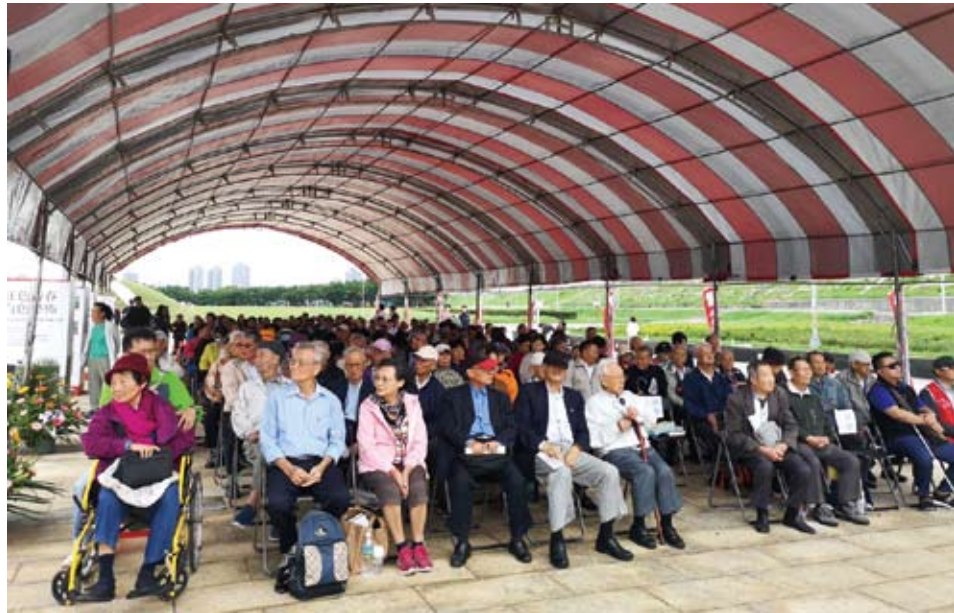
來自台灣各地的政治受難人與家屬。