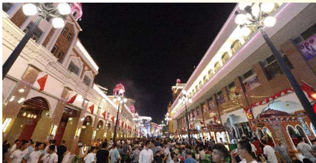
烏魯木齊二道橋大巴扎步行街美食街區夜市。