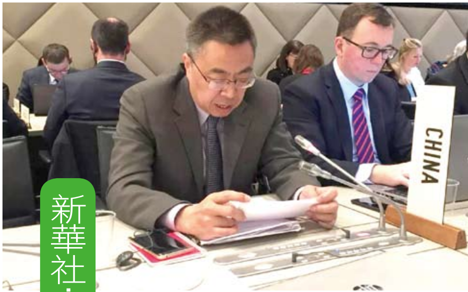
中國大陸駐WTO大使張向晨(左)，反駁「強制技術轉讓說」。