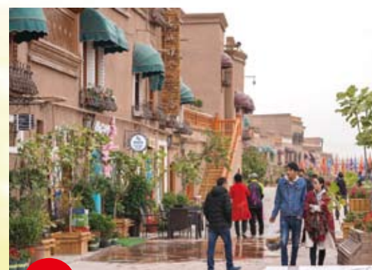
深秋時節，新疆喀什氣候宜人，居民與遊客在老城內悠閒享受秋日時光。

深圳社工組織在喀什地區開展的社會工作服務，開創了國內少數民族社工服務的先河。據統計，八年來，這一社會工作援疆模式，在喀什等地孵化了本土公益組織6家，培養了社工人才72名；開發和實施了民生社會服務專案15個，服務覆蓋了當地60個社區，幫扶共計22萬人次；幫助1460戶貧困家庭戶均增收萬元人民幣以上，引導居民建立了3個經濟合作社。