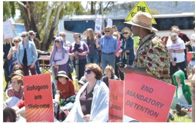
2013年11月18日，約200名澳洲人在首都坎培拉的國會大廈門前舉行集會，抗議政府的難民甄別和安置政策。

分析人士認為，澳政府的上述態度表明，為阻止難民大量湧入它將不會輕易改變難民拘留政策，由此引發的爭議還將長期持續。