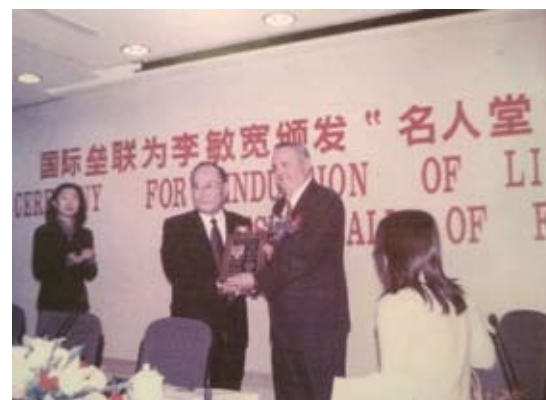
李敏寬帶領中國大陸女壘隊多次獲取世界冠軍、奧運會亞軍等。圖為國際壘聯為李敏寬頒發世界名人堂證書入選。

(文接12版) 一大) (從難從嚴從實戰出發，大運動量)，可是對大運動量李敏寬有自己的理解。他跟隊員說，你們訓練半天就夠了，有需要學習的該上夜校的你們就去。所以隊員中不少人考上大學，很多隊員都被抽調到國家隊，而且都是主力隊員。因為李敏寬注意文化素質的提高，隊員們能理解戰術意圖，技術好，理念好。