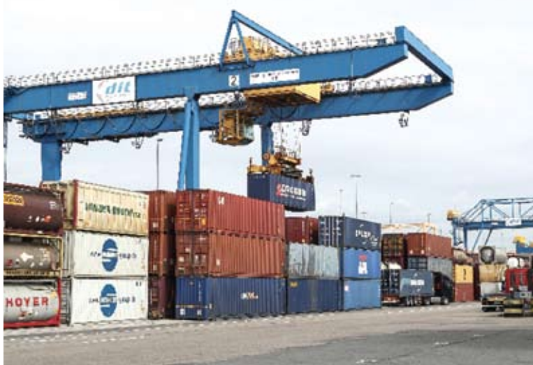
這是德國西部城市杜伊斯堡DIT貨運場站的資料照片，塔吊搬運中歐貨運列車集裝箱。（新華社 單宇琦 攝）

依託比港，中遠海運還開通了遠東經海運至比港、再由比港經鐵路運至歐洲內陸的海鐵聯運路線中歐陸海快線。中歐陸海快線南起比港，途經馬其頓和塞爾維亞，北至匈牙利、捷克、斯洛伐克和奧地利，直接輻射區域人口3200多萬。這條路線將遠東至中東歐的貨運所需時間縮短了7至10天。