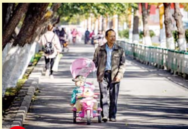
行人走在新疆石河子一處街道。