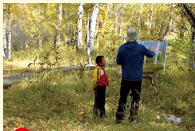
在新疆阿勒泰地區哈巴河縣，一名畫家在白樺林裏寫生。