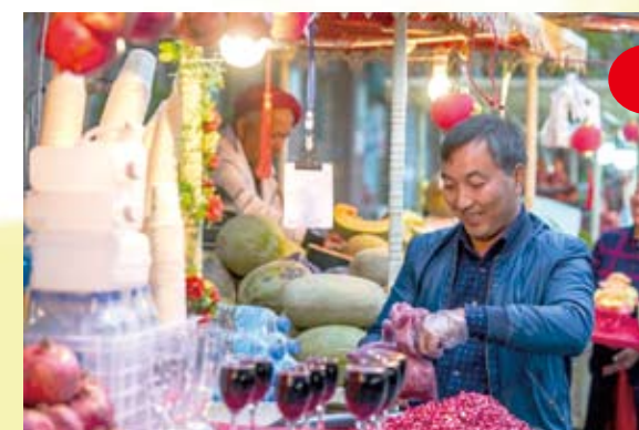
一位水果商販在喀什老城的夜市上製作石榴汁。