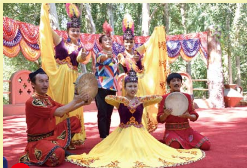
遊客在吐魯番葡萄溝景區拍照留念。

據介紹，整個電站的扶貧週期為20年，將通過建立大病醫療、教育基金、貧困戶救濟金等多種方式，為深度貧困的帕米爾高原居民脫貧提供可持續性的支援。據測算，扶貧電站能夠幫扶塔縣1410戶16806名塔吉克族居民脫貧，佔當地人口的1/4以上。