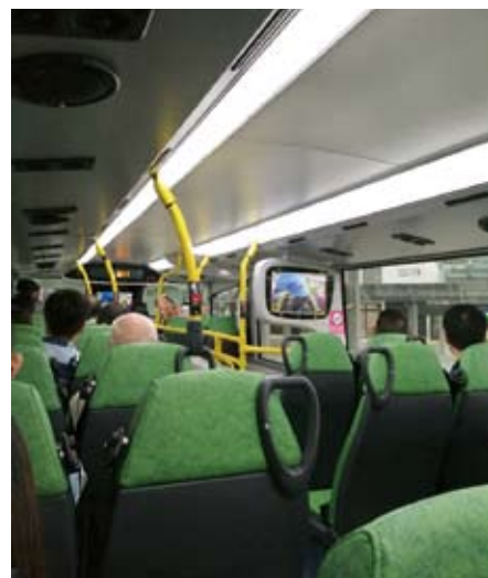
穿梭巴士內部陳設。

大橋香港口岸處於大嶼山四通八達的交通網絡之內。旅客可在珠海或澳門口岸辦理出境手續後，乘搭口岸穿梭巴士前往香港口岸，完成入境手續後轉乘各種本地公共交通工具前往香港各區。此外，旅客也可使用跨境巴士、跨境計程車或跨境私家車，從珠海或澳門經大橋直接前往香港。