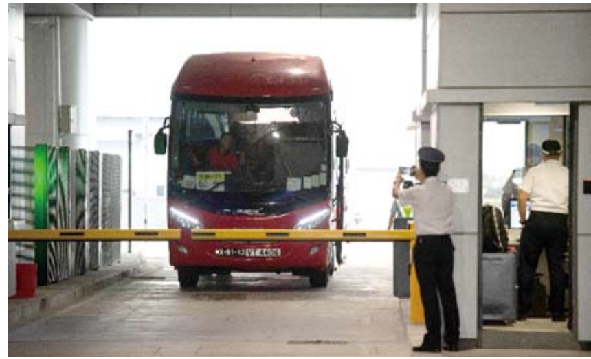
跨境巴士在港珠澳大橋澳門口岸離境車道上通關。

9時整，香港口岸開放，首批旅客興奮地湧入出境大廳，紛紛拍照留念。他們的臉上流露出即將見證港珠澳大橋通車的興奮與喜悅。