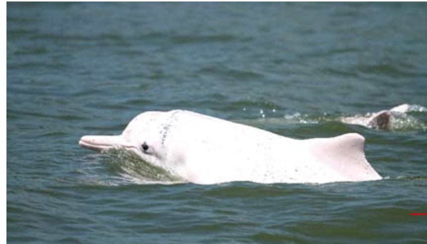
這是在廣東珠江口海域拍攝到的中華白海豚。