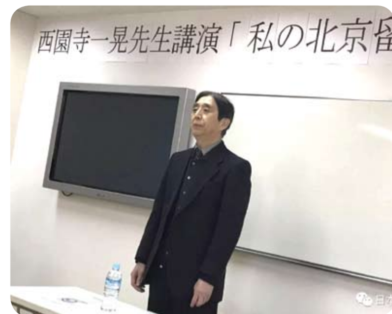
日本學者西園寺一晃講述自身在北京的生活經驗。（網路圖片）