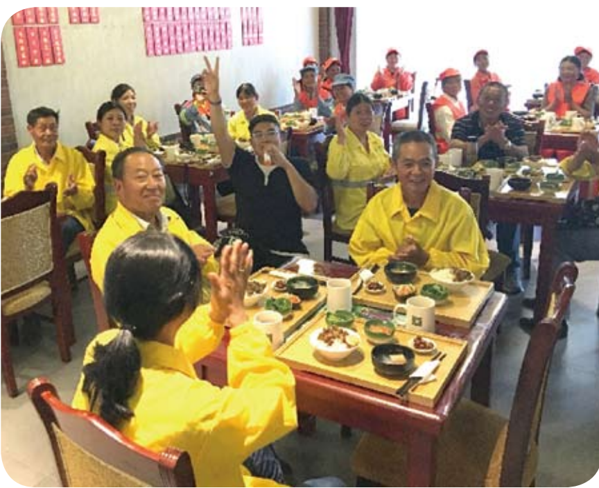
「一家親」餐廳多次舉辦公益食堂活動，免費邀請環衛工人用餐。