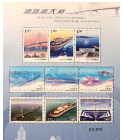
「港珠澳大橋」聯合紀念郵票。

「管理人員將通過覆蓋全橋的視頻監控、隧道內24小時持續的環境檢測和東、西人工島上專設的中華白海豚