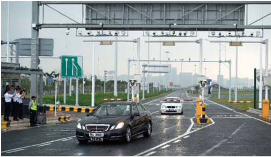
首輛私家車行駛在港珠澳大橋澳門口岸入境車道上。