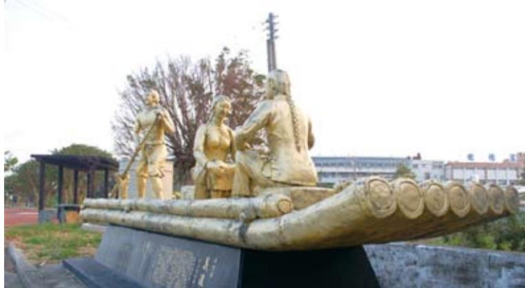
房裡溪畔的義渡舟塑像