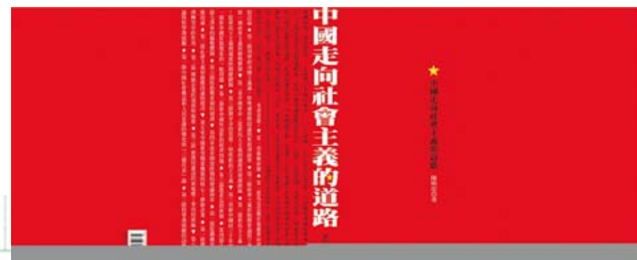
陳明忠《中國走向社會主義的道路》。