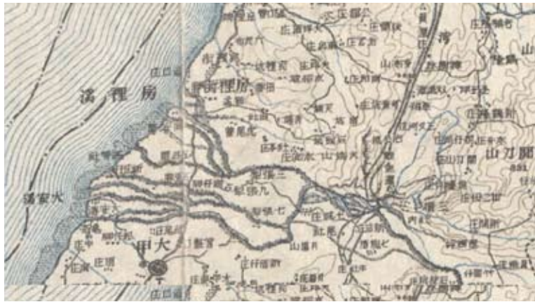
日據時期房裡溪形勢圖

文獻上最早出現的義渡是1741年（乾隆6年）由灣裡、麻豆兩莊申請設置的曾文溪義渡。而大甲溪的大甲義渡、濁水溪的永濟義渡，則最為著名。義渡之設置與分布，以台灣縣、鳳山縣最早；1836年（道光16年），淡水廳同知婁雲提倡普設義渡，是以淡水廳的數量最多。清代至少設置68個義渡，其中官設義渡12個，主要位於淡水廳、鳳山縣、恆春縣