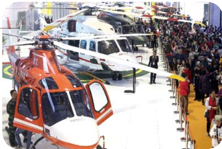
義大利萊奧納多直升機公司在進博會智慧及高端裝備展區展出的直升機吸引大量客商。