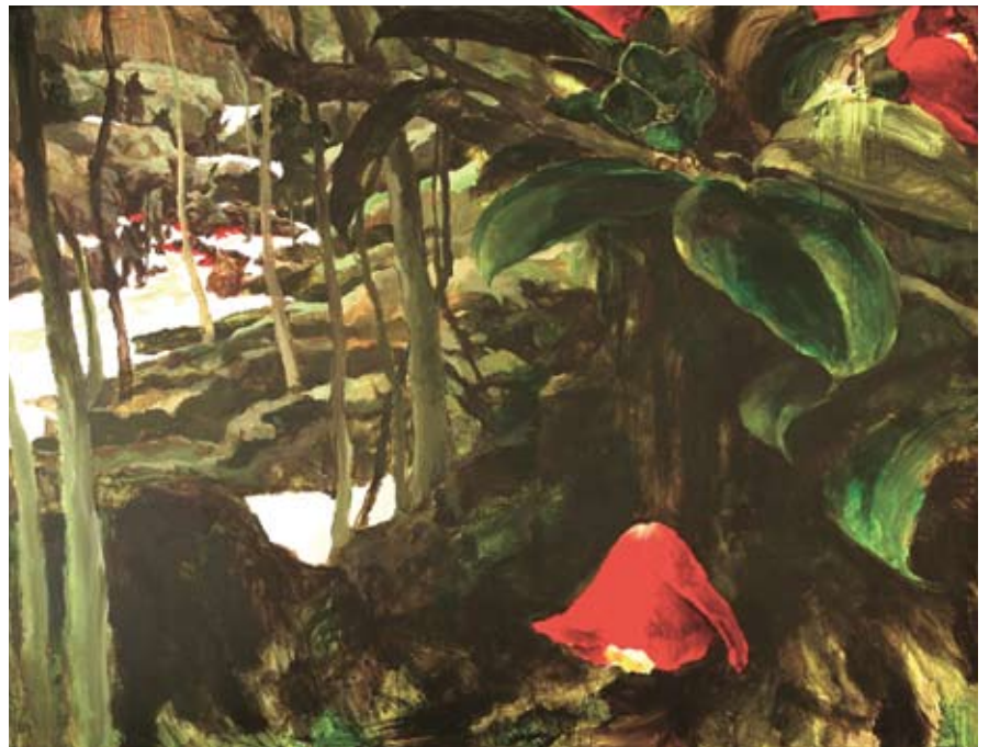
濟州姜堯培《落掉了，冬柏花》1991 油畫 130.6x162.1 cm

史家對唐太宗的政績美稱「貞觀之治」，唐太宗李世民在位22年（627-649），對照本省的「解嚴之治」31年（1987-2018），誰的表現比較令人稱心如意？「貞觀之治」里的；修訂律令，改善吏治，減輕負稅，使經濟復甦，人口增加，社會安定，人民生活改善，民族關係緩和，中外友好往來增多等等。「解嚴之治」幾無一項差堪可比。發思古之幽情，大家不妨努力做夢，萬一幸運夢遇李世民恍然隔世，歷史距離一千四百年，他的面目輪廓殊難辨認，只待夢醒時分，尋索初唐著名畫家閻立