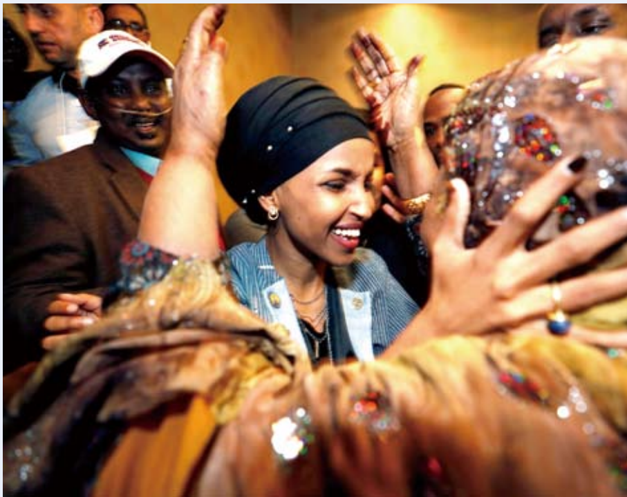
索馬利亞裔歐瑪（中）當選眾議院議員。

儘管婦女在此次美國中期選舉取得了史無前例的成功，但婦女眾議員仍僅佔眾議院的25%。婦女佔全美人口和投票者超過一半，但在國會、州長和其他全州性的公職候選人中，婦女仍少於三分之一。根據世界經濟論壇關於男女平等的排位，美國排名第49，在尼加拉瓜、古巴和白俄羅斯之後。美國婦女參政已經跨出一大步，但要走的路還很長。