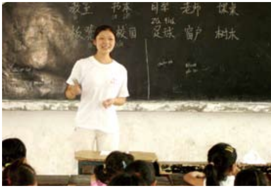
每年許多大學生赴偏鄉支教。

，為當地學生保留接受教育的機會。民間大規模的支教活動，就這樣與「撒點併校」政策幾乎同時開始。