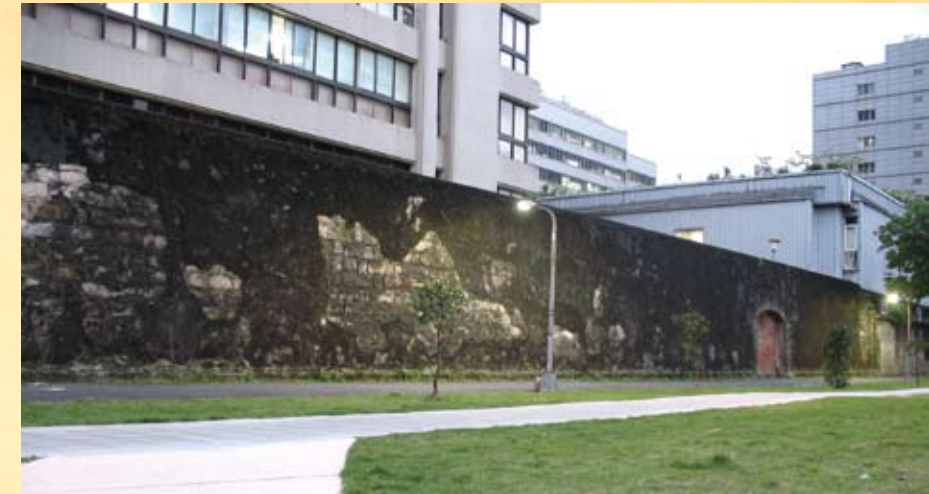
完成於1904年台北監獄的圍牆是當年拆除台北城牆來此建造的遺跡。

攻擊，以所持之鐵鎊其前額而死。驗屍時村田銃依然緊握於手，檢視其彈剩下十六發。後其屍由滬尾支廳暫為埋葬。一面照會其台北家族領歸，其家族答言「已不願再領」。其間，有涉庇護嫌疑者，皆於是日當場捕獲。