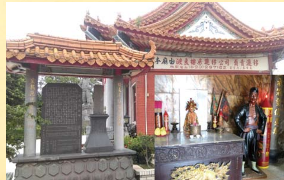
八里鄉民尊崇義士廖添丁所立的「漢民祠」和漢民碑，右下圖為祠內的廖添丁神像和塑像。

1909年11月17日廖添丁突圍後，赴關渡媽祖宮祈禱，等待翌夜即歸台中。待聽到圍已解，心大安，加以連日疲勞，乃在八里鄉老阡坑（又稱老梅坑）的農民楊興宅後山腹一處猴洞內熟睡。隔日，楊興同居者楊林知之，急密報於保正及派出所，派出所請滬尾支廳派人支援。於是，熟睡的廖添丁被楊林從正面