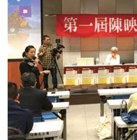
「第一屆陳映真思想研討會」現場。

序文展現了陳映真在政治與社會實踐上的主動性與能動性,在他豐富多樣的實踐領域中,還有包括社會性質、階級、宗教、第三世界、中國革命與性質等許多重大問題值得進一步的分析與探究,同樣也能從他的序文之中找到啟發。在陳映真一生的實踐過程中,序文只是一個討論的切入點。在過去那個風聲鶴唳的時代,研究者可以透過雜誌的編委會名單,或是某人計聞上治喪委員會名單去摸索背後的組織關係與人際關係。我認為研究陳映真的序文