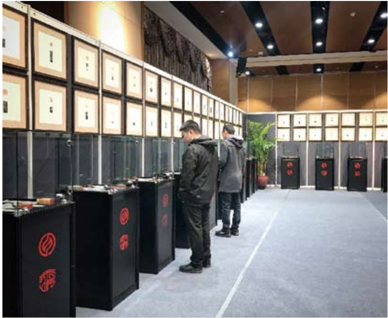
兩岸藝術家篆刻書畫展覽在北京台灣會館亮相 「國粹藝術中的兩岸融合」篆刻與書畫精品展11月8日在北京台灣會館開幕。展覽由中華全國台灣同胞聯誼會主辦，為期3天，共展出24位台灣篆刻大師及50多位兩岸書畫名家的作品。