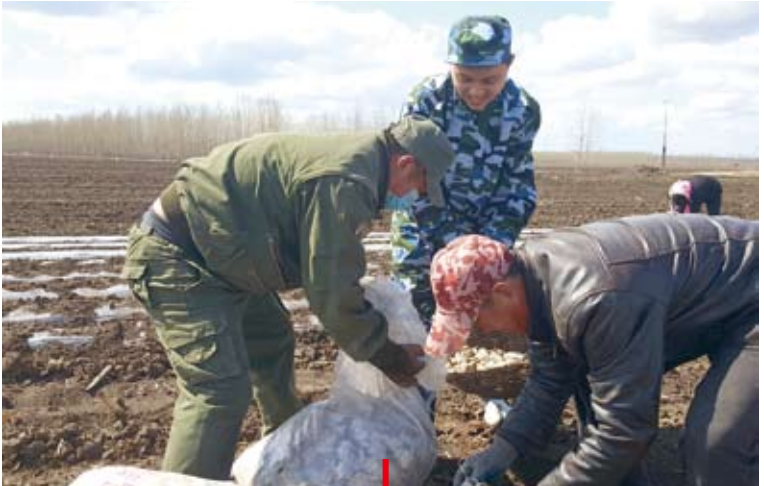
黑龍江對脫貧攻堅「終身問責」，圖為黑龍江省駐村扶貧幹部（中）帶領農民播種馬鈴薯。

從去年開始，大陸財政部針對地方債務問題進行了一連串問責查處，例如，去年就對江蘇、貴州兩省查實多起地方政府違法違規舉債擔保問題，除責令限期整改，還依法依規對70多名相關責任人啟動問責機制，給予行政開除、行政撤職、降級等不同程度處分。 通報顯示，經查實，2015年至