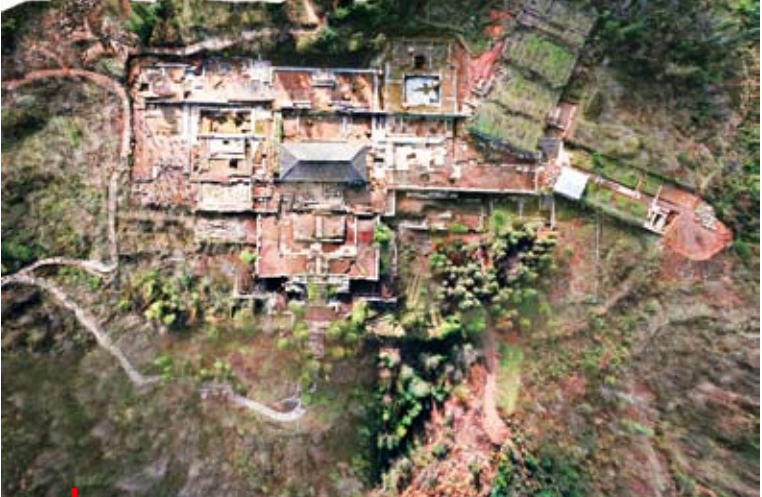
貴州省對文物保護「終身問責」，圖為空中看世界遺產貴州播州海龍屯新王宮（資料照片）。

2016年，江蘇省常州市金壇區，南通市通州區、海安經濟技術開發區，淮安市淮陰區、洪澤縣，鹽城市響水縣、阜寧縣、建湖縣，揚州市江都經濟技術開發區、高郵市，鎮江市鎮江新區、揚中 切實提高風險防控意識，紮實做好地方政府融資行為清理整改工作，穩妥推進融資平台公司市場化轉型，確保各項政策規定不折不扣落實到位。 在貴州，黔東南苗族侗族自治州的鎮遠縣和凱里市、銅仁市碧江區、遵義市匯川區、黔西南布依族苗族自治州興義市等因違法違規舉債擔保等問題被點名，14人依法依規受到相應處理。 值得一提的是，通報顯示，被問責人員當中，有部分人的職務與涉事時不同，甚至有些已被提拔。這意味著，無論在任與否，在地方政府官員違法違規舉債擔保問題上，終身問責將成為常態。