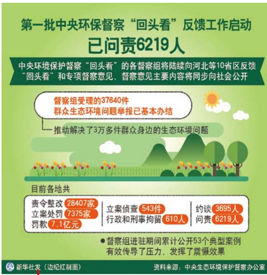
大陸第一批中央環保督察問責6219人。

有資產重組、上市等期間，特別是企業進行併購、採購等重大專案和決策時，其背後容易暗藏腐敗等風險。隨著大陸國營和投資的監管重磅文件，該文件提出，針對在經營投資中造成國有資產損失或其他嚴重不良後果的中央企業經營管理有關人員，形成分級分層追責和責任機制，同時對於實行重大決策終身問責。 隨著大陸國有企業資產經營環境的不斷變化，一些國有企業在改革過程中逐漸暴露出管理不規範、內部人控制嚴重、企業領導人員缺乏制約等問題。近年來，大陸國資委為加強國資監管，已經頒佈一系列相關制度。2008年國資委曾制定《中央企業資產損失責任追究暫行辦法》，對央企運營過程中出現的違規和資產損失進行追責。2015年至今國有資產監