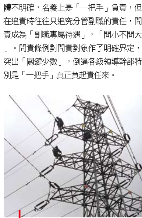
山東省實行安全生產責任終身問責制。圖為工人在高空作業。

利局違規購置公務用車並與下屬單位調換車輛、白條入賬違反財經紀律等問題，受到黨內嚴重警告處分。這兩名被問責的幹部即使已被調離原崗位，或進行了職務調整，原單位出現問題後仍然被問責。 因在颱風「尼伯特」救災過程中工作不力，福建閩清縣委副書記、代縣長黃詩揚被停止職務，後被處以黨內嚴重警告處分。河北邢台市發生連續強降雨，山區大面積山洪爆發，一些村民在睡夢中遇難。一周之內，邢台至少5名幹部被停職檢查，依據條例進行追責。 南開大學周恩來政府管理學院教授徐行表示，在以往各地的實踐中，啟動問責程式往往過期相對較長，「事後追責」的意味比較濃。「終身問責」條例實施後，給公眾的感覺首先是快了很多，達到條例列舉的情形便迅速啟動，雷厲風行。 徐行說，過去，一些問責情形的問責主