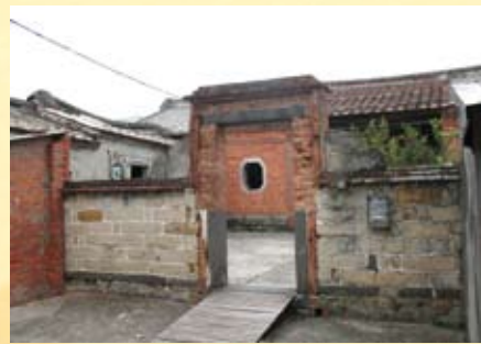
1874年開始興建的張家大厝，為庄內年代最老的三合院古厝。

挖仔尾因屬於海河交界的水岸區域，有沙嘴地形，經過時間的累積形成了潟湖地形。此處有珍貴的植物水筆仔，以及招潮蟹和彈塗魚。已被列為挖仔尾自