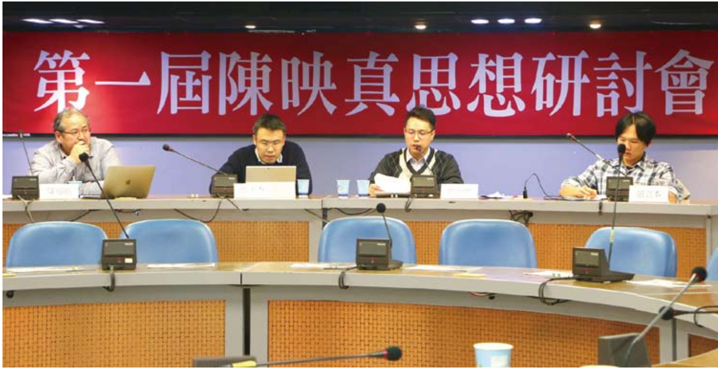
本文作者(右二)在「第一屆陳映真思想研討會」上發言。