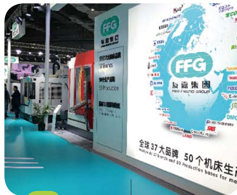
台灣友嘉集團在進博會上的展台。

週一在紐西蘭擠奶、進入工廠加工，晚上上飛機，週二到上海，開始清關配送，週三送上消費者的餐桌。這不是奇幻，而是正在發生的現實。參展進博會的紐仕蘭牛奶，以這樣的方式走進越來越多的中國大陸家庭。 食品及農產品館的展商埃爾山，來自遙遠的亞塞拜然。11月7日下午，他接待了一批來自大陸茶葉有限公司的客人。「這些大陸客人原來只知道亞塞拜然的石油，看到我們有茶葉，既吃驚也興奮。他們把隨身攜帶的中國烏龍茶樣品送給我們，還加了微信，約定繼續談。」埃爾山說。 巴西的咖啡豆、格魯吉亞的紅酒、德國的汽車、美國的智慧設備、韓國的護膚品，既有發達國家，也有發展中國家和最不發達國家，既有跨國公司，也有中小企業。預計今後15年，中國大陸進口商品和服務將分別超過30兆美元和10兆美元。 瑞士企業ABB近日宣佈將在上海投資1.5億美元新建一座全球先進、柔性化的機器人工廠，實現「用機器人製造機器人」。工廠預計於2020年底投入運營。 當下，一部汽車的組裝需要幾十個經濟體提供零件，一架客機更需要1000多個大公司和上萬家中小企業的協力。沒有哪個國家願意成為經濟全球化時代「被遺忘的角落」，也沒有任何企業會拒絕發展的重大機遇。 「一位難求」是首屆進博會參與企業與商家的共同感覺，但也正如新華社的評論，中國大陸的市場足夠大，這次進博會的容量足夠大，世界合作的舞台足夠大，就看看能不能把握住機會。