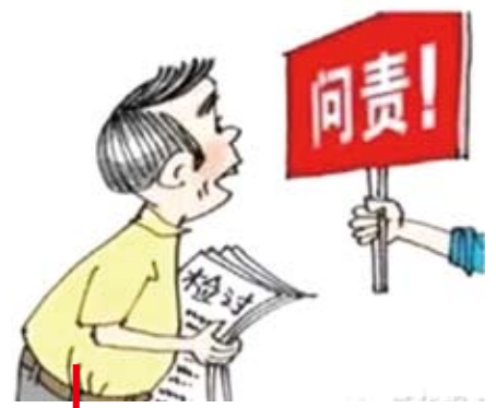
聚焦《問責條例》四大看點。