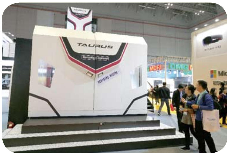
備受關注的「金牛座」龍門銑。