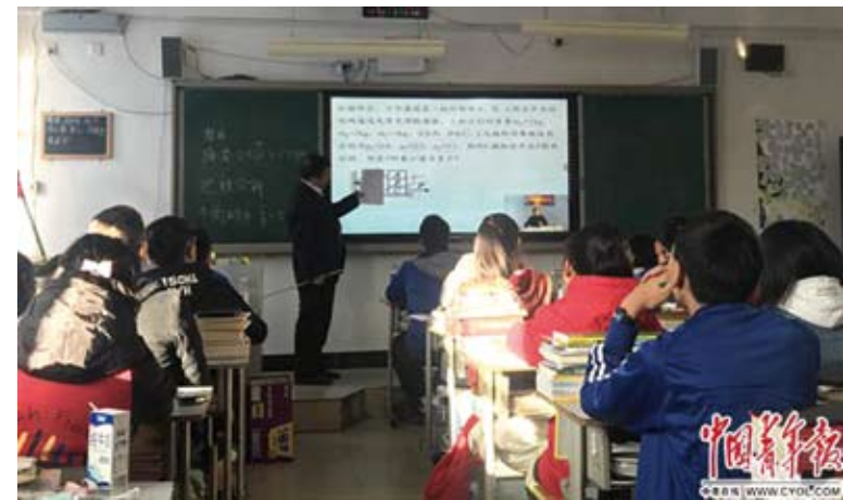
雲南祿勸一中的學生在上網路直播課。