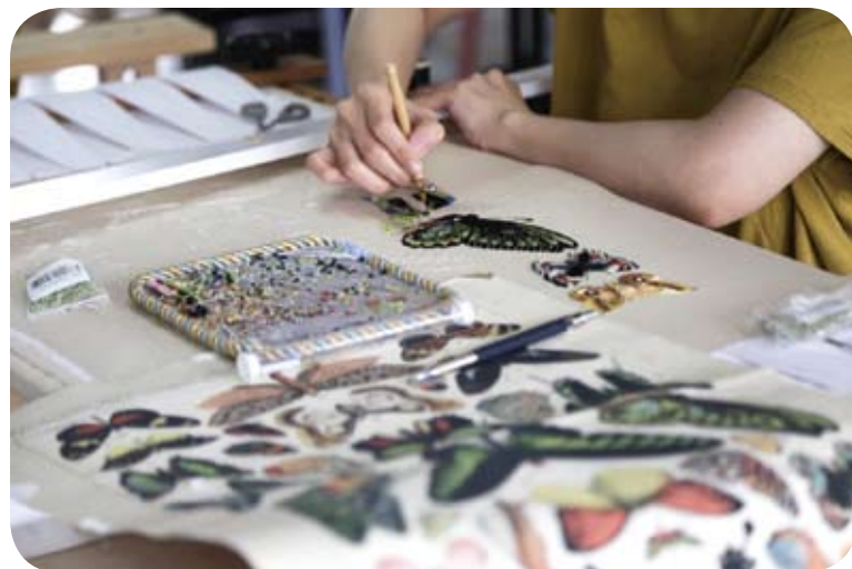
縷薇工作室展示的法式刺繡技藝。

在縷薇工作室的書桌上堆放著厚重的《明清繡品》等書籍。這組突破陳規的兩岸好搭檔，希望從中華優秀傳統文化中不斷汲取營養，不斷創新。