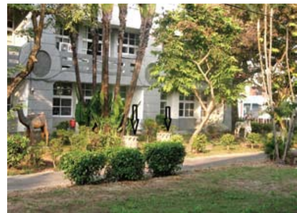
在清代屬於雲嘉共同生活圈的嘉義縣溪口鄉，至今鄉內的溪口國小，仍保有如箭頭所指的製糖石車。

官姿態」，如南鯤鯓代天府即是具有歷史的台灣王爺總廟，內祀李、池、吳、朱、范等五府千歲和一位萬善爺（囡仔公）。舊時王爺的「三年一醮」祭祀是非常豐富隆重，有瘟疫時亦要請王爺來鎮壓。建醮的目的，不僅僅是祈神酬恩，更添加了施鬼祭魂的雙重意義。福建並有「王船」的習俗，將王爺神像連同祭物糧食載在一艘特製的船中，任其飄流，這種船上面旌旗招展，桅帆俱備，也很威武，假如某個村落有王船飄到，該村便要迎神奉祀一番，再將之放流。後人多有直接建廟，使其留下以保護民眾。據說南鯤鯓廟的王爺，便是這樣飄來的。 而王爺的乩生和筆生降駕附身時，往往亦幫百姓消災解厄；替神明辦公事時，大部分只講說公