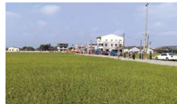
在二期稻成熟前四處繞境的馬鳴山鎮安宮五年王爺陣頭。

會特別要求節約，而當時迎五年王爺，除一般祭祀外，還包含「繞境遊行或迎神賽會」。這也同時反映於現在常見的五年大科儀式，有些聚落已經主動將謝平安儀式與五年大科結合在一起辦理，即很有可能是受到這時統一祭典的政策影響，不過，對地方而言，謝平安可以合併減省，但五年王爺四年才一輪，實在不能減除或怠慢，所以，仍擋不了鄉民對「五年王爺」信仰的虔誠。如1962年10月28日中國時報以「五年王爺祭典，西螺沿海雞鴨遭殃」為標題，報導「雲林縣沿海地區鄉鎮，每五年舉行一次的『五年王爺祭典』於農曆十月一日起至三十日一連三十天在麥寮、崙背、東勢、褒忠、台西等鄉鎮盛大舉行。拜拜期間，所屠宰雞鴨等家畜可謂無數，僅豬一項，宰殺近萬頭左右。」在最近十