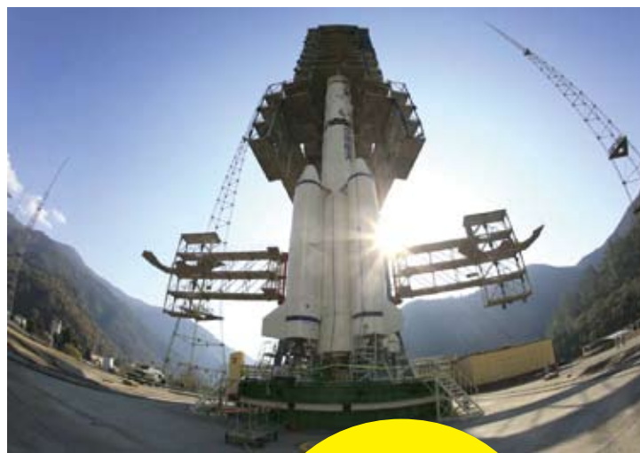
佇立西昌衛星發射中心發射架上的長征三號乙運載火箭。

此次大陸成功發射的嫦娥四號探測器，科學任務主要是開展月球背面低頻射電天文觀測與研究；開展月球背面巡視區形貌、礦物組份及月表淺層結構探測與研究；試驗性開展月球背面中子輻射劑量、中性原子等月球環境探測研究。