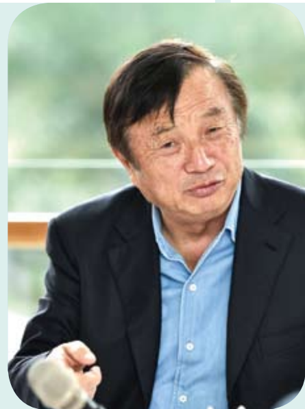
任正非接受新華社記者專訪。

在人工智慧領域，目前我們主要做基礎研究，用於改進內部管理，如果要運用到產品上，還存在相當長的時間和距離。對於前沿科學，研發實行先「開一槍」，「讓子彈飛一會兒」；看到線索再「打一炮」，只需要小範圍研究討論就能決定；如果攻「城牆口」需要投入「范弗里特彈藥量」（意指不計成本地投入龐大的彈藥量進行密集轟炸），由管理層集體決策。