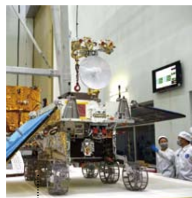
「嫦娥四號」月球探測器經過科學技術人員的改造，由備份成爲首飛。

長征三號甲系列火箭由長征三號甲、長征三號乙、長征三號丙（長三甲、長三乙、長三丙）三種大型低溫液體運載火箭組成，是長征系列運載火箭高強度、高密度發射的主力，是大陸目前高軌道上發射次