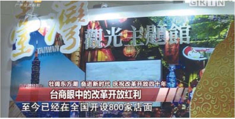
大陸電視媒體製播「改革開放四十週年」台商系列報導。

今年初，大陸公布的「31條措施」，其中不少內容是為台企提供與大陸企業同等待遇。浙江寧波台企敏達機電有限公司享受與陸企相關稅費優惠的同等待遇後，每年節省成本近1400萬元人民幣，公司因此可以增加研發投入，實現營業額年均20%的增長。「我們在研發費用、技術升級、設備改造方面更敢於投入，對未