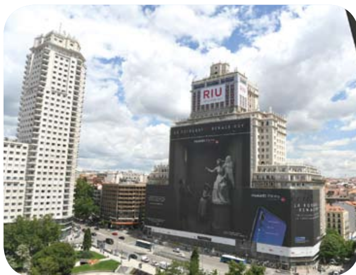
華為年報：2017年銷售收入突破6000億元人民幣。照片為位於馬德里市中心的西班牙大廈掛出華為P20 Pro手機超大幅廣告。

任正非： 我相信國家會更加開放。第一，通過開放，讓更多的人進來，企業能夠在國際化的環境中公平競爭。第二，現在，經濟發展環境很好，堅持法治化、市場化的道路，就能托起企業的理想和夢想。今天，我們正在認真做好知識產權的保護，這一點做得越好，原創就會越來越多，創新就會無限。