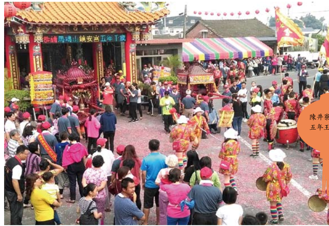
陳井寮保安宮在農曆十月十日迎請馬鳴山五年王爺後，在廟前舉行迎神祭典。