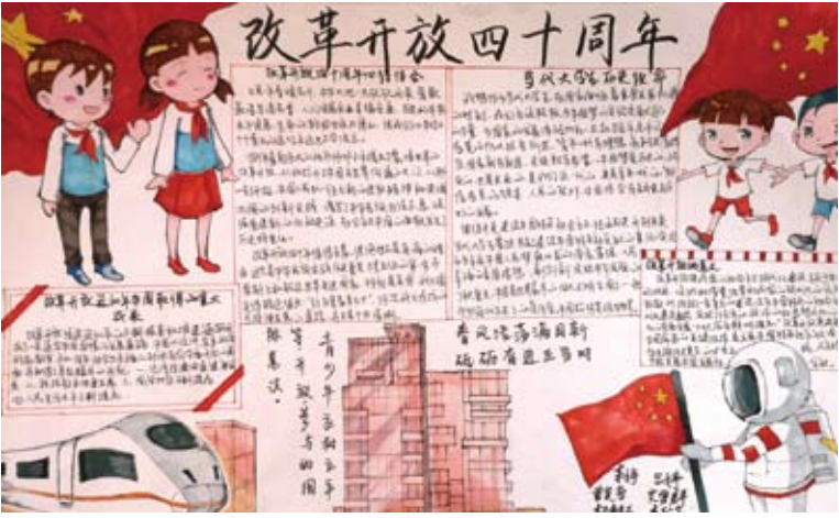
大陸各地舉辦一系列「改革開放」慶祝紀念活動，照片為某中學的「改開四十週年」手繪海報。