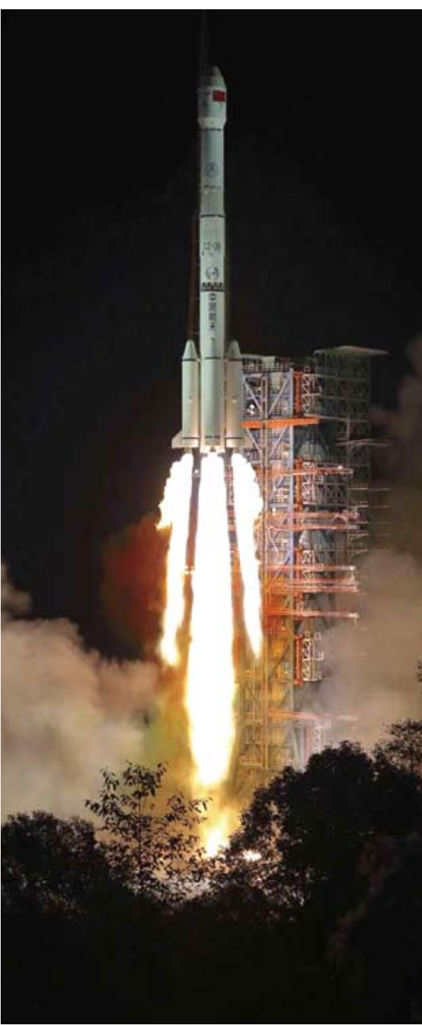
長征三號乙運載火箭載著嫦娥四號探測器完成「零視窗」發射。