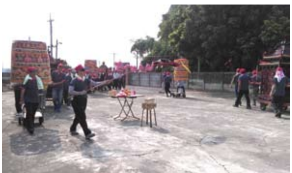
迎請的馬鳴山鎮安宮五年王爺在陳井寮莊內繞境。

年的報導，也有雲林麥寮鄉五年王爺祭典，在台塑六輕廠區隔離水道旁燒著耗資近200萬元建造的王船，大批民生用品，還有124隻活的雞、鴨，隨著王船一起敬獻給王爺的盛況；甚至有五年王爺出巡，北港媽祖陪繞境的盛舉出現。