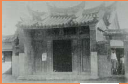
日據時期的保安宮

2018戊戌年11月，正逢台灣九合一選舉的月份，位於嘉義縣大林鎮西結里的陳井寮莊，除了各選舉人的宣傳造勢外，最熱鬧的莫屬莊內的保安宮在每五年舉行一次的「五年王爺（千歲）」迎神祭典。也稱作「五年到」、「五年大科」，即逢寅、午、戌年辦理恭迎馬鳴山鎮安宮五年王爺的相關儀式。實際上五年大科為四年一次，因為頭尾年份同時計入，所以稱之為五年大科。它是雲嘉平原各村莊，重要的跨聚落信仰儀式，從嘉義市、彰化市來參拜者也不少。由於此次陳井寮保安宮祭典日期的農曆十月十日，適逢週休二日，吸引不少北漂游子和家庭返鄉參與。從嘉義縣大林鎮保安宮到雲林縣褒忠鄉馬鳴山路程近四十公里，迎神陣頭車隊在當日一大早出發後，中午即返回。和以前克難式的迎神大相逕庭。據說，早年交通不便，迎神陣頭下午徒步去馬鳴山迎請，隔天傍晚才回來。中午則吃挑飯擔；碰到