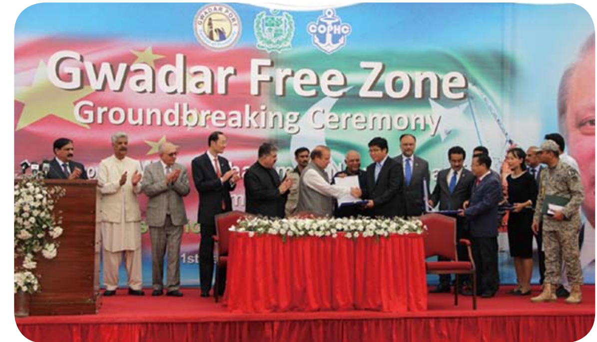
瓜達爾自由區開園啟動儀式。

過去部分當地民眾對開發瓜達爾港存在誤解，但現在這一情況似乎已經改變，瓜達爾將以瓜達爾港建設為龍頭，逐步帶動其他領域發展，希望最終能成為巴基斯坦的經濟特區。未來7到10年，瓜達爾或將成為一座清潔、美麗、高效、繁榮的中等港口商貿城市和旅遊城市。