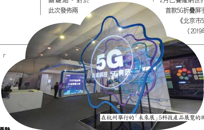
在杭州舉行的「未來展」5G科技產品展覽的現場。