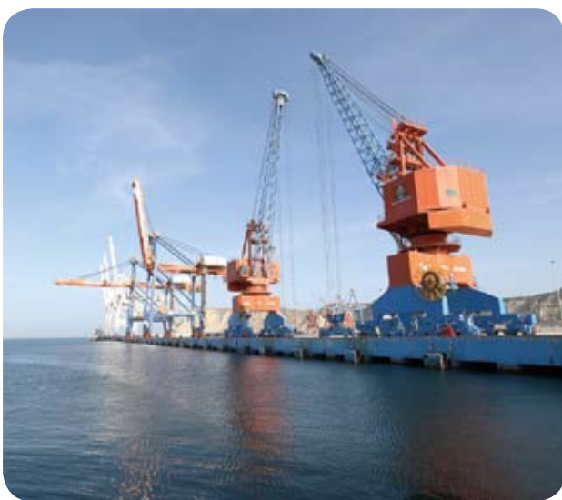
巴基斯坦瓜達爾港一角。

陸媒《參考消息》刊登了一篇前巴基斯坦大使陸樹林的文章〈親歷瓜達爾港從夢想變為現實〉，該文指出巴基斯坦原本只有卡拉奇一個港口，從1960年以後就有意建設第二大港，而最合適的地點就是瓜達爾。1965年和1971年兩次印巴戰爭中，印度派軍艦封鎖卡拉奇港，給巴基斯坦造成巨大的困擾，更堅定了在瓜達爾建造第二大港的決心。但由於資金和技術等方面的原因，以及西方國家對此也無興趣，所以巴方的願望一直不能實現。