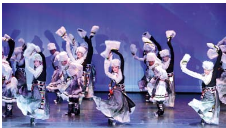
2019年第二屆「七彩雲南·相約台灣」大型文化交流活動於春節期間在高雄佛光山佛陀紀念館舉行。

據了解，以「弘揚中華文化、共賀新春佳節」為主題的第二屆「七彩雲南·相約台灣」文化月系列活動於2月1日至18日在佛光山佛陀紀念館舉辦，並將拓展至台北、高雄、澎湖、花蓮、南投等縣市，部分活動將持續至3月10日。