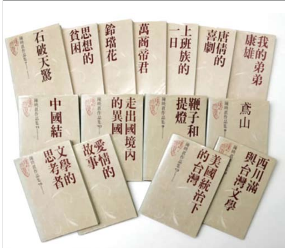
鄭鴻生認為，陳映真先以優秀而感人的小說奠定了在年輕讀者心目中的地位。