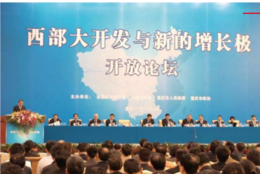
大陸西部大開發戰略為台商向西挺進開道。