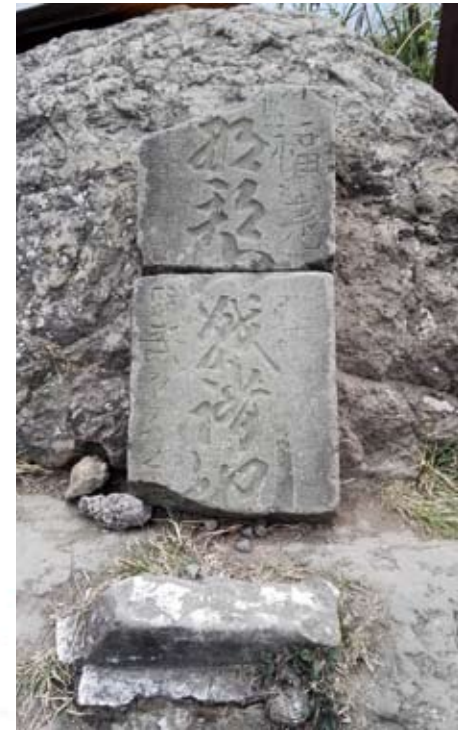
「馬那邦山戰諸地」紀念碑

自該年的7月開始，發生了為期半年的戰事。為了瞭解該事件，我們在下山後，稍作休息，近中午便驅車往南庄出發。