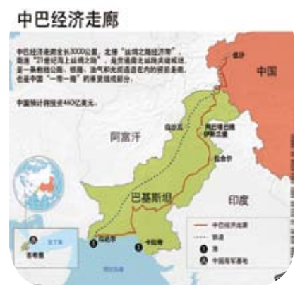
「中巴經濟走廊」示意圖。

事實上，巴基斯坦對中巴經濟走廊的支持可以說是全民共識。去年巴政府更迭，正義運動黨在大選中獲勝，曾對中巴經濟走廊有過微詞的該黨領導人伊姆蘭·汗，在大選獲勝講話中立即聲明，他過去對經濟走廊講的話，是針對謝里夫政府的，決不是針對中國大陸的。他在就任總理的就職演說和會見大陸大使時信誓旦旦地表示，新政府將堅決支持中巴經濟走廊理念和走廊各個專案的實施，他還表示將在反腐和扶貧方面向中國大陸學習。