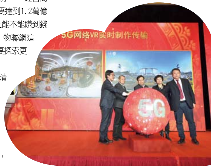
大陸央視聯合中國聯通、華為公司在吉林長春啟動5G網路VR即時製作傳輸測試。