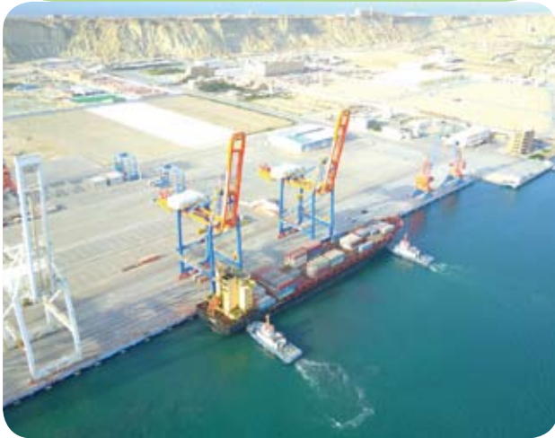
一艘集裝箱貨輪停靠在巴基斯坦瓜達爾港。

編按 2018年11月13日，位於巴基斯坦由大陸運營的瓜達爾港正式開航。當天下午，大陸的中遠「惠靈頓」貨輪從新建的瓜達爾港出發，將來自新疆喀什的貨物轉運到中東和非洲。由於，世界石油的60%、中國大陸進口石油的80%，要經過實際由美國控制的新加坡馬六甲海峽。因此，突破馬六甲海峽的戰略鉗制，成為中國大陸必須突破的戰略瓶頸。而恰好在波斯灣北岸、巴基斯坦西南部，一個戰略性突圍點瓜達爾港，進入了中國人的眼中。這個港口一直靜靜地座落在巴基斯坦西南部，直到21世紀的今天，在中巴合作下忽然放射出耀眼的光芒！