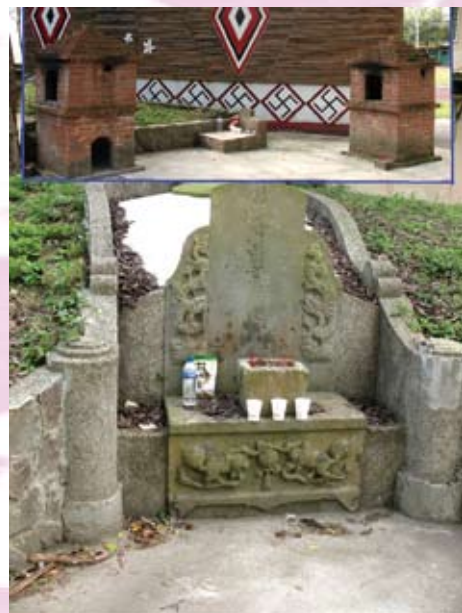
南庄國中內的萬善爺墓，右上方有「乙亥年孟冬重修」的字樣；上圖為墓側的泰雅、賽夏族圖騰。

回首來時路，我們造訪了1895年乙未抗日和1902年南庄事件抗日的遺跡，體會到日本殖民者因台灣島內包括樟腦在內龐大的經濟利益，而不斷向漢人和原住民巧取豪奪，這不僅是一段被殖民的辛酸史，也是身為台灣人不能忘記的一段悲壯歷史。