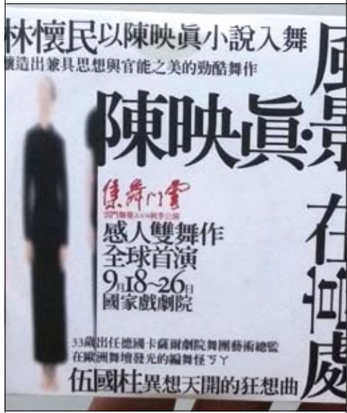
雲門舞集的《陳映真·風景》。

兩岸分斷深深涉及到中日兩國的糾葛，這一直是生於日據時期的陳映真先生自覺承擔而亟思破解的大迷障，因此在他苦心孤詣為分斷尋找化解之道時，也真誠面對了中日兩國在現代化過程中的相互糾結。他的〈忠孝公園〉在世紀之交的政局變動中，再次以其全中國與東亞的格局直接面對百年來的台灣與大陸，以及中國與日本，在國家、家族，及個人層次所形成的歷史難題。日本帝國與國民黨正是兩岸分斷的歷史因素，而陳映真先生仍然抱持著仁愛之心，哀矜勿喜地對待他一生的對手遺留在台灣的