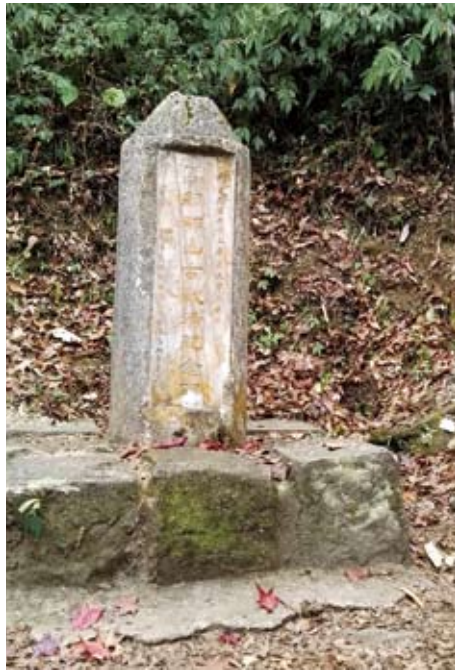
馬那邦山古戰場紀念碑

擊戰與日軍周旋了月餘，最後，兒玉源太郎總督增兵在附近山頭設置砲台，並於11月12日征討大安溪右岸駐守大克山的馬那邦社原住民，11月25日將馬那邦社全部燒棄，原住民紛紛避居大安溪上游，從此，絕跡於馬那邦山脈以西地區。兩次戰事，日軍蒙受重大損失，為弔念戰死的日警日軍，在石門、馬那邦山頂、梅園石壁、大克山鞍部等地，勒石紀念。